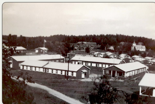
Baracker i Öreryds flyktingläger 1940–1946. Barackerna är idag rivna.

Våra dagars minnessten står på samma plats som det första flyktingkontoret. Kvar av det stora lägerområdet är bara två baracker, nu ombyggda till missionskyrka. Bakom den gamla byskolan ligger Quislinggölen där avslöjade landsförrädare straffades med att doppas i vattnet.