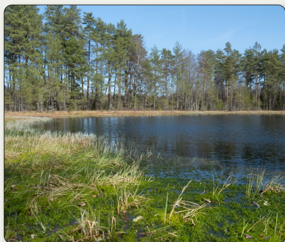
Quislinggölen där landsförrädare som avslöjades straffades med dopning i vattnet.