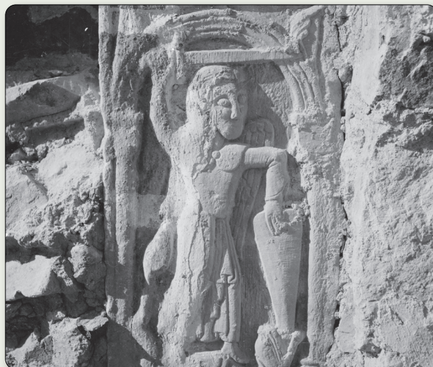
Den inmurade reliefen med S:t Mikael som slåss mot draken sitter idag inne i kyrkan. Stenen har ingått i omfattningen till kyrkans äldre ingång i söder.

Nära kyrkan finns tre gravfält som visar på kontinuitet på platsen från vikingatid fram till den storman som lät bekosta kyrkobygget under 1100-talet.