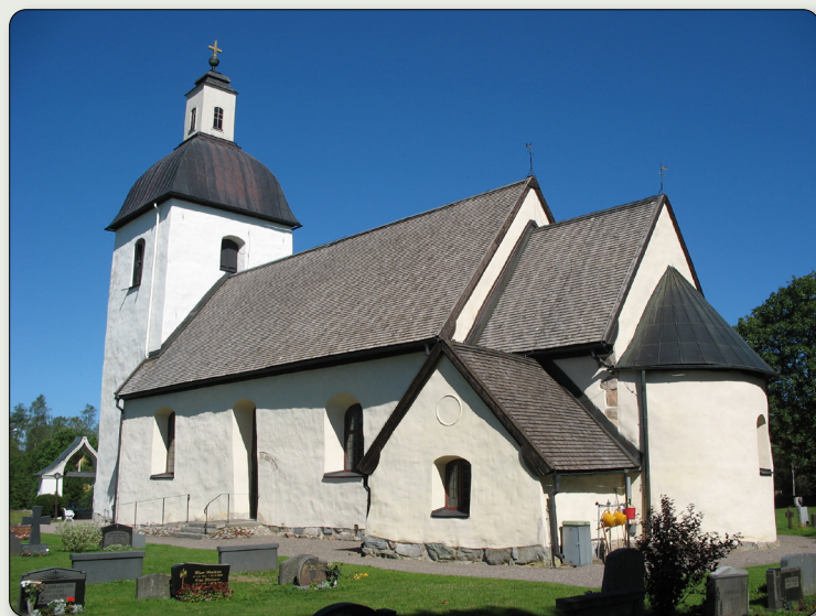
Här syns Hylletofta kyrka med sakristian som placerats på "fel" sida. Troligen eftersom sakristian behövde stötta upp den södra väggen på koret när den byggdes.