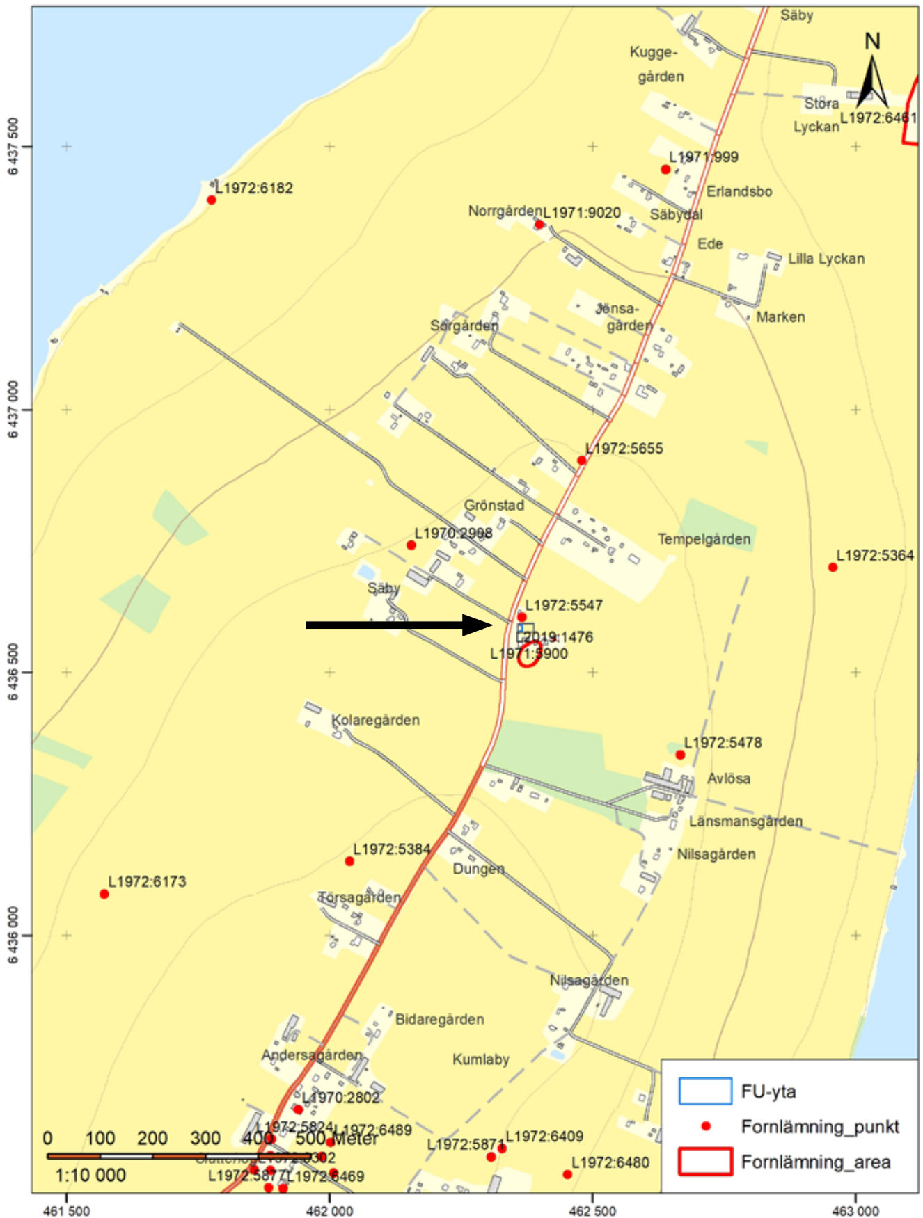
Figur 1. Utdrag ur ekonomiska kartans blad 64E 3gN. Skala 1:10 000.