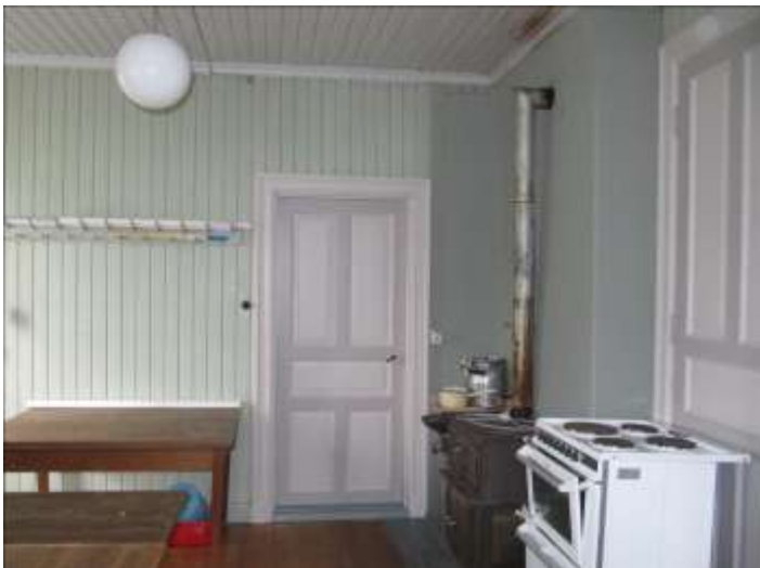
Lilla salen efter ommålingen.