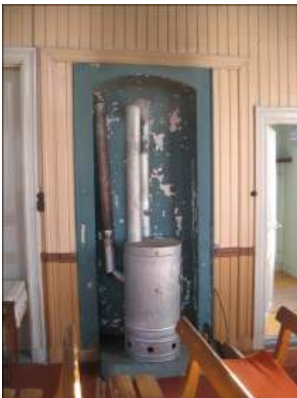
Järnkaminen i stora salen.