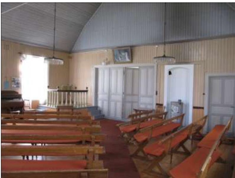
Stora salen efter restaureringen.