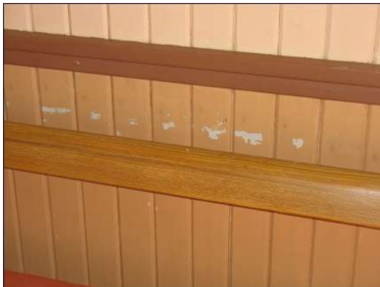
Exempel på stötskador i stora salen.