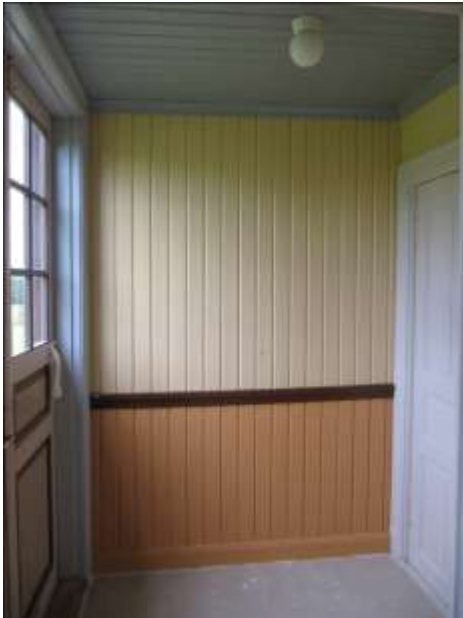
Vindfånget under pågående arbeten. Dörrbladet är grundat.