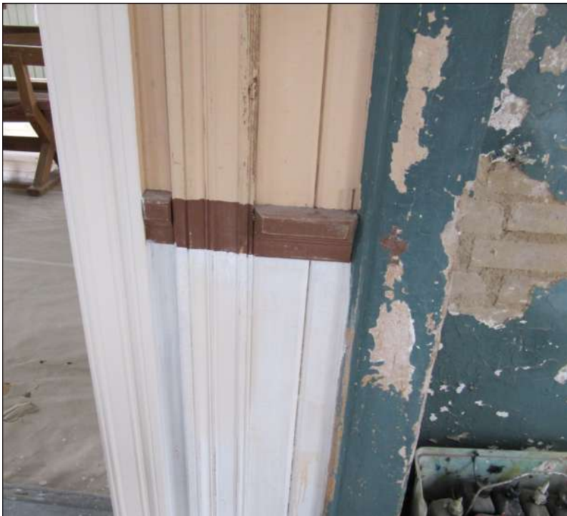
Detalj av eldstadsbegränsningen där flagningen visar att denna haft samma färgsättning som omkringliggande väggar.