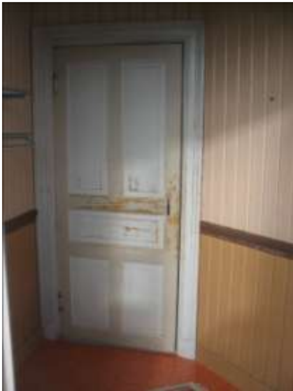
Vindfånget invid stora salen inför restaureringen.