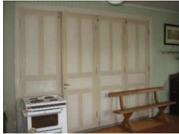
Lilla salen med dörrpartiet mot stora salen inför restaureringen.