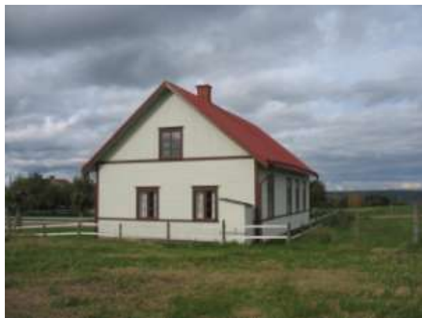
Södra fasaden efter ommålningen. Foton 2007