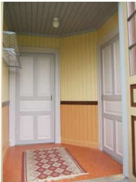
Vindfånget efter ommålingen.