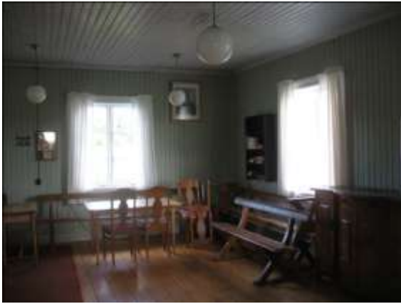
Lilla salen inför restaureringen.