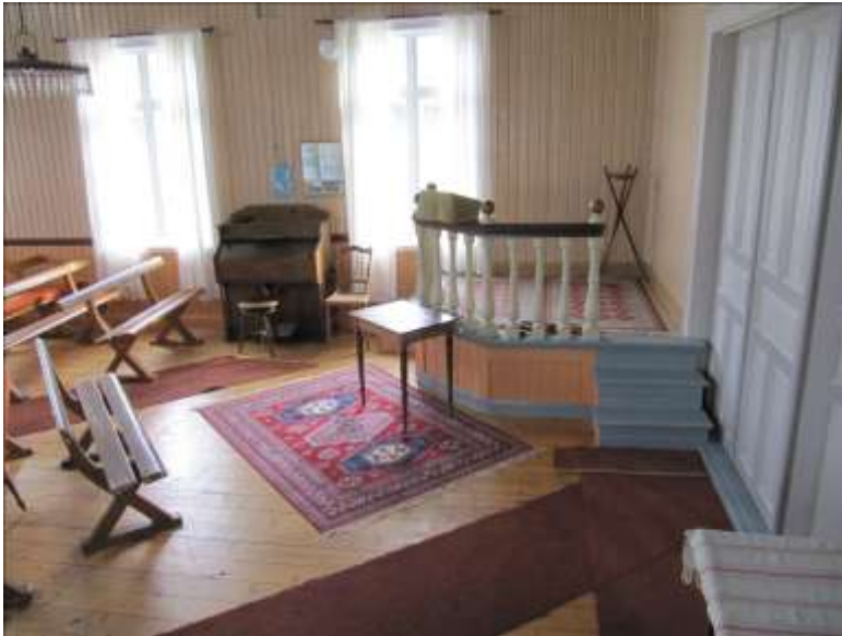
Podiet efter ommålingen.