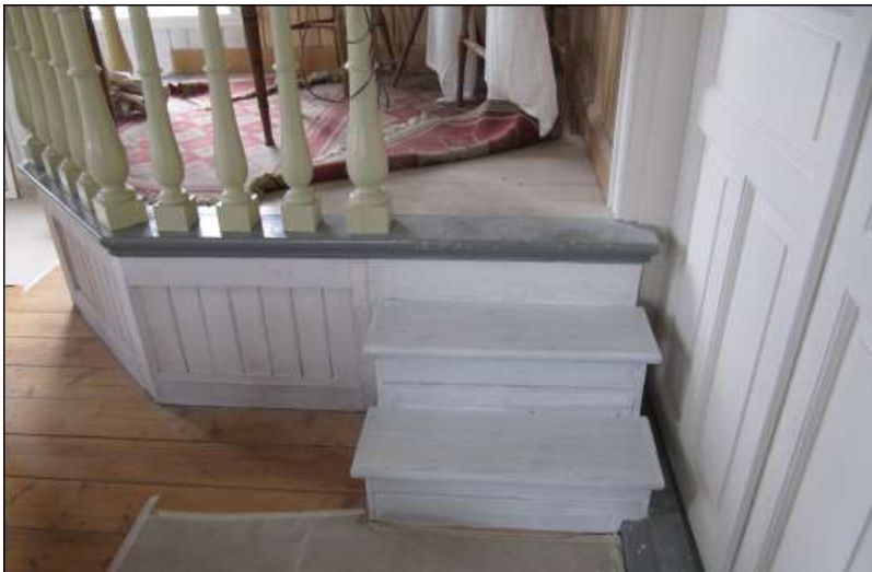
Här har podiets front och dörrarna mot lilla salen grundats.