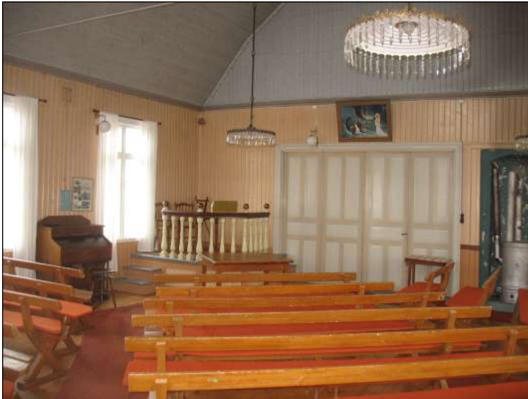
Stora salen med podiet inför restaureringen.