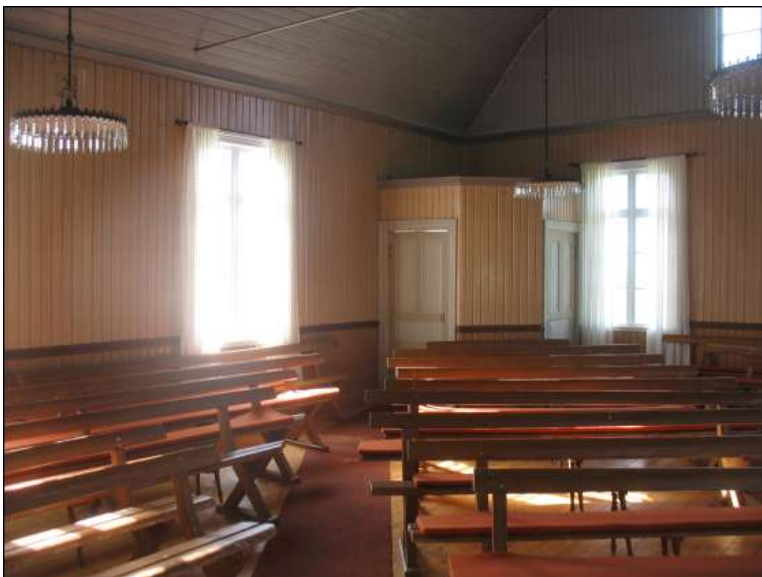
Stora salen med vindfånget inför restaureringen.