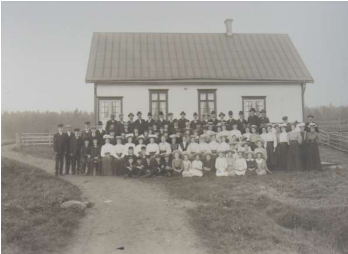
Hallingstorps kapell, invigt 1907. Foto omkring 1910