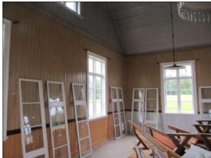
Här pågår ommålning av stora salens fönster.