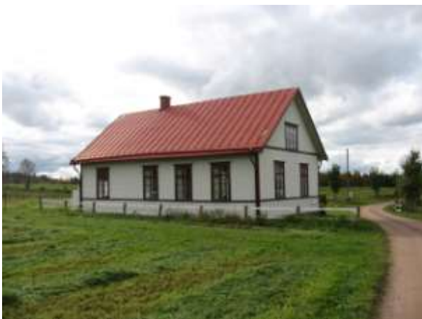
Norra och östra fasaden efter ommålningen.