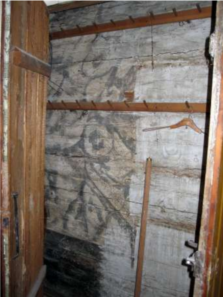
I portgången finns en garderob som, enligt uppgift, inte öppnats på många, många år. De bevarade, äldre skikten i denna inbjuder till en byggnadsarkeologisk analys, som inte rymts i detta projekt.