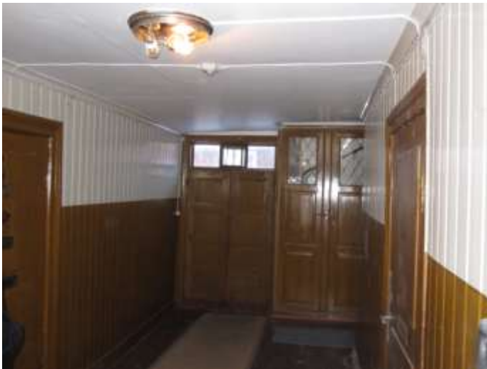
Översikt över portgången efter restaureringen.