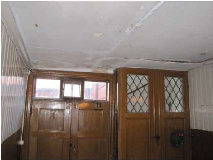
Taket vid utgången till bakgården.