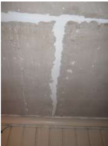
Detalj av den rengjorda och avtvättade pappen i taket.