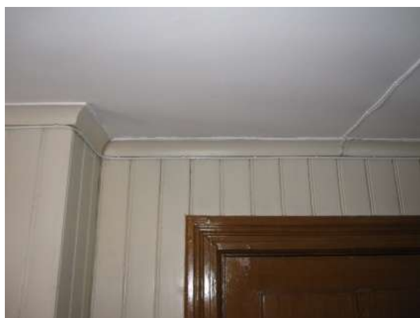
Detalj av innertakets restaurerade papptak.