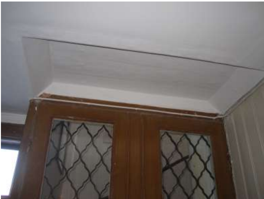
Partiet invid dörren mot trapphuset med den återställda konstruktionen.