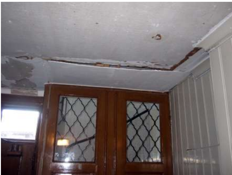
Invid dörrarna till trapphuset fanns ett parti av taket som hade en annan konstruktion än det övriga papptaket.