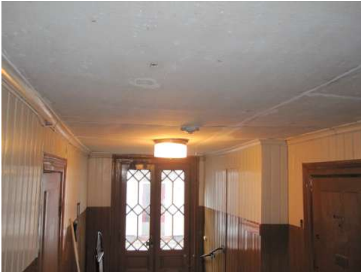
Papptaket i portgången inför arbetena.