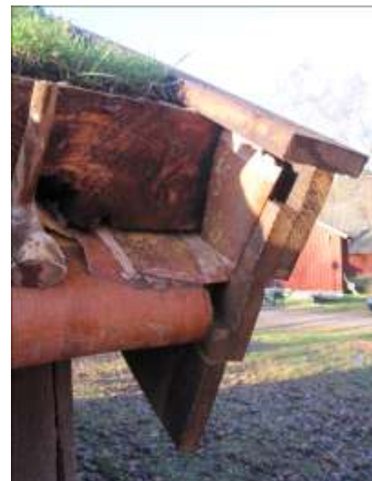
Ett omlagt hörn av taket.