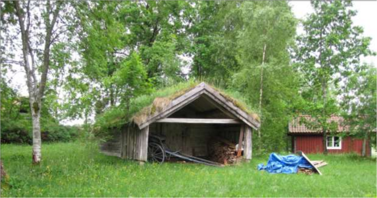
Linbasta inför restaureringen. På takfallet till vänster växer ett litet träd.