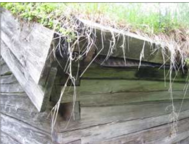
Takets hörn med vindskivor och synlig Platon-matta.