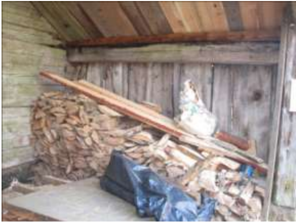
Gavelsvalen efter byte av flera takbrädor.