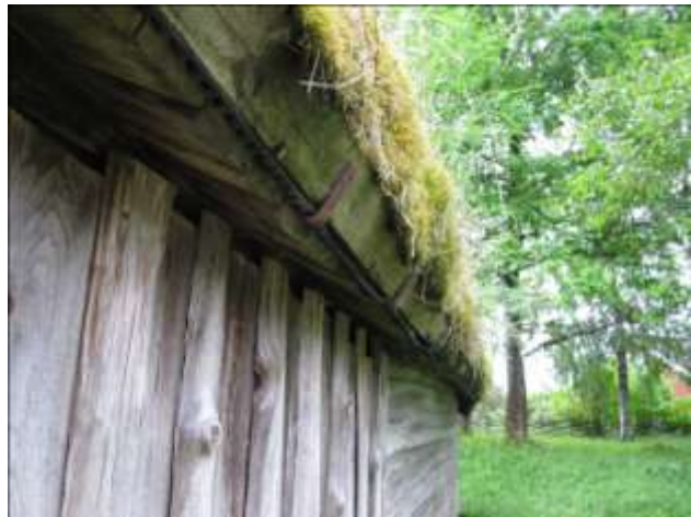
Takfoten med mullstocken.