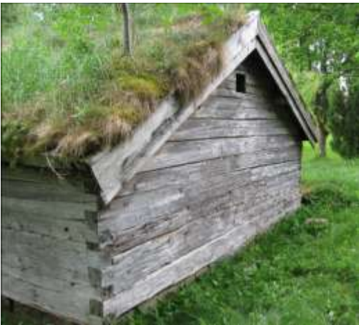
Den bakre gaveln inför restaureringen.