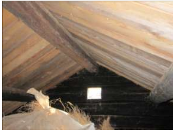
Flera av undertakets brädor fick bytas.