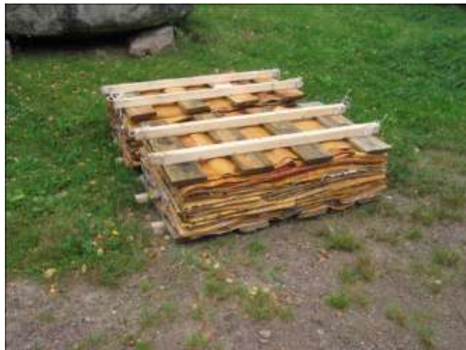
Nävern inför läggningen.