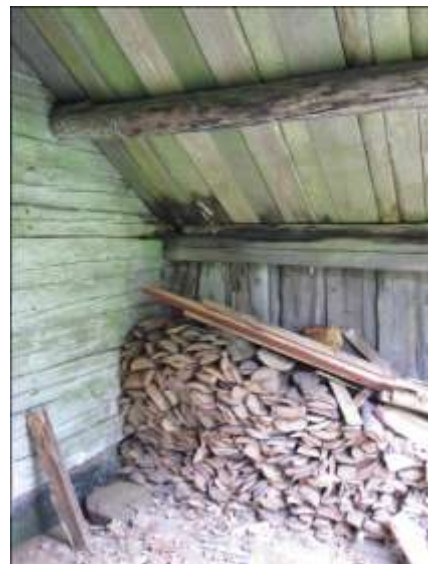
Gavelsvalen med rötangrepp i undertaket.