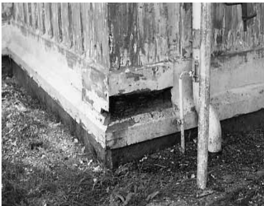
Ovan: Rötskador vid takfot och på syll. Nedan: Lagning på södra fasaden, med hyvlade panelbräder av furu.