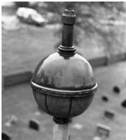
Ovan: Kopparklot på klockstapeln. Nedan: Klockstapeln under pågående arbete med spåntäckning juni 2008.