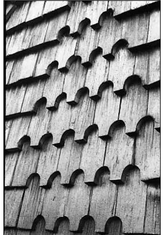
Ovan: Spåntäckning på klockstapelns gavel vid besiktning 25 september 1998.

Rötskadade partier av fasadpanelen ersattes med nya hyvlade bräder av utvalt virke, kärnfuru. Ytorna skrapades rena från träludd. Målningen av fasaderna påbörjades under augusti med grundning och mellanstrykning. Målningen utfördes med kallpressad linoljefärg av Engvall & Claessons tillverkning (färgvalet var en avvikelse från programmet, som föreskrev WIBO). Arbetena kunde inte av-