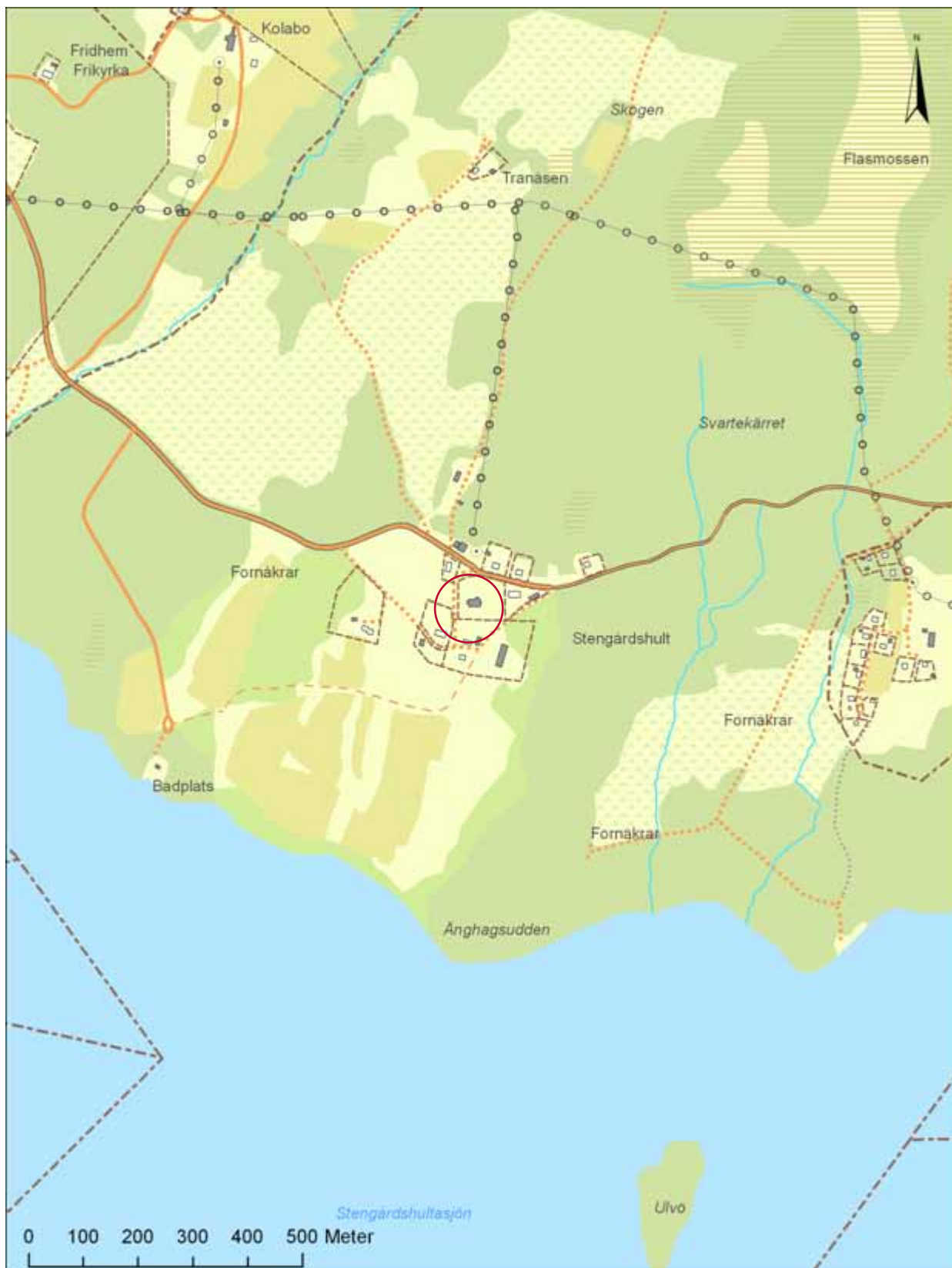
Utdrag ur ekonomiska kartans blad Stengårdshult 6D 6g.