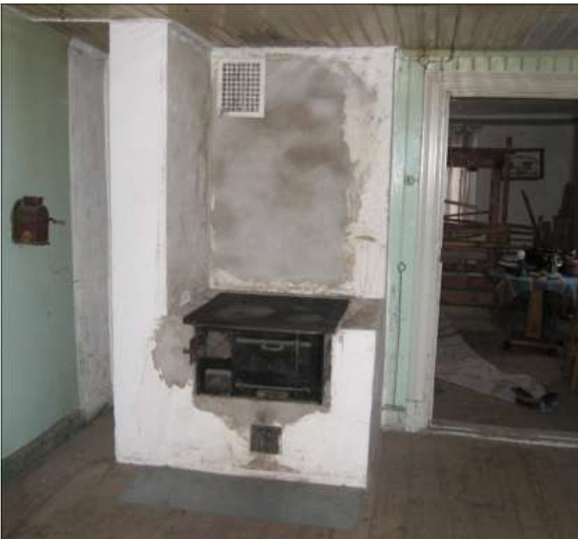
Köket efter murningsarbetena.