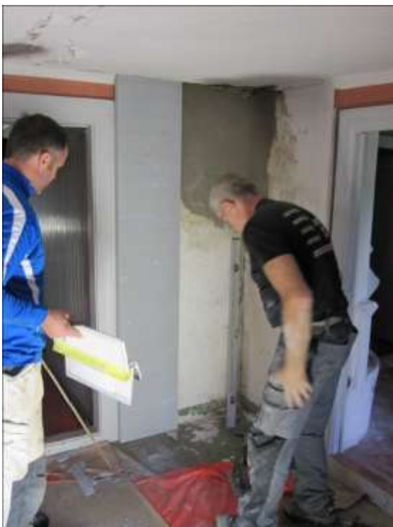
Här sätts brandskivor upp på träväggen.