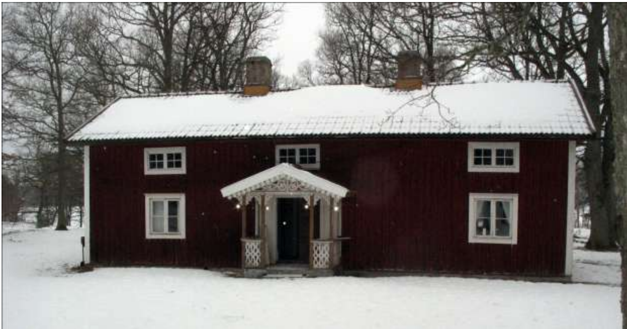
Hembygdsgården inför restaureringen.