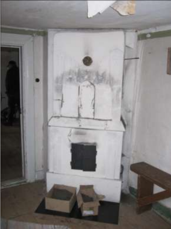
Rörspisen i det sydvästra rummet efter restaurering.