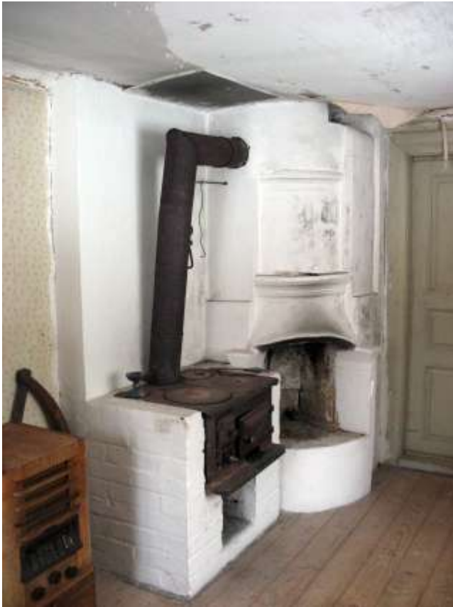
Kökets eldstadskomplex med järnspis och öppen spis.