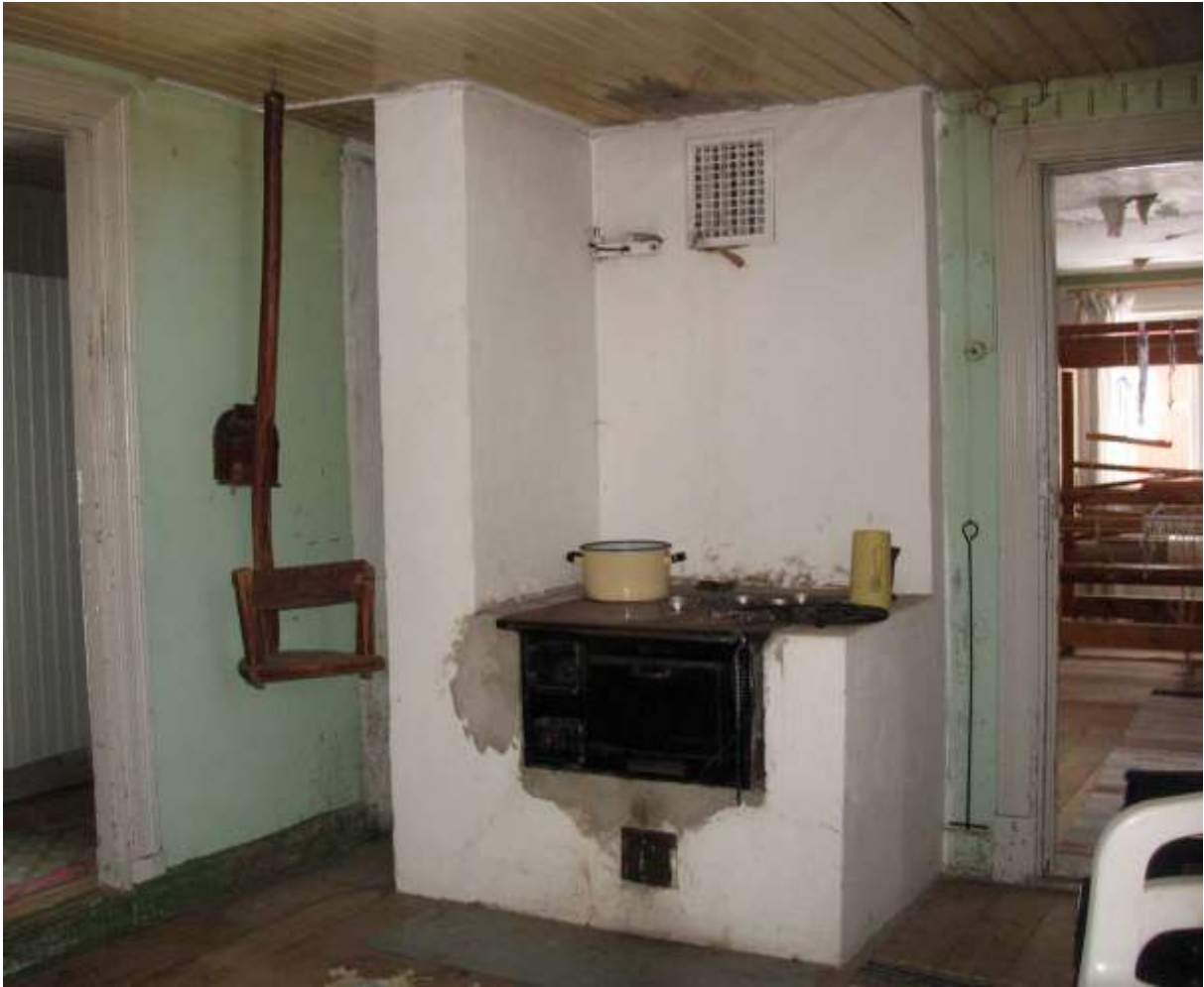
Köket med järnspisen och ventilen upptill.