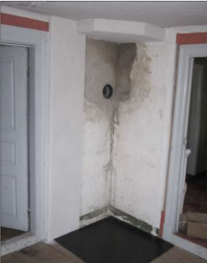
Det nordöstra rummet efter avslutade arbeten.