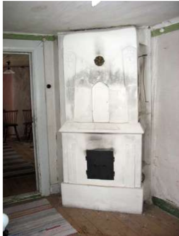
Rörspisen i det sydvästra rummet inför restaureringen.