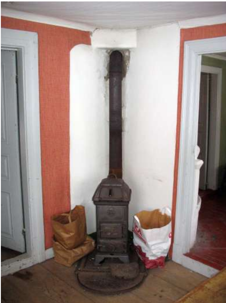
Järnkaminen i det nordöstra rummet.