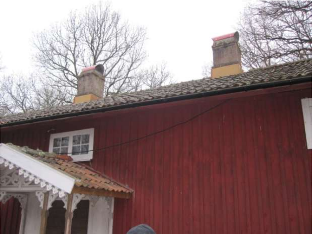
Skorstenarna med de nya huvarna.