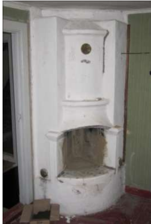
Spisen i det nordvästra rummet efter restaurering.