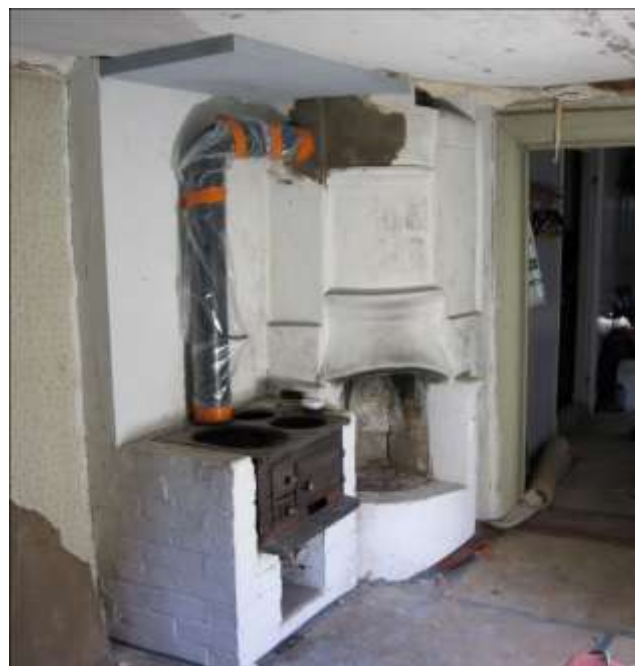
Köket med nytt rökrör och brandskivor i taket.