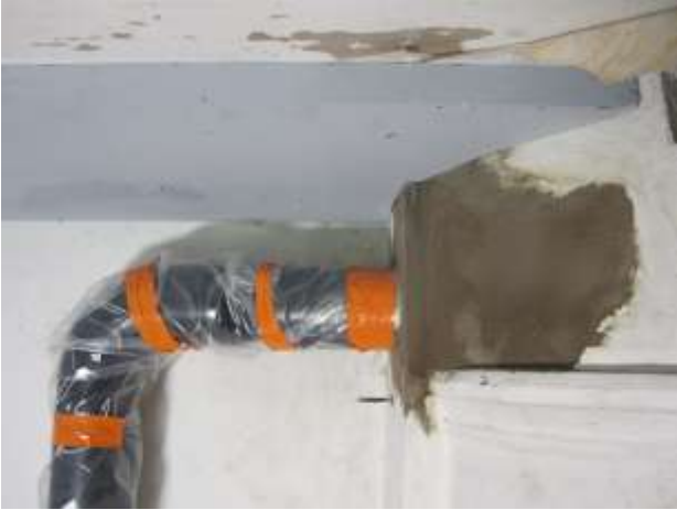
Detalj av kökets nya rökrör där det ansluter till rökgången.