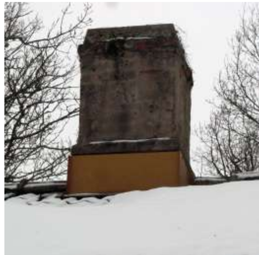
En av skorstenarna inför restaureringen.