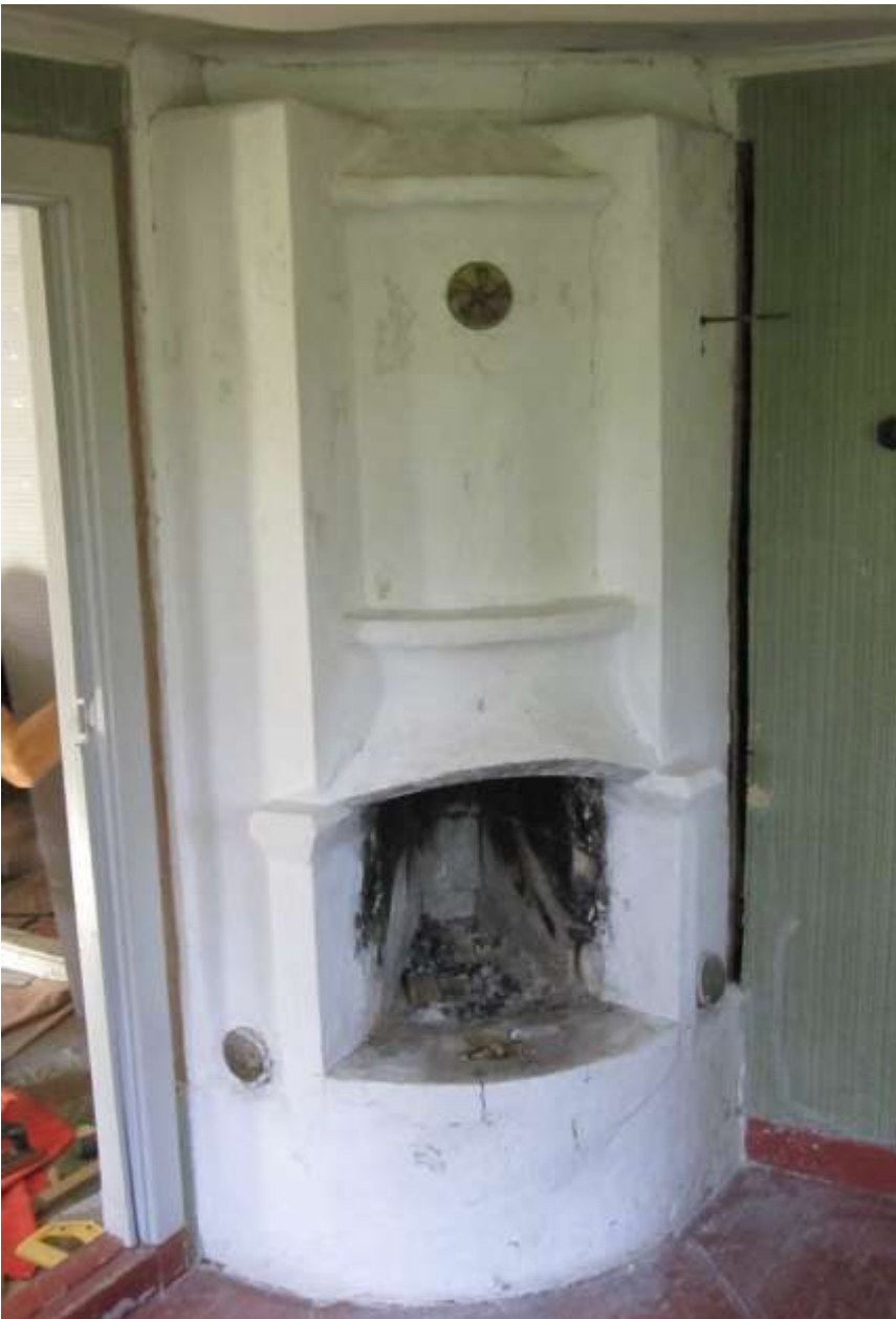
Eldstaden i det nordvästra rummet med de uppsågade slitsarna vid sidorna.