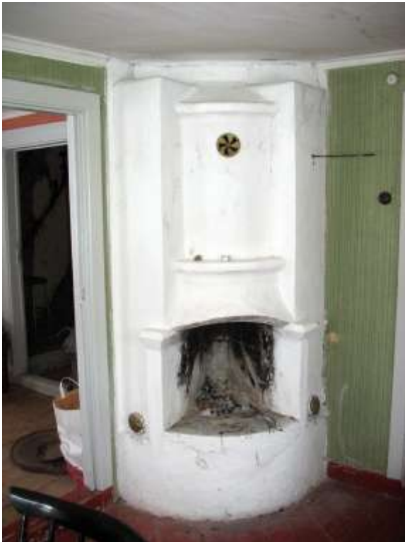
Rörspisen i det nordvästra rummet inför restaureringen.