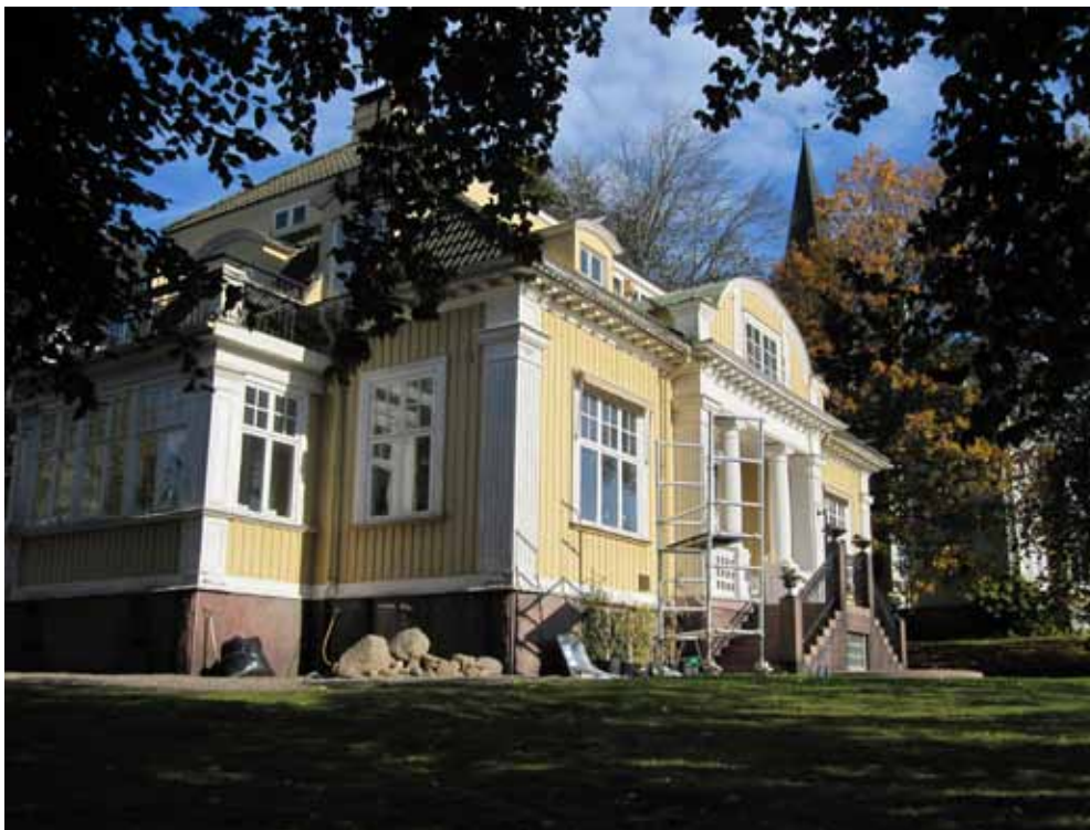
Petersonska villan på fastigheten Sänket 1 vilken ritades av arkitekten August Atterström 1908.

På uppdrag av Miljö- och byggkontoret har läns museet utfört föreliggande planunderlag. Underlaget omfattar byggnadshistorik, karaktärsbeskrivning samt bedömning och precisering av fastigheternas kulturvärden. Villans interiör har inte varit i huvudfokus för utredningen men bedöms trots allt ha kulturhistoriska värden. Byggnadsantikvarie Margareta Olsson har tagit fram handlingen.