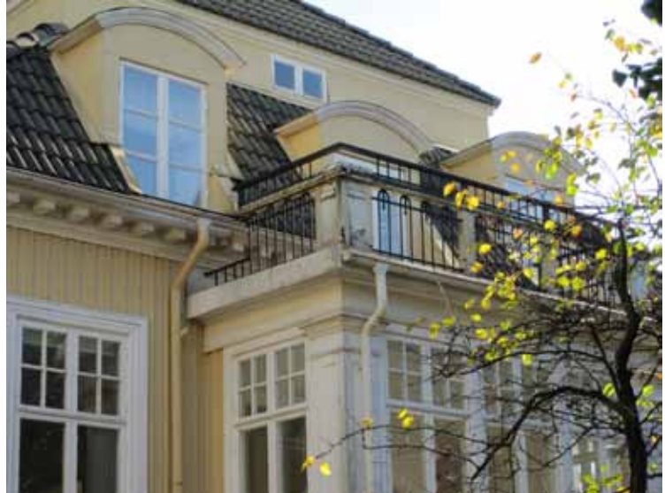
Balkongräcket åt söder med sin jugenddekor.

Villan står på en gjuten grund klädd med grovhuggen röd Tranåsgranit. Höjden tillåter erforderligt ljusinsläpp till källarvåningens funktionella utrymmen samtidigt som den ger en motvikt till den stora takvolymen. Den stora omsorg i materialbehandlingen som präglar exteriören kan även skönjas i grundens kontrasthuggna ytor vid loggians kolonnbas och hörn. Byggnadens baksida har en enklare behandling utan naturstensgrund.