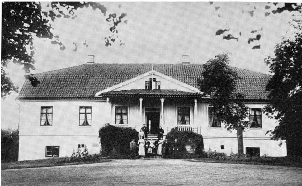
Manbyggnaden på Ingsbergs herrgård på 1890-talet.