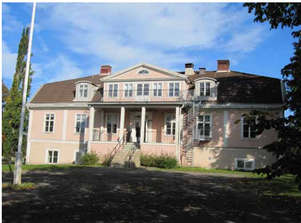
Huvudfasaden har ett något splittrat uttryck efter två omgestaltningar, dels på 1870-talet och dels 1930.