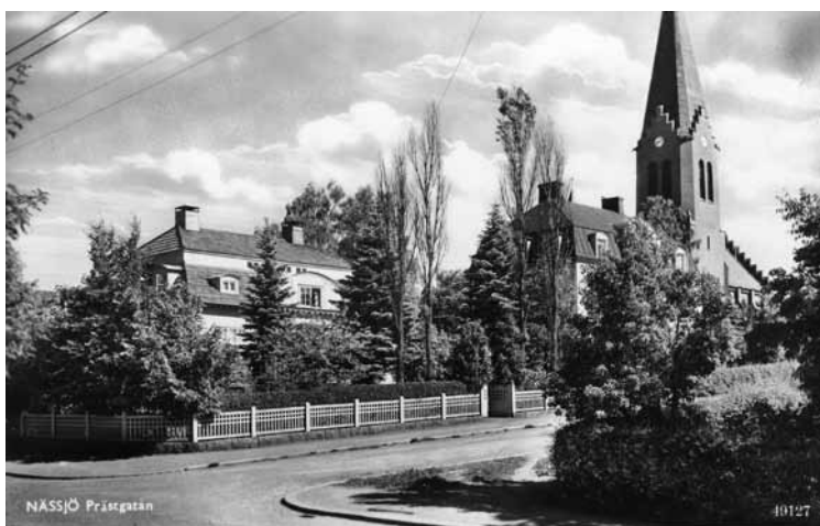
Villan med sin kraftigt uppvuxna trädgård 1947.

Villan omges av en relativt stor trädgårdstomt. För att skapa största möjliga utrymme för en trädgård, i samklang med byggnadens representativa uttryck och volym har villan placerats på tomtens bakre norra del. Trädgården verkar både ha haft formella inslag såsom grusgången i byggnadens huvudaxel samt en numera borttagen klippt häck utmed Prästgatan och naturromantisk drag med fritt placerade buskar och träd, däribland ett flertal ädelgranar. Som huvudmotiv framför entrétrappan finns en fontän i granit vars skulptur sedan länge saknas. Ett trästaket i Wienerjugend med liknande kvadratmönster som återfinns i logginas räcke kringgärdade tomten.