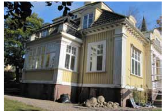
Den södra gavelutbyggnaden med balkong.

Villans planlösning, typisk för herrgårdsstilen, utgår från 1700-talets sexdelade herrgårdsplan med sällsksamrummen förlagda i fil ut mot de båda gatufasaderna i öster och söder. Planen har resulterat i en samlad rektangulär byggnadskropp. Mot gavlarna har dock mindre utbyggnader fogats vilka påminner om sk pocher vanliga hos nyantika herrgårdsbyggnader. Med ett ljust söderläge bildade den södra utbyggnaden ett inglasad vinterträdgård i direkt anslutning till salongen och vardagsrummet. Den norra som upptar en något större del av gaveln utgjorde delar av herrens sovrum. I villans privata delar med kök och sovrum i nordväst har en friare plan tillåtits. Här har ett separat utskjutande trapphus tillfogats byggnadens baksida för att lösa vardagskommunikationen mellan våningsplanen.