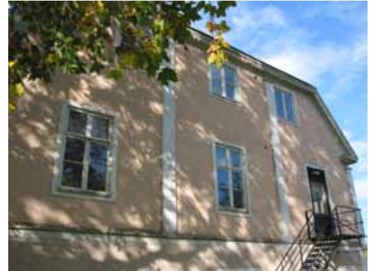
Den östra reveterade fasaden med sin nödutgångstrappa.

Ingbergs herrgård förlorade redan i början av 1900-talet hela sin historiska kontext i form av tillhörande ladugårdskomplex och försörjande odlingsmark och blev därmed relativt ointressant i ett bebyggelsehistoriskt perspektiv. Manbyggnaden som haft en mångskiftande historia och genomgått två större omgestaltningar vittnar