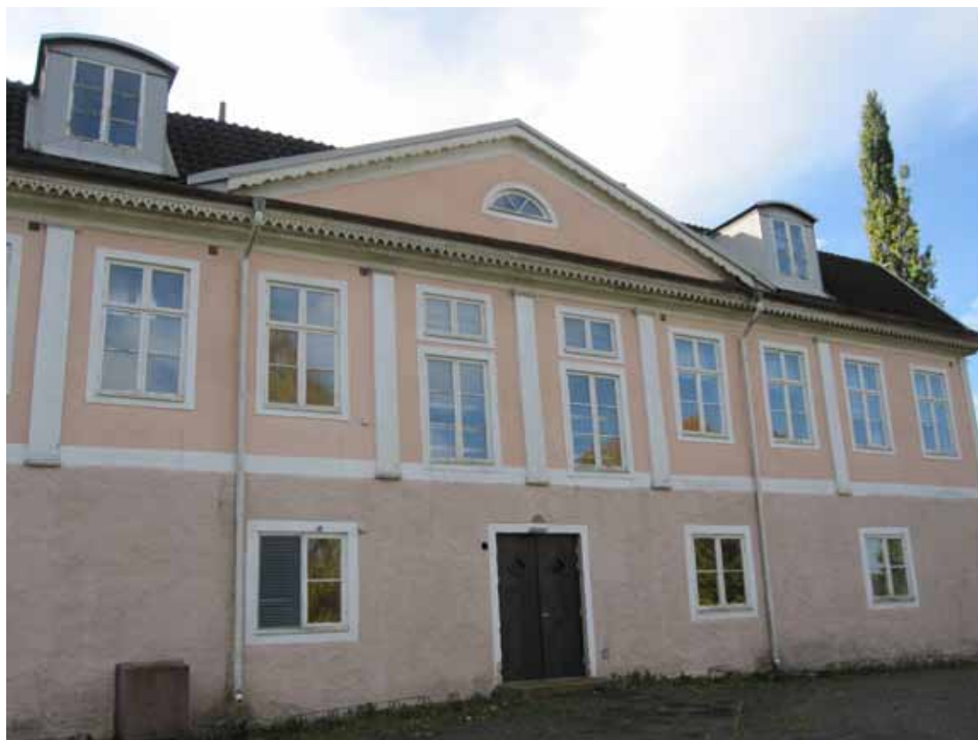
Trädgårdsfasaden har bibehållit mycket av sitt ursprungliga sengustavianska uttryck.

På 1970-talet övergick den forna herrgården i kommunal ägo och kom herefter att nyttjas som lågstadieskola. Sedan några år tillbaka har en friskola drivit skolverksamhet här. Under denna period har en rad utvändiga tillskott tillkommit, däribland nödutgångstrappor, ventilationsdon och sentida entrédörrar. 1979 gjordes en utvändig renovering då bland annat de reveterade fasaderna och sockelvåningen putsades om