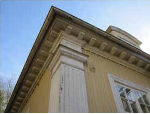
Exempel på den fina detaljbearbetningen i exteriören här i fasadpanelen.