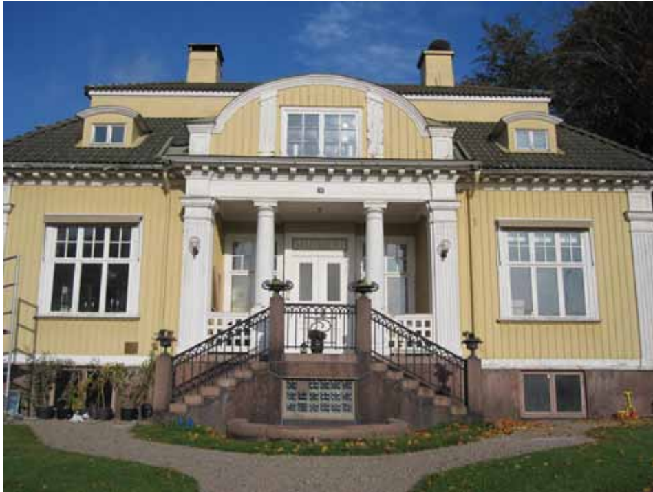
Villans storslagna huvudfasad med det betonade entrépartiet.

yrdekorerade pilastrar. Fönstren är rytmiskt placerade och rummens läge i planlösningen kan endast avläsas utifrån genom att de representativa rummen erhållit större trekopplade fönster. Fönstren är av jugendmodell med högt placerad tvärpost och spröjsad överdel samt har kopplade bågar.