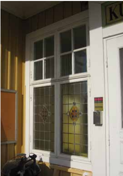
Ett av de blyinfattade fönstren som omger entrédörren.

Villan står på en gjuten grund klädd med grovhuggen röd Tranåsgranit. Höjden tillåter erforderligt ljusinsläpp till källarvåningens funktionella utrymmen samtidigt som den ger en motvikt till den stora takvolymen. Den stora omsorg i materialbehandlingen som präglar exteriören kan även skönjas i grundens kontrasthuggna ytor vid loggians kolonnbas och hörn. Byggnadens baksida har en enklare behandling utan naturstensgrund.