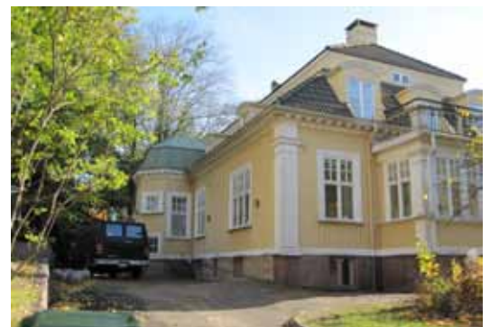
Trapphuset på byggnadens baksida.