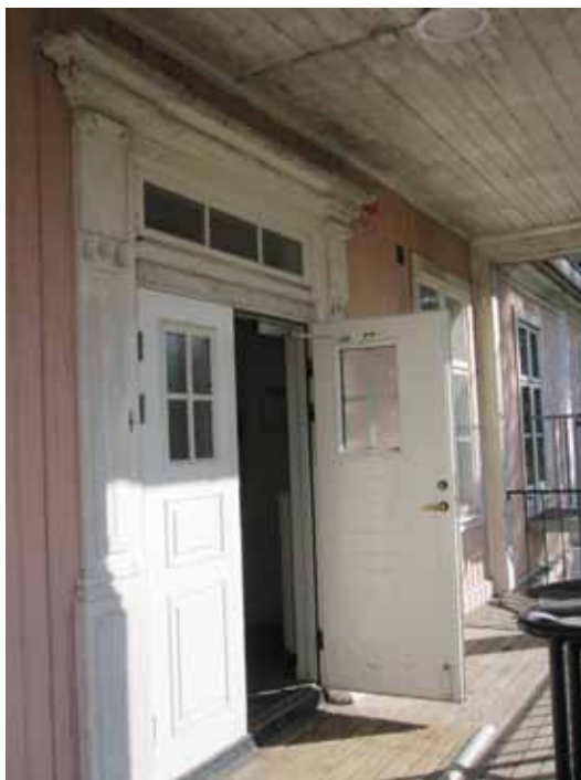
Huvudentrén har kvar sin ursprungliga portal från 1805.

Ingsbergs forna herrgårdsbyggnad har idag kvar en nyantik huvudkaraktär från byggnadstiden 1805. Samtidigt bär framför allt huvudfasaderna tydligt avläsbara drag från både 1870-talets och 1930 års omgestaltningar. Eftersom 30-talsombyggnaden skedde i en stil som blickar tillbaka på den nyantika perioden kom denna att medföra en renodling av de nyklassicistiska stildragen, om än inte helt autentiskt.