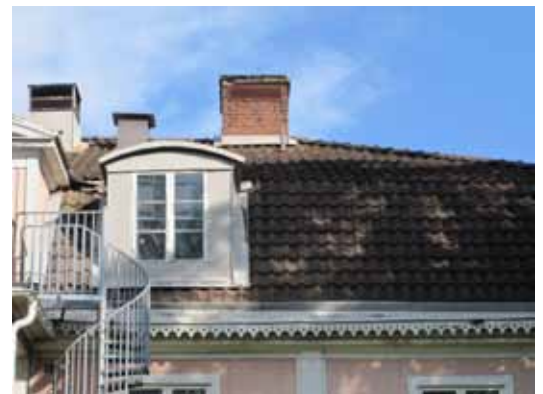
Detalj av taklandskapet med ventilationshuvor och betongtegel.