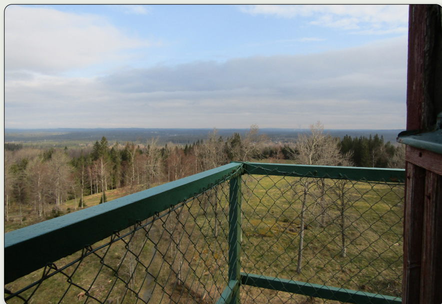
Från tornets plattform har man en utmärkt utsikt.