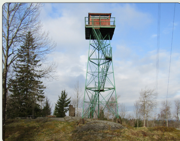
Tornet med sitt stålskelett stående på Götalands högsta punkt.

Efter kriget upphörde militären att bemanna tornen dagligen och i stället användes de endast vid övningar. Att hålla en kontinuerlig brandbevakning blev också för dyrt och därför blev vissa torn i första hand utflyktsmål, som här på Tomtabacken. Luftbevakningstornens optiska observationer ersattes fram på 1960-talet av exempelvis radarobservationer. Flygplanens betydligt högre hastighet gjorde den optiska bevakningen ineffektiv – radarsystemen hade högre precision.