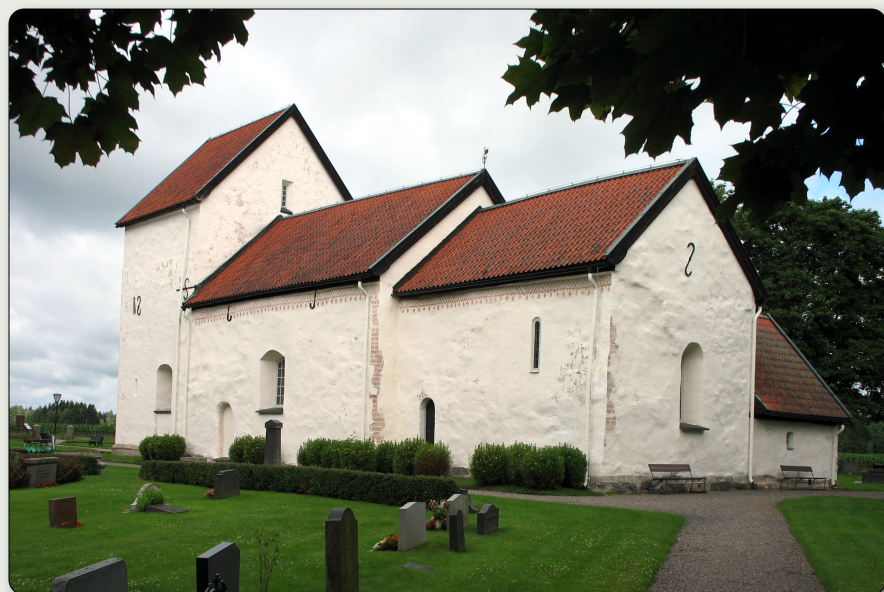
Norra Ljunga kyrka sedd från sydost. Här syns det utökade raka koret närmast i bild.