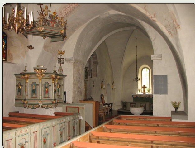
Kyrkans interiör med takets kryssvalv som skapades under senmedeltiden.

Tornets avslutning har byggts om vid flera tillfällen och 1955 ersattes det med ett enkelt sadeltak så som kyrkan ser ut i dag. Då upptäcktes även spår av den röda fasaddekormålningen som restaurerades och nu är synlig.