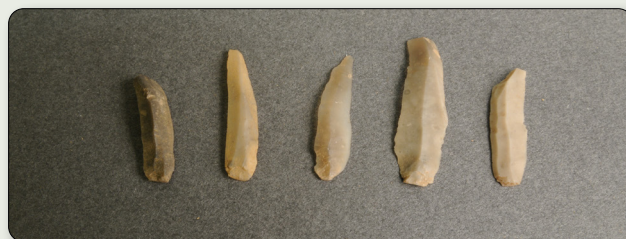
Fynd av bearbetad flinta.