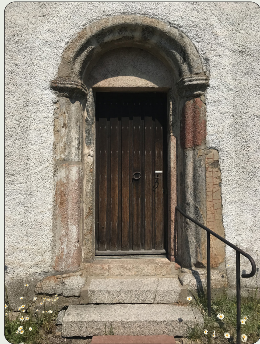
Portal från 1100-talet med inmurad runsten. Texten är skadad men berättar att den en gång, troligen på 1000-talet, rests efter "sin fader".