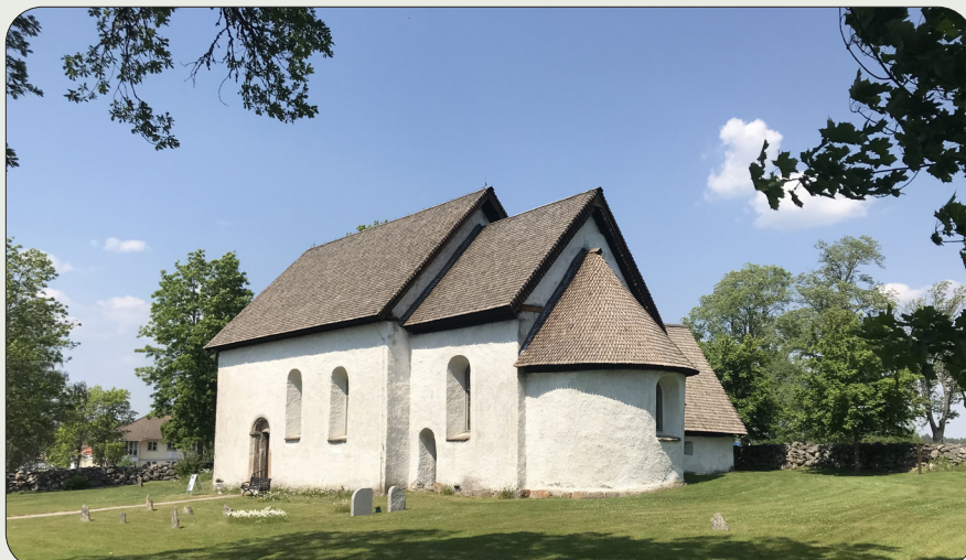
Myresjö gamla kyrka med sin för tiden typiska romanska absid.

Se även https://app.raa.se/open/fornsok/ . Sök med L-nummer ovan.