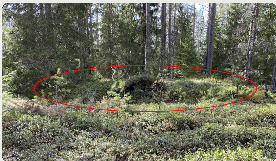
Kolbottnen framträder som en förhöjd platå som avgränsas av ett dike eller ett antal gropar runt om.