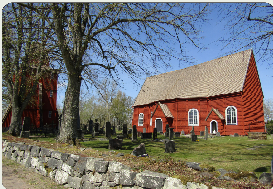
Den lilla träkyrkan, den samtida klockstapeln och den omgivande kyrkogården med flera gjutjärnsvärdar, bjuder besökaren på en fin upplevelse. Till kyrkomiljön hör även en prästgård, en sockenstuga och en f.d. skola.