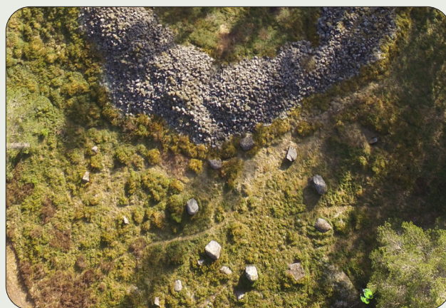
Domarringen norr om ringröset är 12 meter i diameter. På gravfältet finns ytterligare fem domarringar och säkerligen fler gravar som inte är synliga ovan mark.

Gravfält med domarringar kan dateras till mellersta järnålder, cirka vår tideräknings början till 500-talet. Förmodligen har järnåldersbönderna i Röshult önskat knyta an till det betydligt äldre ringröset.