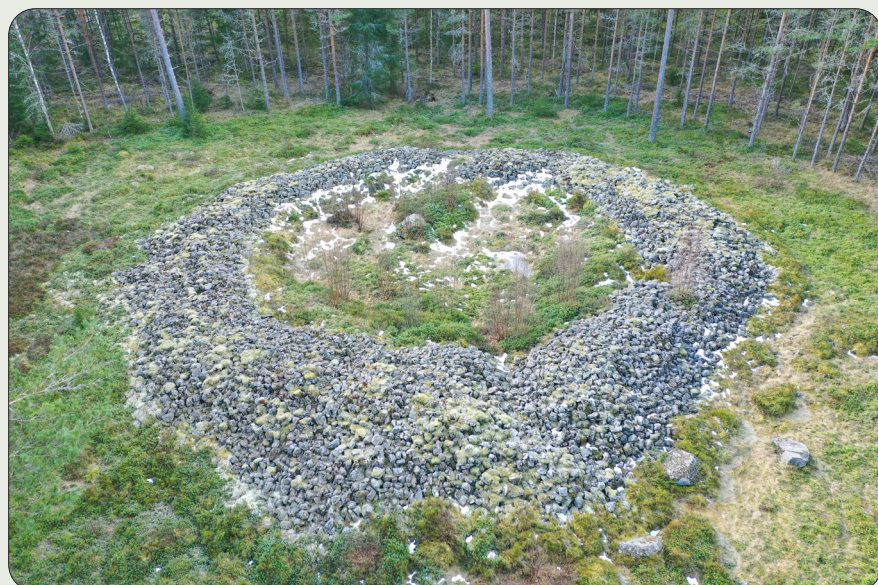
Det imponerande ringröset i Röshult. Varifrån byns namn kommer ifrån kanske inte är svårt att lista ut. Med sina 35 meter i diameter och avsaknaden av sten i mitten har röset fascinerat människor i flera tusen år.