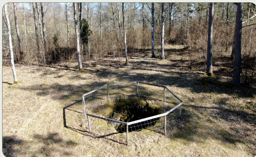
Varggropen i Evedal, Korsberga socken.