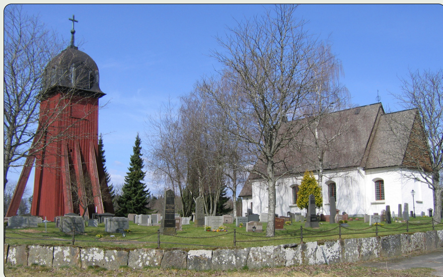
Hagshults kyrka och klockstapel från sydost. Den 30 september 2020 förstördes klockstapeln genom brand. Den hade enligt kyrkans räkenskaper uppförts 1684.

N 6355499/E 451274 (SWEREF 99 TM) // N 57° 20' 23,20", E 14° 11' 25,18" (WGS84)