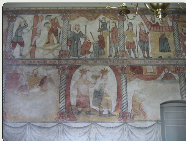
Kalkmålningar från 1600-talet på långhusets norra vägg föreställande scener ur Jesu liv och död.