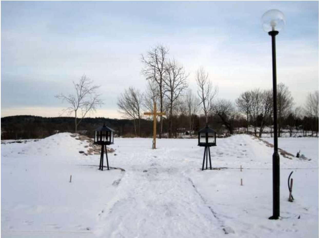
Bild av anläggningen vid slutbesiktningen.