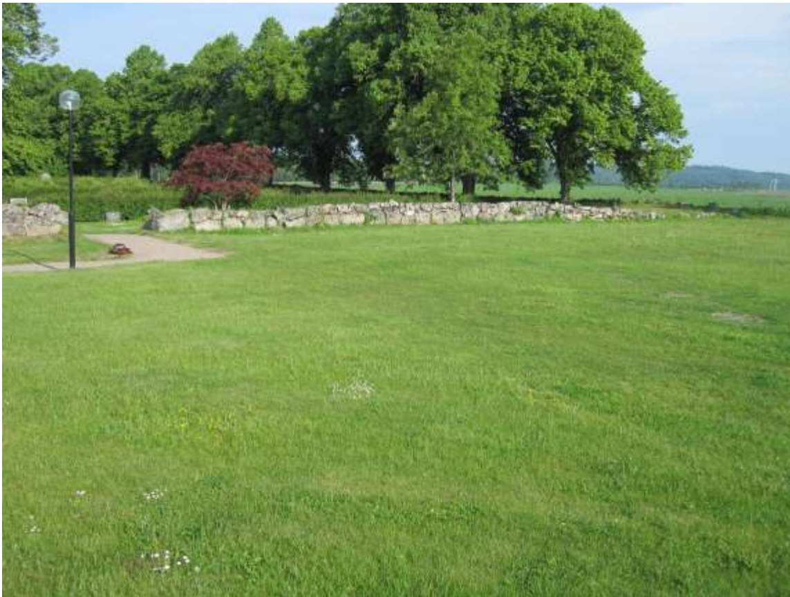
Översikt från sydost över arbetsområdet inför åtgärderna.