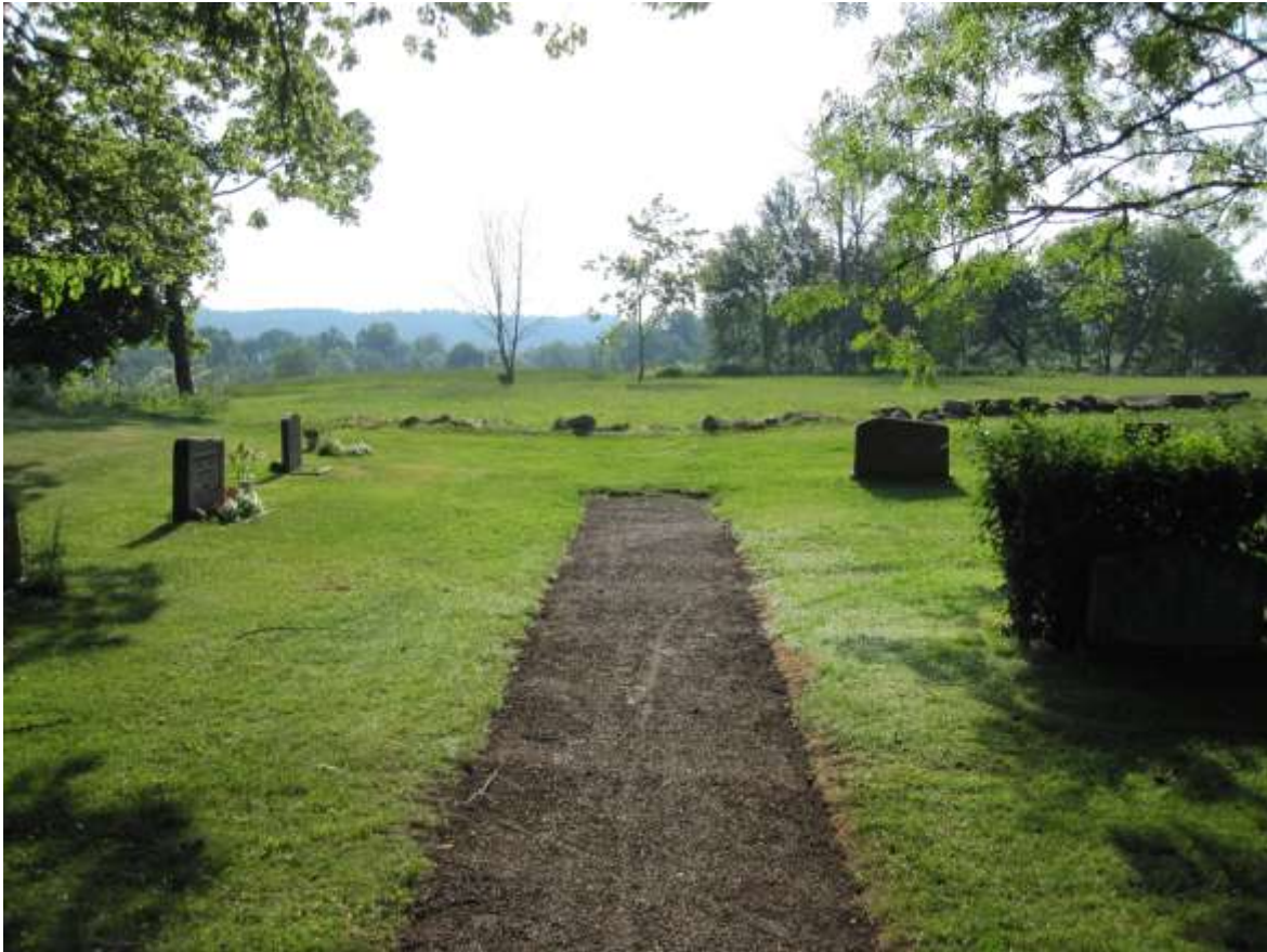
Gången längst i norr som skall förlängas in mot den nya askgravlunden.