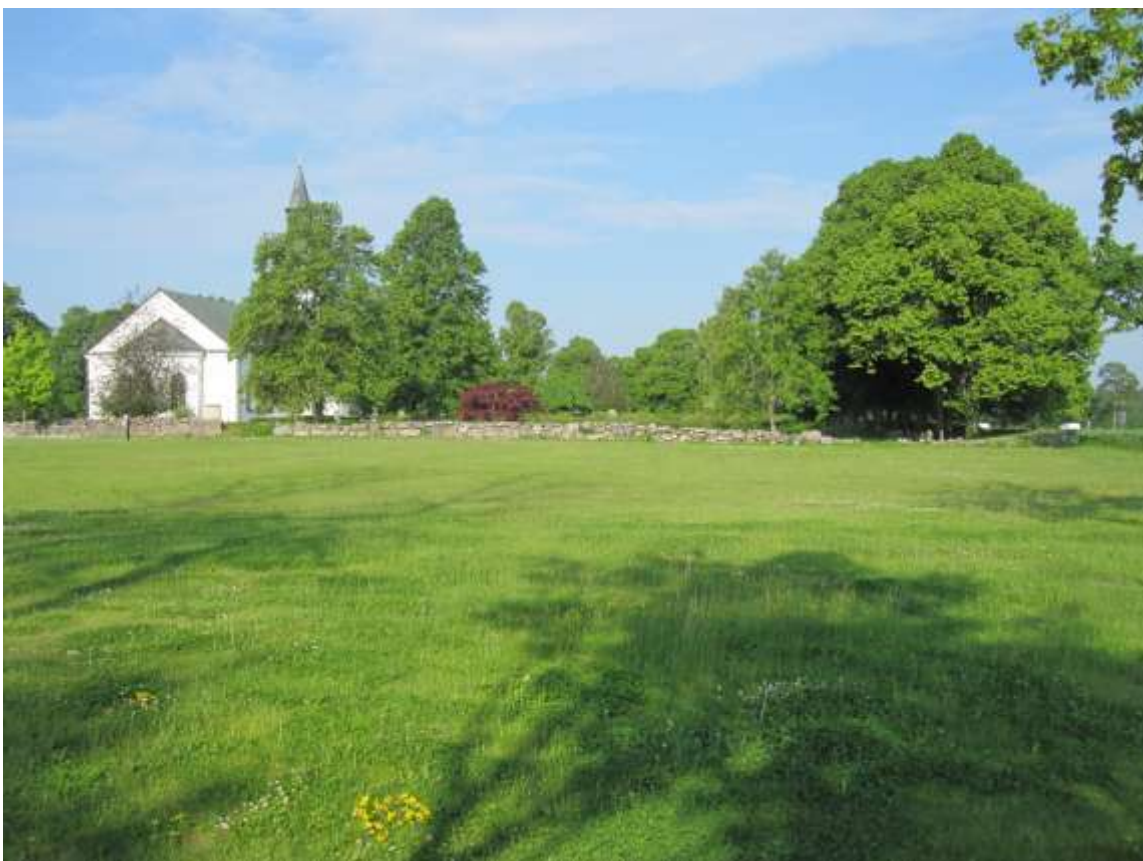
Översikt från öster över arbetsområdet inför åtgärderna.