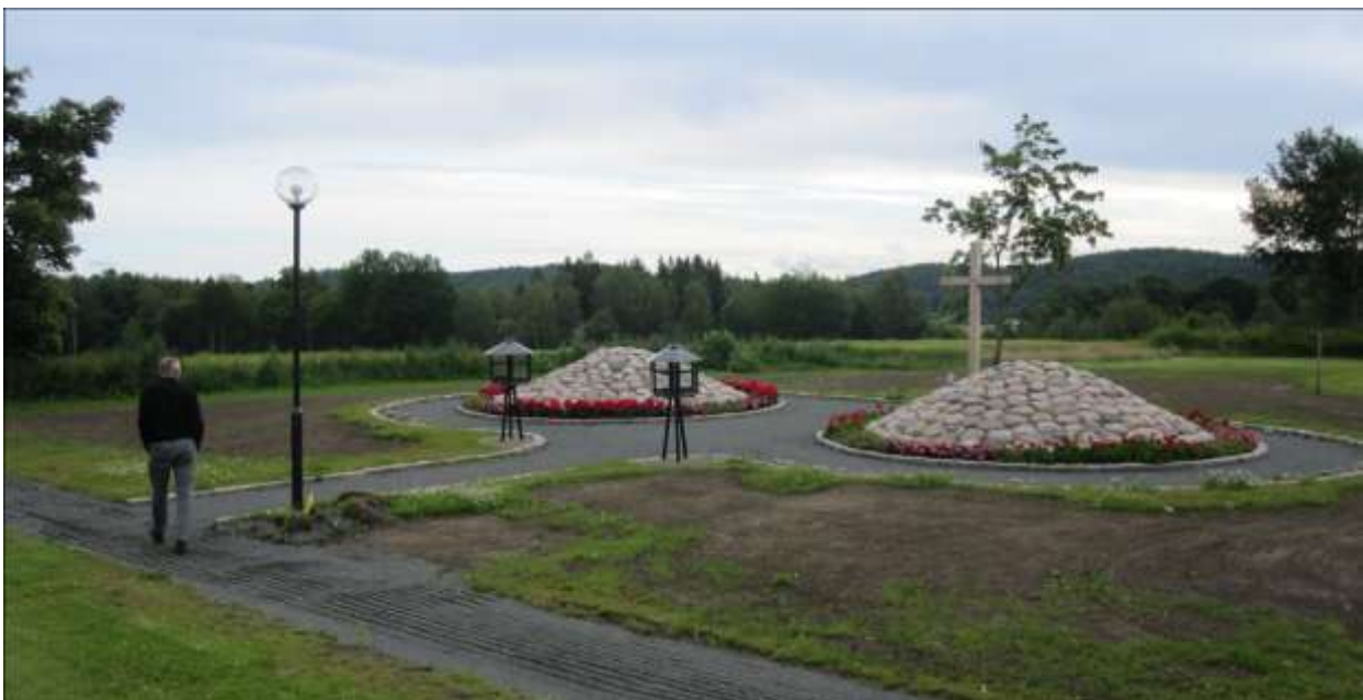
Den nya askgravlunden när växtligheten kommit igång sommaren 2012.