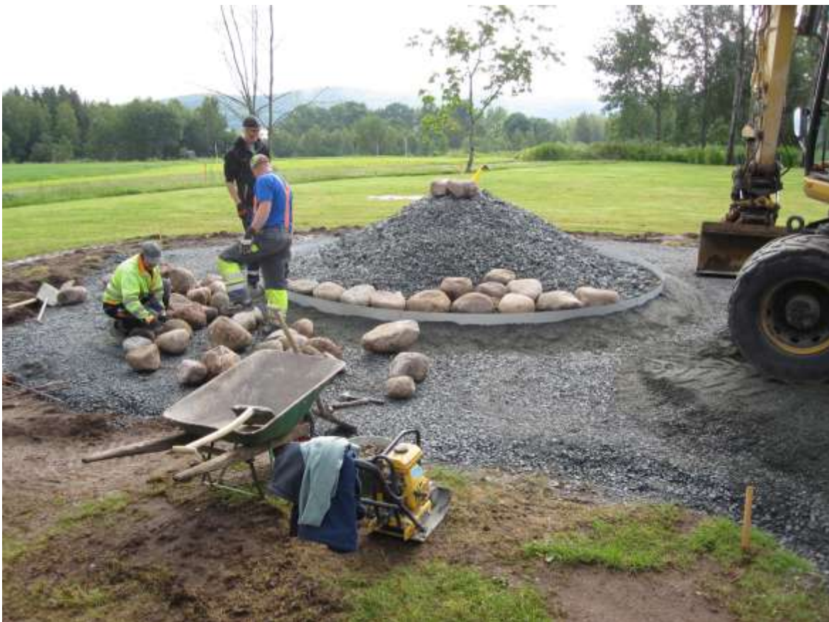
En av gravkullarna under uppförande. En plåtram begränsar anläggningen. På krönet syns en förberedd elanslutning, som inte är avsedd att utnyttjas i nuläget.