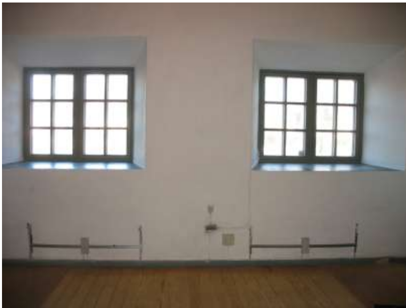
Sakristivägg efter putsning och avfärgning.