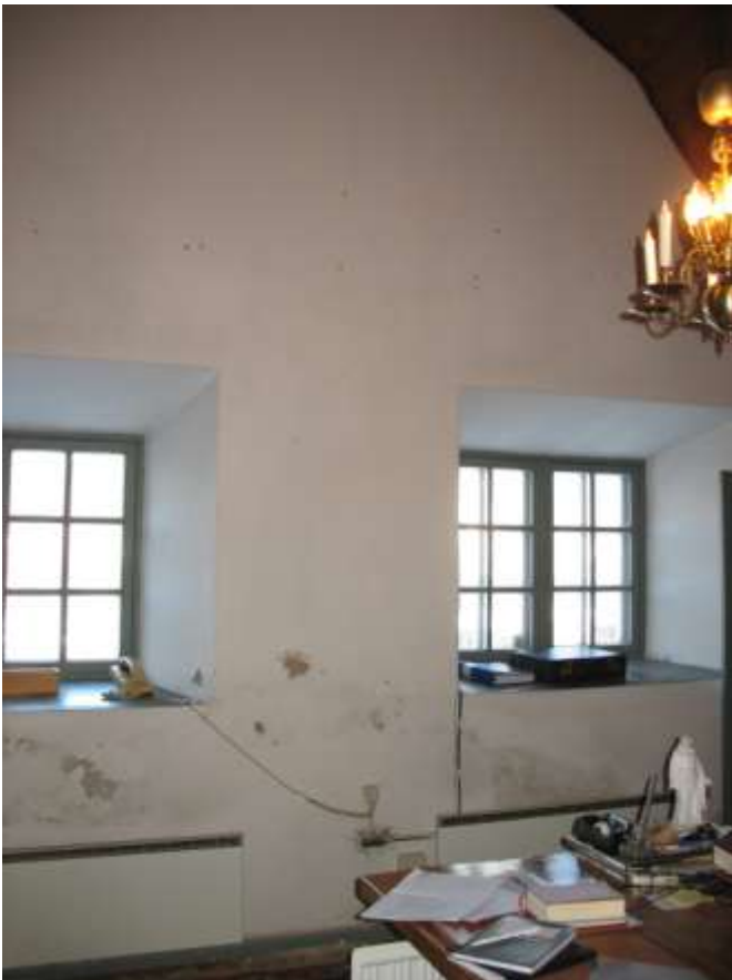
Sakristians nordvägg före arbetena.