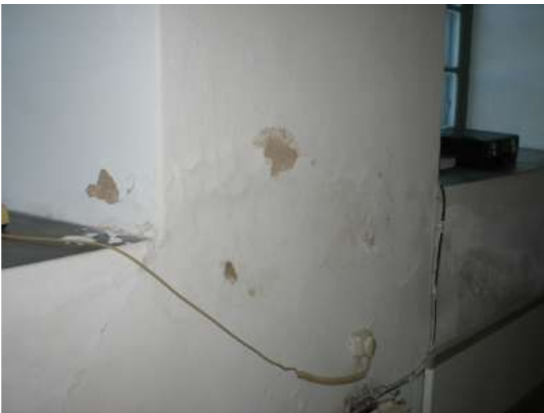
Detalj av vägg.