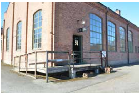
Bruksmuseets entré med den befintliga trärampen.

Taket på den f.d. kärnmakeribyggnaden, där bruksmuseet numera är inrymt, lades om 1995–96. Tidigare läckage hade orsakat skador på putsen på väggarnas insida. I samband med att museets