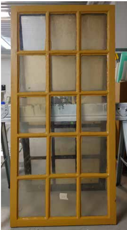
Fönstren åtgärdades på verkstad.