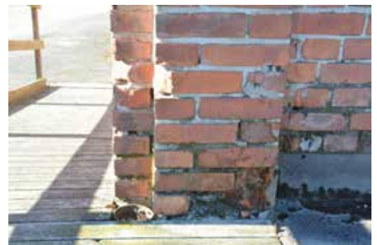
Intill museets entré förekommer flera skador på tegelfasaden vilka bör åtgärdas.