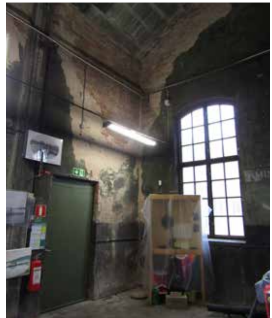
Museets väggar efter utförd rengöring. Väggarna dammsögs varsamt med ett munstycke med mjuk borst.