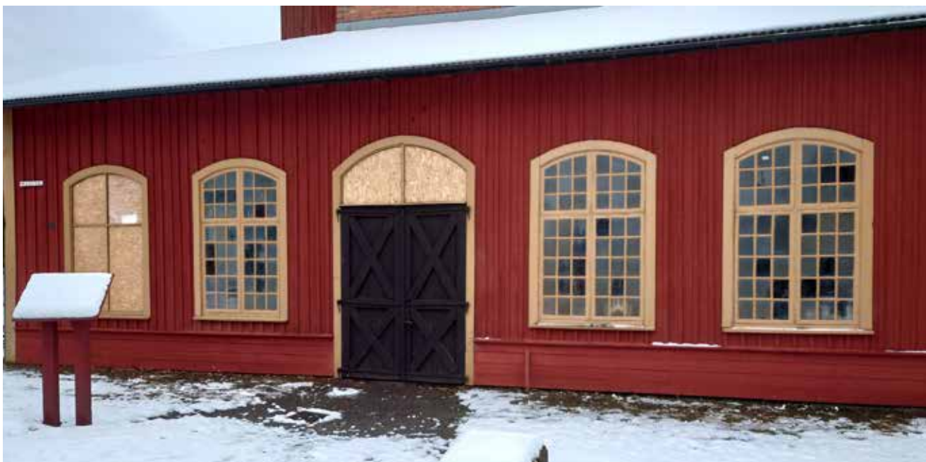
Efter åtgärd. På fotot har de flesta av de renoverade fönsterbågarna återmonterats.

Bidragsbeslutet omfattade även installation av kulturhistoriskt anpassat brandlarm i bruksanläggningens kontorsdel, men denna åtgärd utgick.