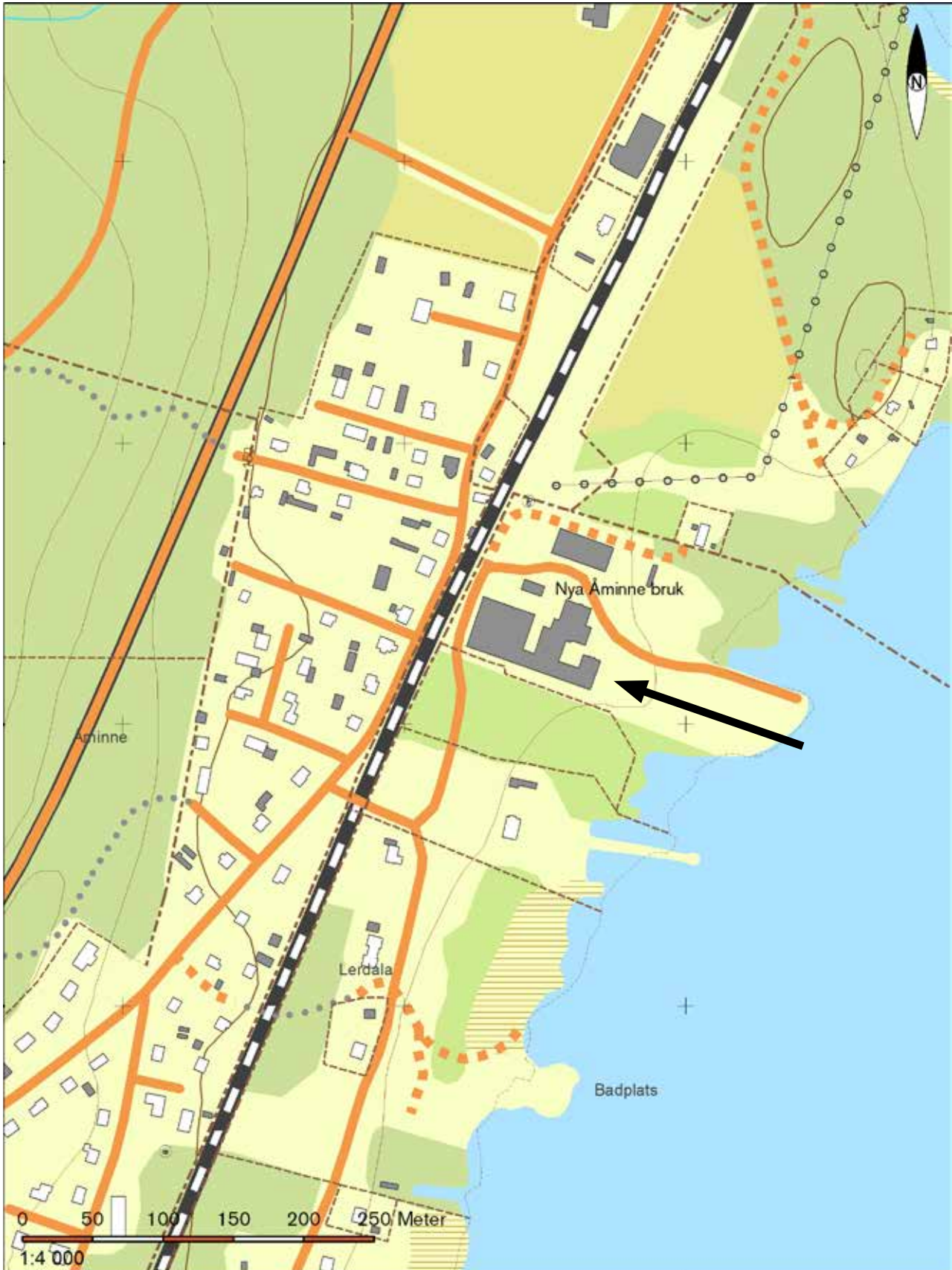
Utdrag ur digitala fastighetskartan.