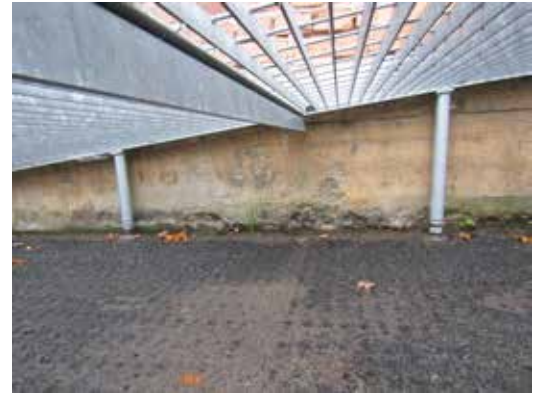
Rampen följer fasadens form, men är helt fristående och saknar helt infästning mot byggnadens sockel.