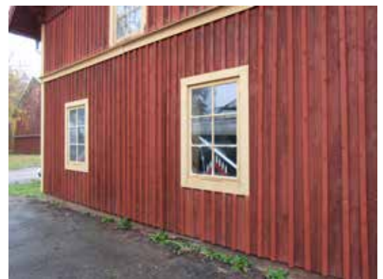
Magasinets västra gavel där det borte fönstret åtgärdats.