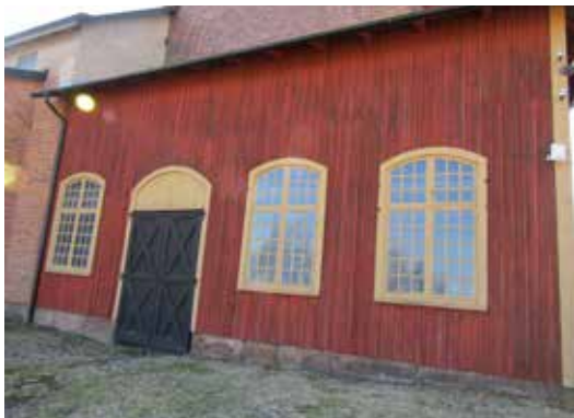
Ovan: Masugnens östra fasad före åtgärd.

Till höger: De två övre fönstren och ytterligare ett fönster på gjuterihallen kvarstod att måla från en tidigare etapp.