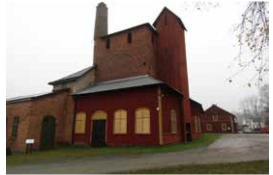
Under pågående arbete. I samband med fönsteråtgärderna, rödfärgades även den västra och den östra fasaden på masugnen.

Vid slutbesiktningen diskuterades flera kommande åtgärder, såsom installation av larm på kontoret, renovering av masugnens gjutjärnsfönster, byte av rötskadad stock på kolladan och målning av kolladans fasader.