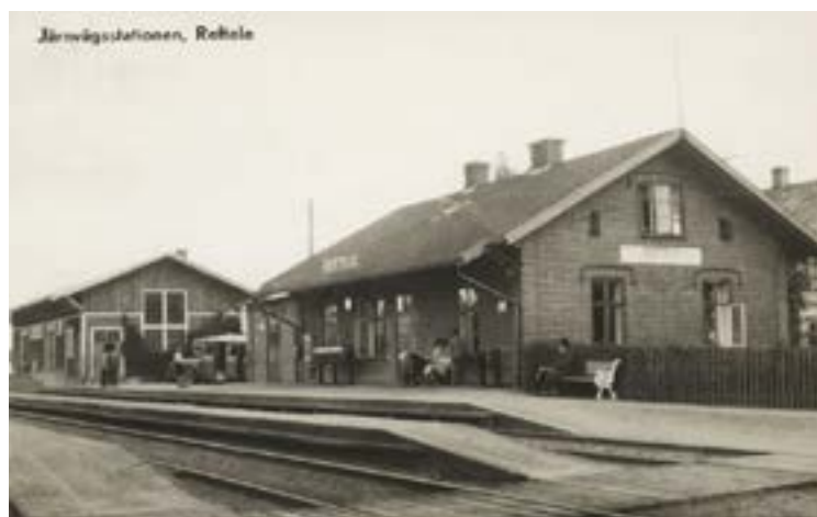
Ett vykort över stationen i Reftele med stationsbyggnaden i förgrunden och godsmagasinet i bakgrunden. Bilden som anges vara tagen cirka 1927 är hämtad från Järnvägmuseets bildportal, Jvm.KCAC17740.

År 1945 förstatligades HJN Halmstad – Nässjö järnvägar. SJ fortsatte till en början trafiken i ungefär samma utsträckning. Persontrafiken på sidobanan Reftele – Gislaved lades ned i början på 1960-talet. På huvudbanan är persontrafiken fortsatt i drift. Den 30 september 1991 upphörde godstrafiken på sträckan Reftele – Anderstorp. Gislaveds kommun köpte godsmagasinet av Jernhusen Fastigheter AB i december 2006.