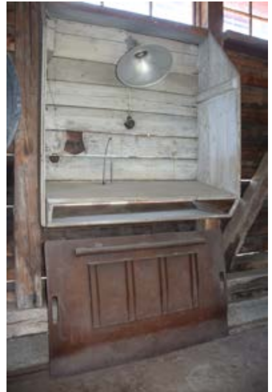
Den väggfasta skrivpulpeten vid golvvågen. Notera att pennan sitter kvar i sin spiral.

Vid västväggen mot expeditionen och mot den norra väggen finns flera platsbyggda skåp med enkla brädhyllor. I väster över expeditionssdelen finns ett loft som nås via en brant trappa. Vid sidan om trappan löper murstocken till kaminen i expeditionen. Lokalen får dagsljus via de på långsidorna högt sittande smala fönstren och större småspröjsade fönster på gavlarna. Fönstret åt väster är dolt bakom en skiva.