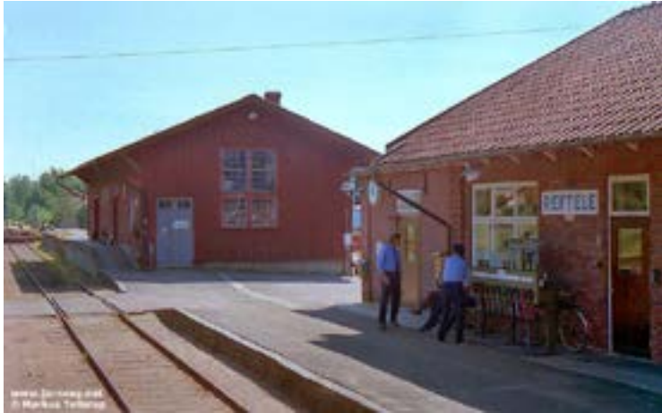
Reftele station 1989, medan den fortfarande var bemannad.