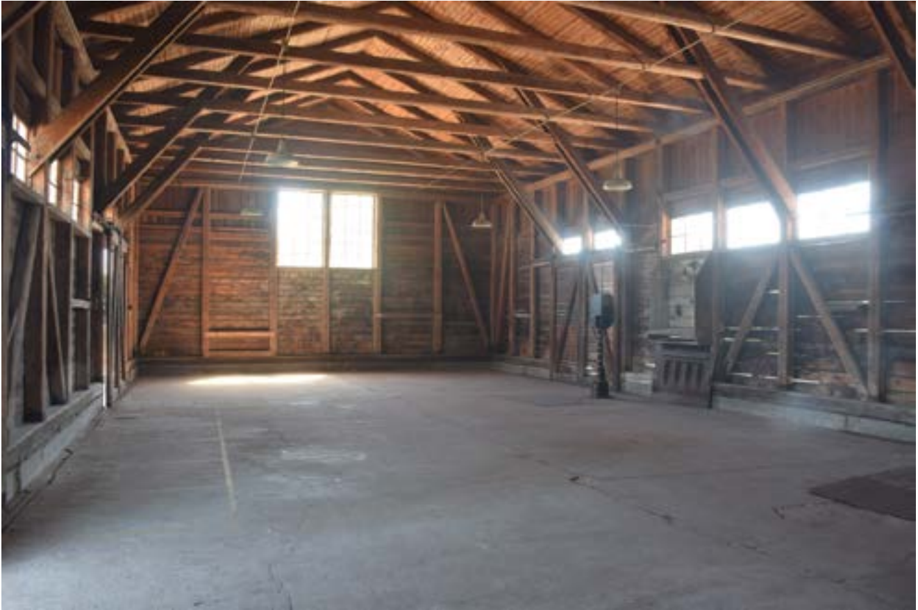
Till vänster i bild, på golvet mellan portarna kan man ana de gulmålade fackmarkeringarna.