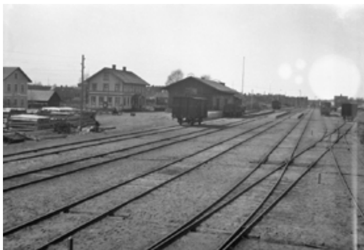
Godsmagasinet med spårområdet i förgrunden. Bilden visar det omfattande spårområdet och anges vara tagen omkring 1930. Den är hämtad från Järnvägmuseets bildportal, Jvm.KBEO1150. Foto: A. Härenstam.

Vad gäller andra referenser till eventuella bevarade magasin längs linjen eller möjlig arkitekt har inte funnits utrymme att utreda då uppdragets begränsade tid har inte medgivit någon tid för djupare arkivsökningar.