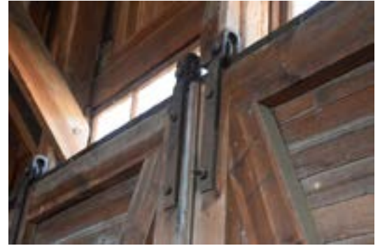
Skjutportarna glider på skenor.