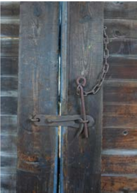
Portarna reglas från insidan med enkla smidesbeslag.

Magasinsdelen är cirka 17,5 x 8 meter. Väggarna är oisolerade och träpanelen är omålad invändigt. Den synliga takbotten består av smal pärlspontpanel. De triangelformade takstolarna vilar på hammarbandet. I princip vid varannan stolpe finns en förstävning i form av plank på vardera sidan av stolpen/takstolen.