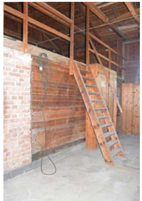
Trappan upp till loftet. Bakom trappan och vid sidan om dörren in till kontoret skymtar de platsbyggda skåpen. Muren i förgrunden utgjorde den enda värmekällan i rummet.