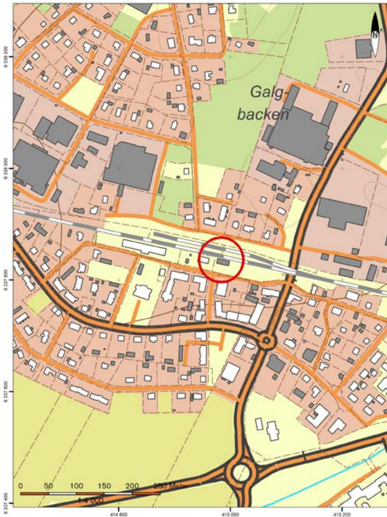
Utdrag ur digitala fastighetskartan.