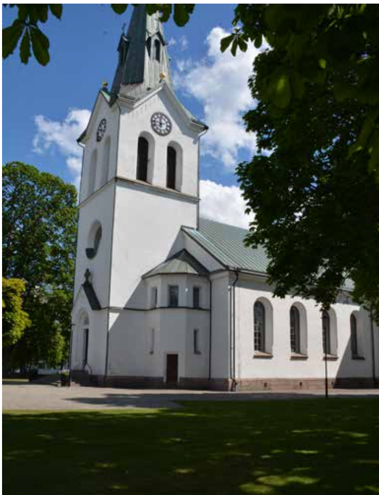
Värnamo kyrka från sydväst före åtgärd, foto juni 2020.