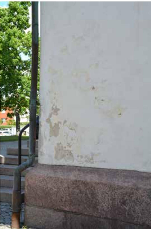
Skador på tornets södra sida i anslutning till sockeln och den västra knuten.

Fasaderna uppvisade partiella skador i form av färgbortfall och viss spjälkning i utsatta lägen. Skadorna var i huvudsak koncentrerade till tornet och korsarmens sydfasad. I anslutning till tornets mittelbandlist under luckorna fanns visst putsbortfall.