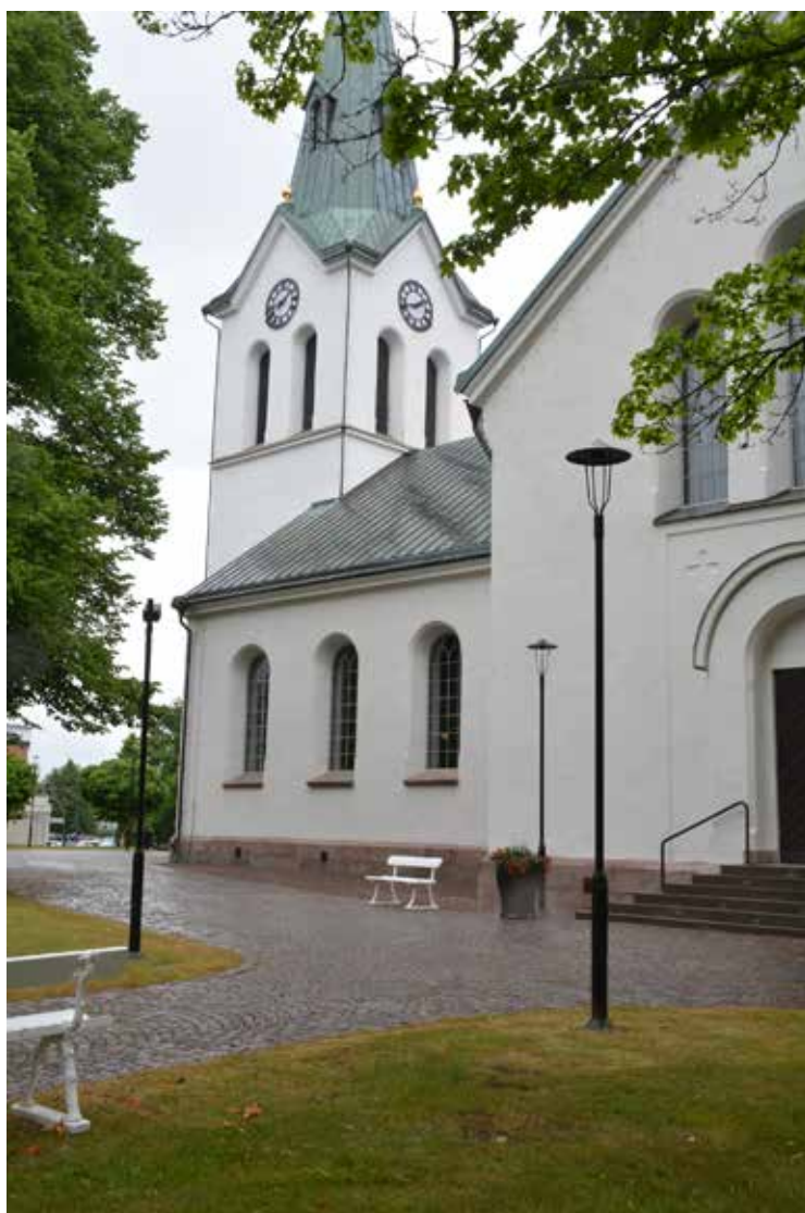
Tornet och kyrkans sydvästra fasad, foto från juni 2021.