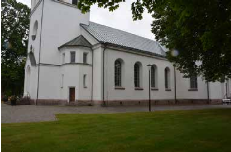
Översikt, kyrkan och tornet från sydväst, foto från juni 2021.