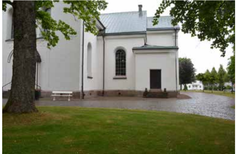
Östra delen av långhuset och koret från söder. Foto från juni 2021.