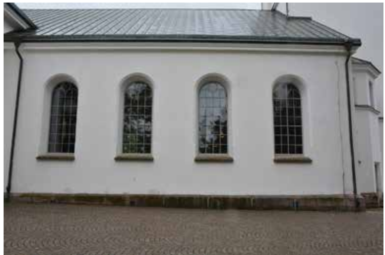
De målade fönstren, norra fasaden.