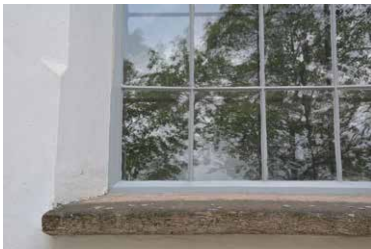
Ett av de färdigmålade fönstren.