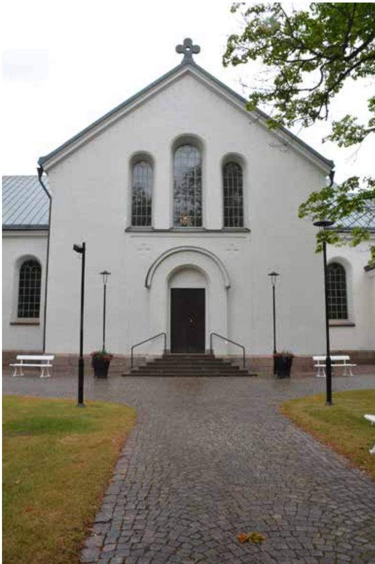
Den södra korsarmen från söder, foto från juni 2021.