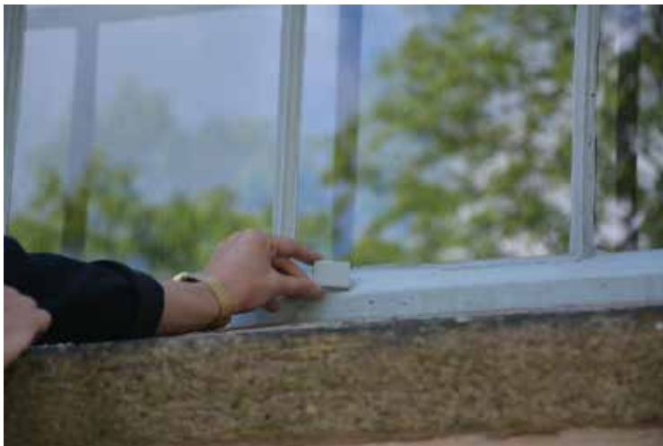
Kulören på fönsterbågarna fastställdes med hjälp av Linoljefärgslikaren.

Arbetena omfattade fönsterrenovering och målning av samtliga fönster. Fönstren skrapades och målades i samma grå kulör som tidigare. Kulören fastställdes till 3A 786 + 98 enligt linoljefärgslikaren, det är en blandning av 786 grön umbra och 98 bensvart som ersätter tidigare 36 grå umbra. Entreprenören nyttjade Engwall & Claessons linoljefärg, kulör 3502-G enligt företagets beteckning. Bågarna var i gott skick så det behövde inte göras några reparationer.