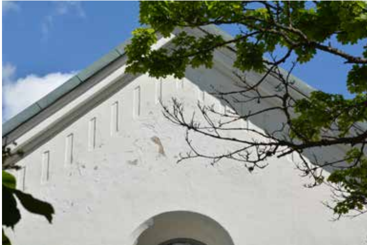
Korsarmens sydfasad uppvisade skador i form av flagade färgskikt och smärre putsskador.

Färgen på fönstren flagade och då framför allt på den södra fasaden, i solskyddade områden i norr var den i bättre skick.