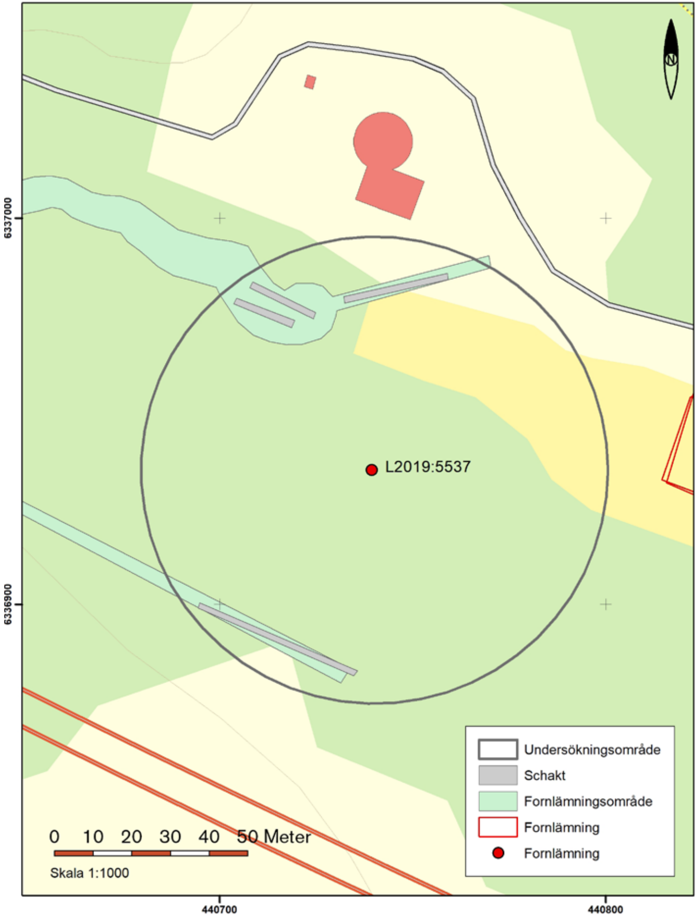
Figur 2. Schaktplan. Skala 1:1000.