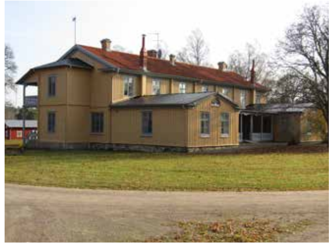
Byggnad 146 efter ommålningen.