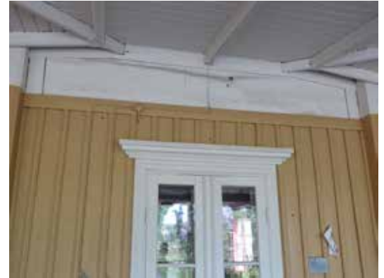
Ovan: Partiet över dörren med bubblig masonite. Nedan: Bakom masoniten fanns timret som var gråmålat.