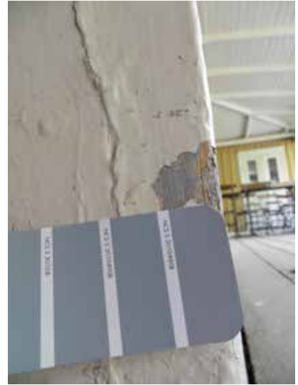
Samma skrapprov, verandan ungefär NCS S 3010-R80B.