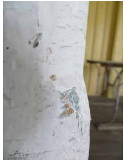
Skrapprov, verandan: ljusare grå på stolpe, men något mörkare i fasning.