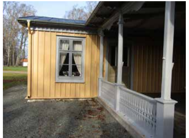
Byggnad 146 efter ommålningen, verandans utsida och en flygelutbyggnad.