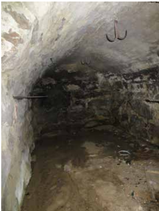
Det lilla källarutrymmet under byggnadens östra del. Här gjordes inga åtgärder.