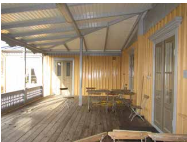
Byggnad 146 och dess veranda mot väster efter ommålningen. Den bärande konstruktionen är grå, medan takets undersida är vitaktig.