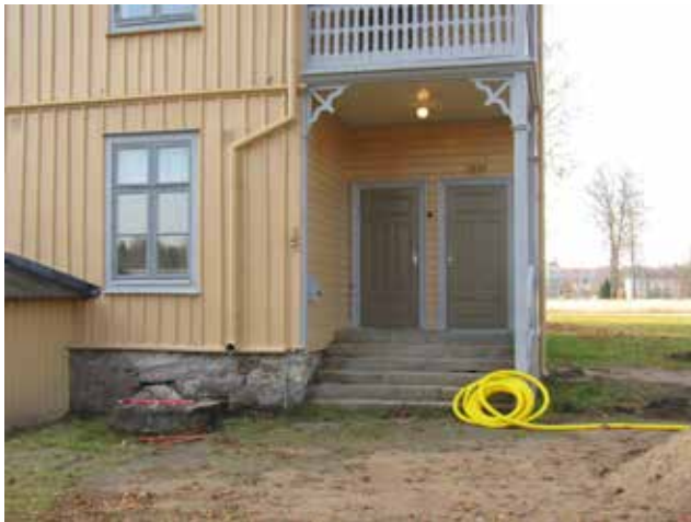
Byggnad 146 efter ommålningen, trapphuset och entrén mot nordost.