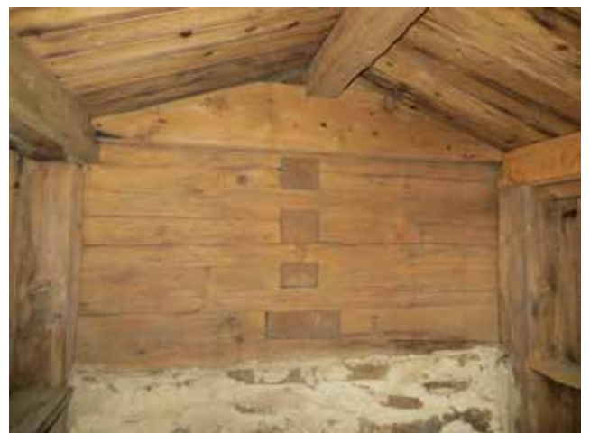
Den lilla källaren under byggnad 146 har en nedgång där timmerstommen är synlig och där finns inga spår av målning.