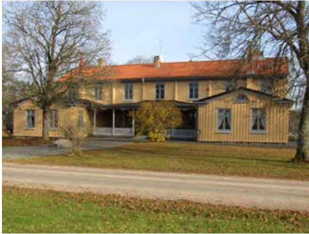
Byggnad 146 efter ommålningen.