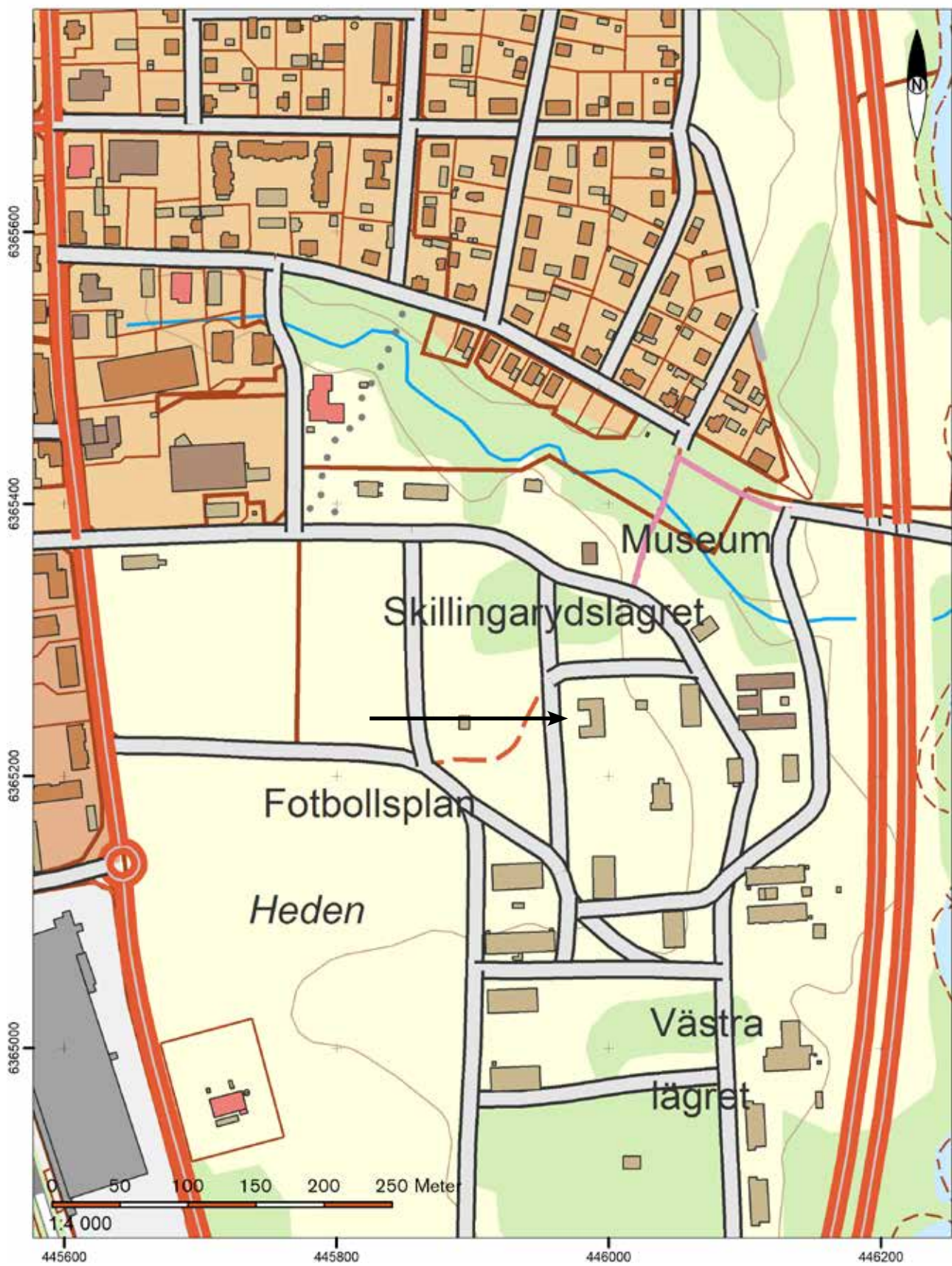
Utdrag ur digitala fastighetskartan.