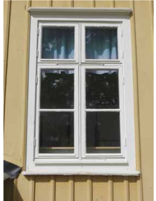
Ett fönster inför ommålningen.