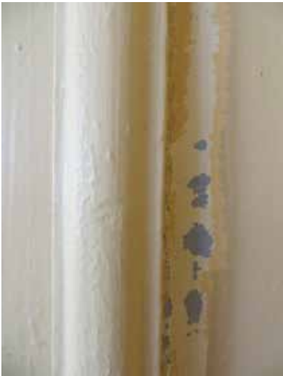
Skrapprov vid locklist: ljusgrå med blått inslag.