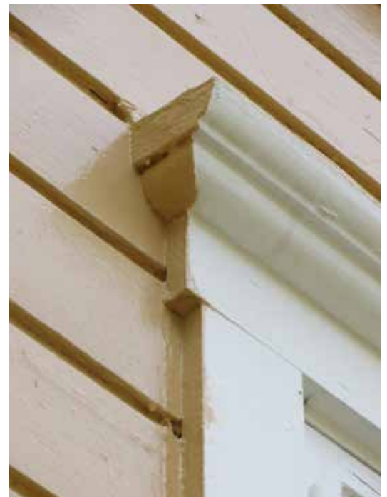
Fönsterfodren hade kanter som var målade i färdigfärgen inför ommålningen. Detta är ett enklare sätt att måla, men nu målades även dessa kanter i foderkulören.