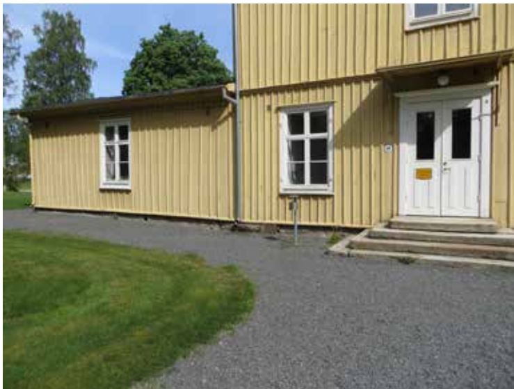
En del av den södra fasaden inför arbetena.