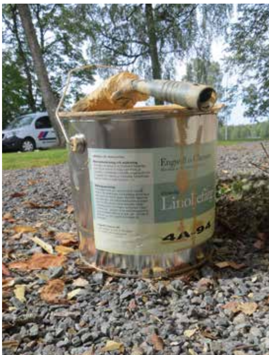
En färgburk från ommålningen av fasadpanelen.