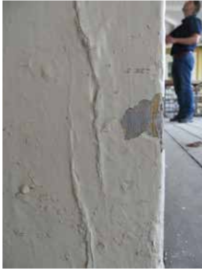
Skrapprov, verandan: ljusgrå.