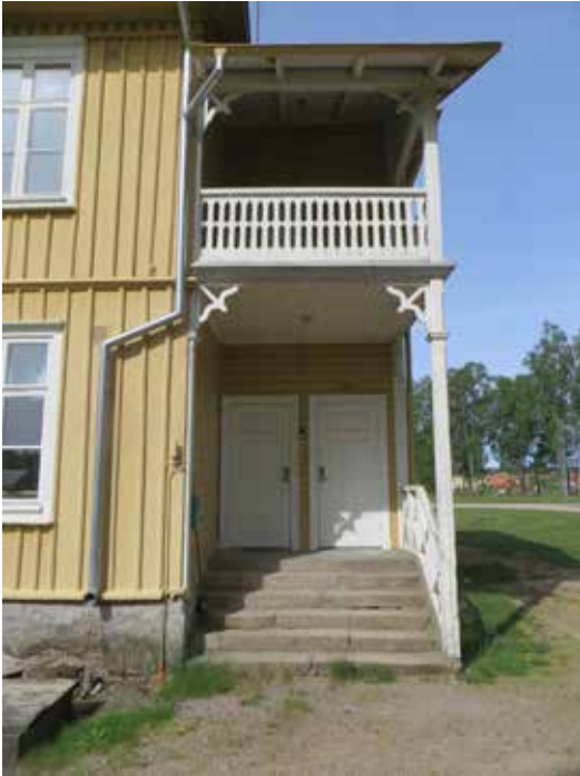
Ovan: Entrén och balkongen mot nordost inför ommålningen.

Ovan till höger: Den östra fasaden inför ommålningen. Färgsättningen i gult och vitt upplevdes som ohistorisk och ointressant.