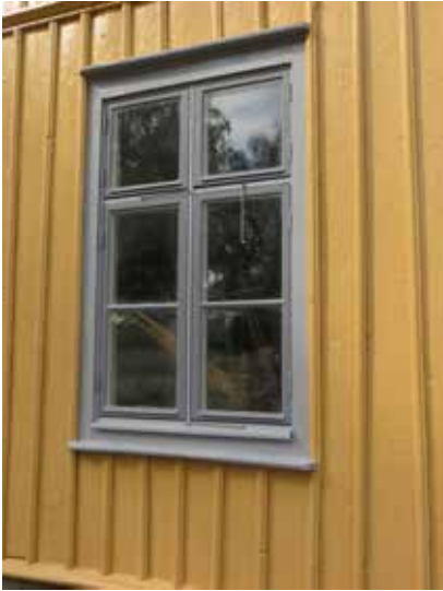
Provmålat fönster där posterna målades i foderfärgen. Detta ändrades sedan.