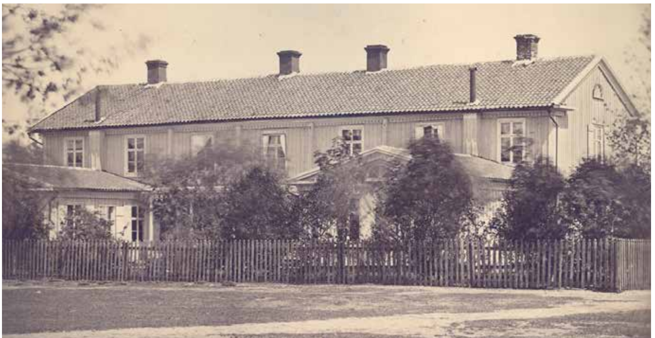
Byggnad 146 i äldre tid.

Antikvarisk medverkan innebär att en antikvarie deltar i en byggprocess. Denna medverkan kan omfatta rådgivning, deltagande i byggmöten och besiktningar, lämnande av detaljanvisningar, dokumentation och rapportering av byggnadshistoriska iakttagelser. Det är vanligen myndigheter som i sin tillståndsgivning beslutar att byggnadsarbeten skall följas av antikvarisk medverkan.