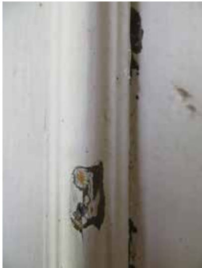
Skrapprov, verandan: ungefär NCS S 6005-Y20R.