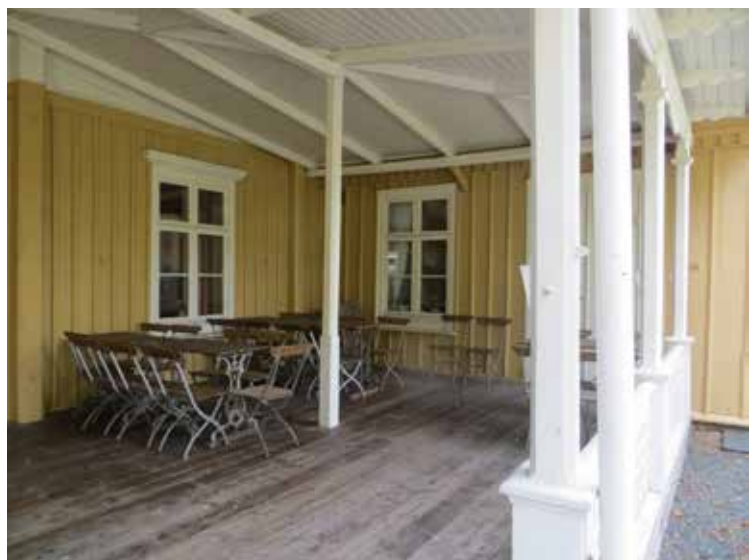
Verandan mot väster inför ommålningen.

År 2007 genomfördes en del reparationer av trapphusets utvändiga snickerier. Samtidigt togs skivbeklädningen bort från entrédörrarna.