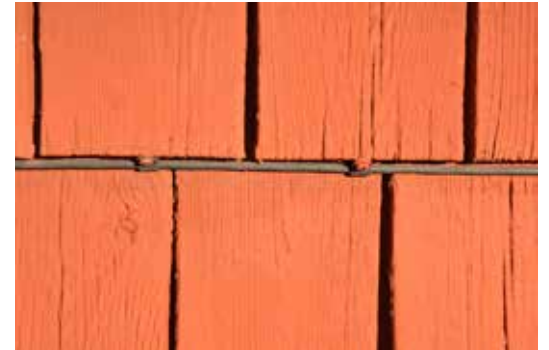
Branddetekteringskabeln på kyrkan var fri från stänk.