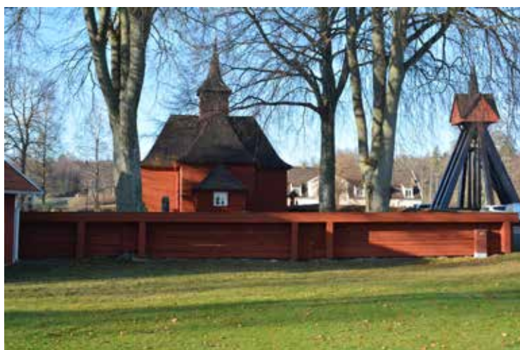
Översikt från öster.