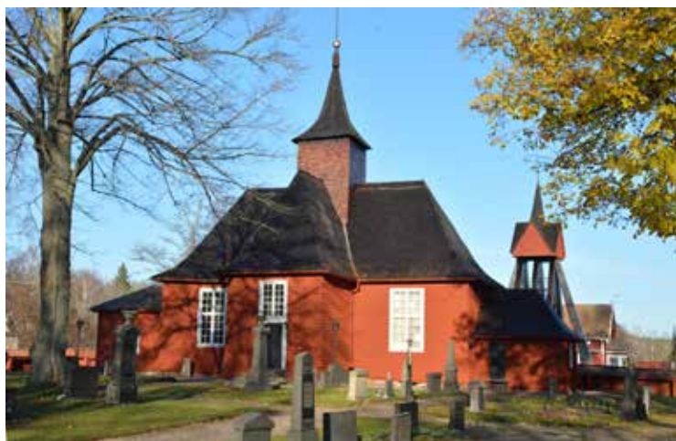
Kyrkan och klockstapeln från söder.