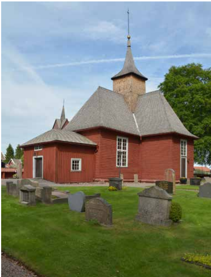
Kyrkan före åtgärd.

Brandstorps kyrka är en korsformad timmerkyrka uppförd 1697. Kyrkan är välbevarad och utgör ett värdefullt exempel på den karolinska periodens byggnadstradition. Kyrkans timrade väggar är utvändigt spånklädda och rödfärgade under det brant valmade sadeltaket. I norr finns ett vapenhus från år 1700 och i söder en