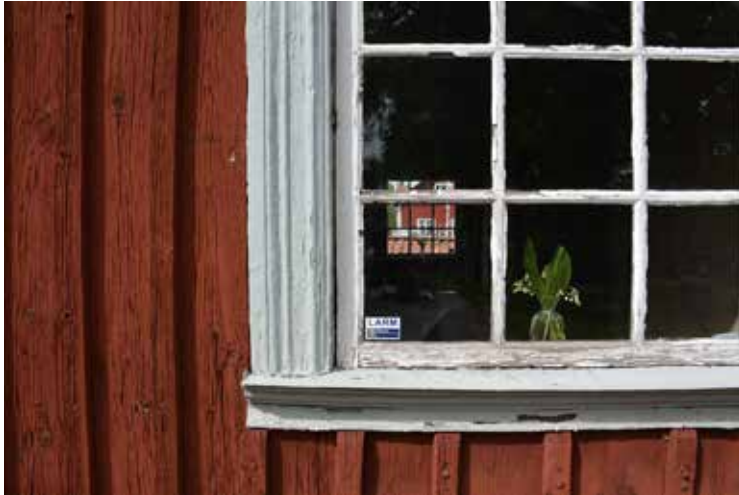
Vapenhusets fönster före åtgärd.