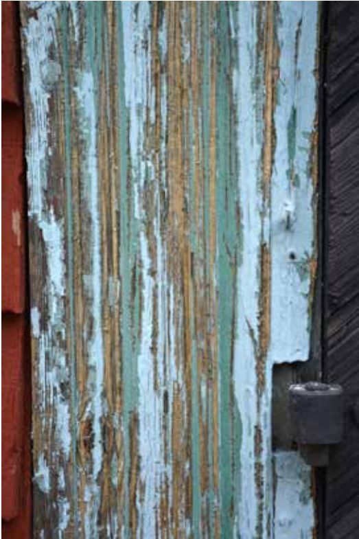
Vid skrapning av dörrfodren framträdde den tidigare kromoxidgröna kulören tydligt.

som kulör för fönster och omfattningar. Kulören fortsätter att vara populär in på 1930–1940-talen.