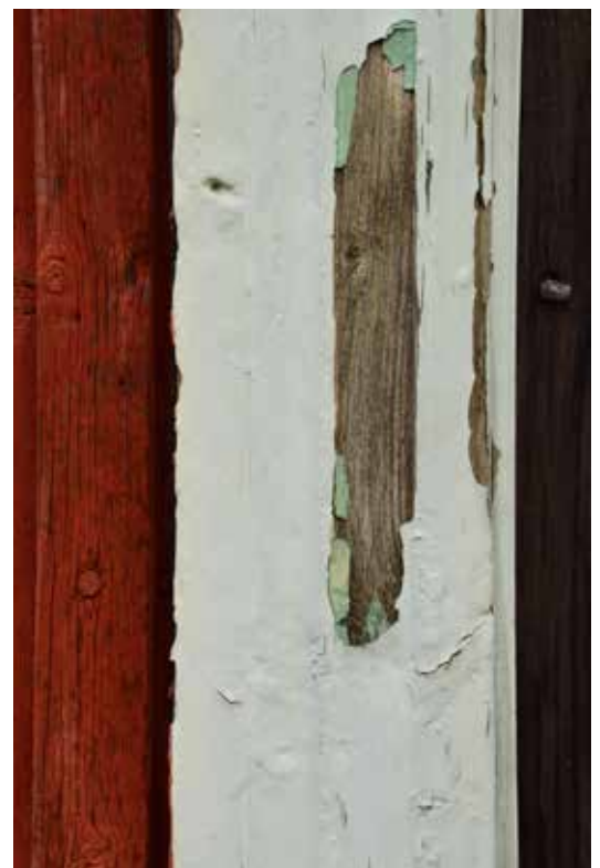
I flaggade partier syntes redan före skrapning en tydlig grön kulör i botten.