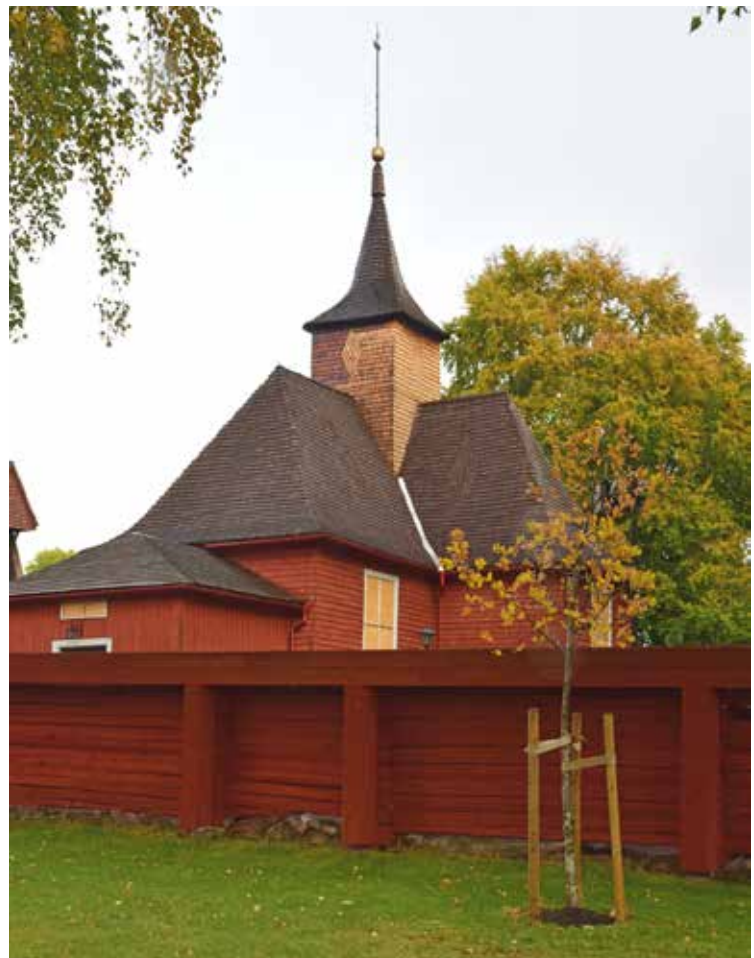
En bild som illustrerar hur påtagligt synliga de rostfria rännalerna är.

I samband med rapportskrivandet noterades att rännalerna som byttes i samband med att taket lades om 2012 inte hade målats när hängränna byttes 2015 som ursprungligen var tanken. Rännalerna är utförda i rostfri plåt och är därmed förhållandevis framträdande mot det tjärade taket. Plåtarna målas lämpligen sommaren 2020 när klockstapeln ska tjäras om, då detta kommer att utföras från lift.