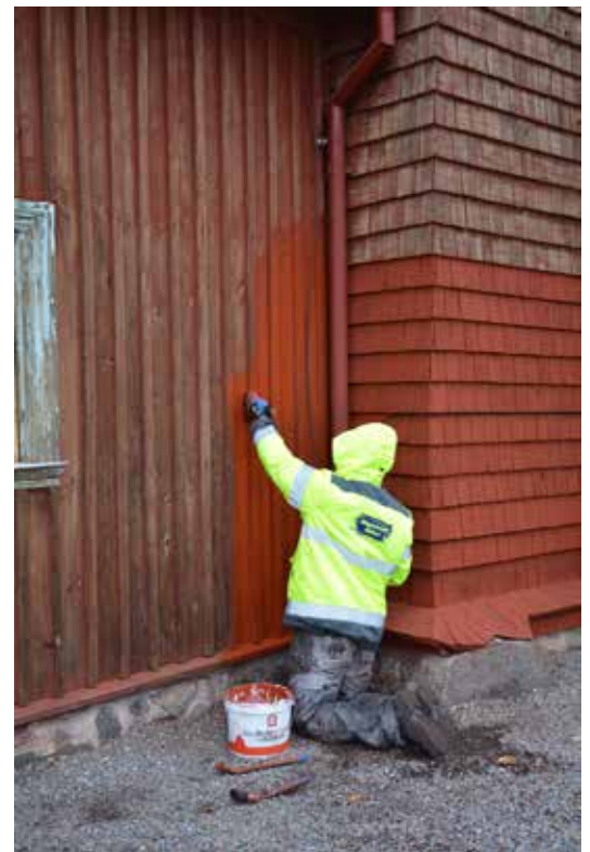
Strykning med rödfärg på den dessförinnan väl rengjorda fasaden.