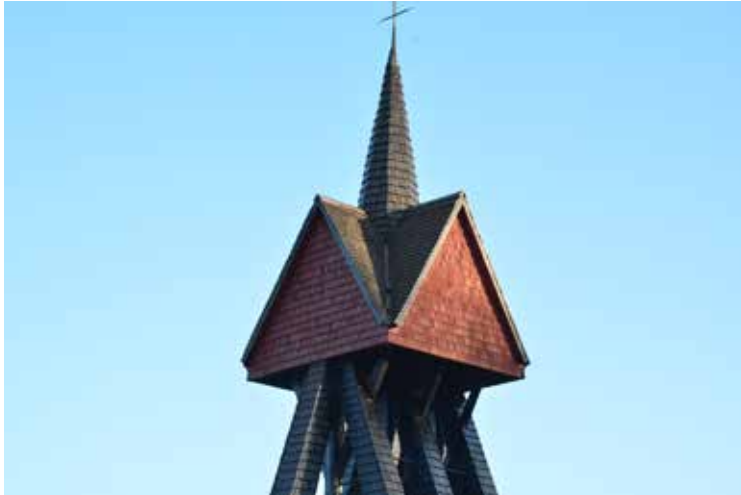
Klockstapeln och de rödtjärade gavelspetsarna.