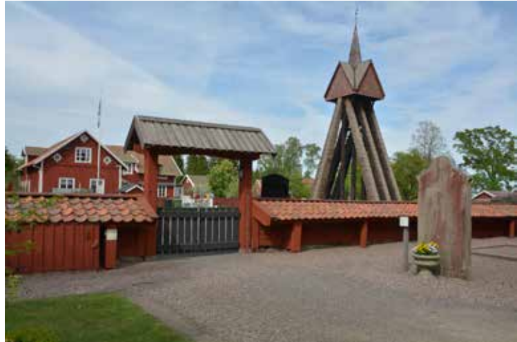
Klockstapeln och "stigluckan" före åtgärd.

sakristia från 1754, vars väggar är klädda med locklistpanel. Över korsmitten rider ett mindre torn med en kort spira. Samtliga takfall är täckta med tjärade spån.