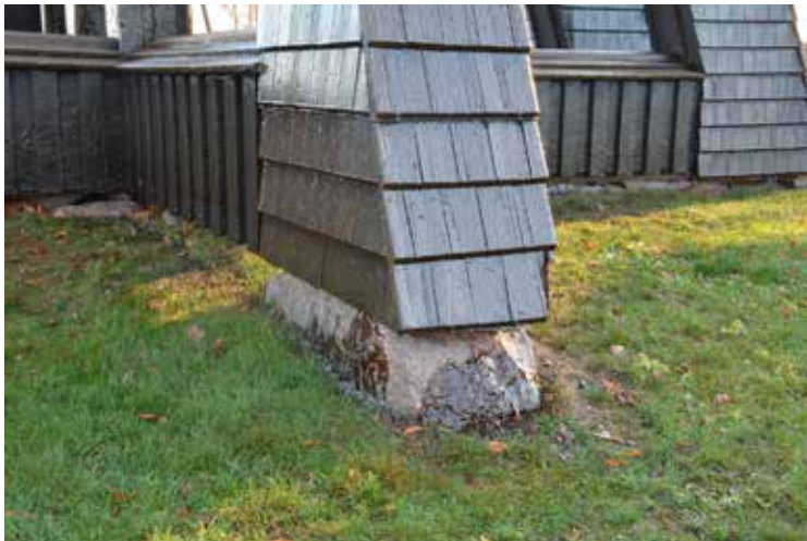
Vid slutbesiktningen noterades viss hinnbildning i tjäran och dropp på klockstapelns syllstenar.