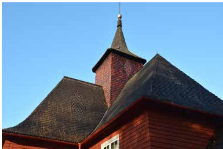
Kyrkans tak och spira.