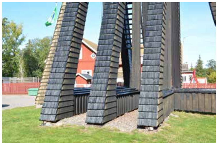
Efterbesiktning av klockstapeln i september 2019, hinnbildningen som noterades vid slutbesiktningen är fortfarande synbar..