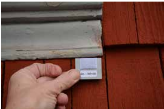
Bestämning av kulören på fönster- och dörrfoder.