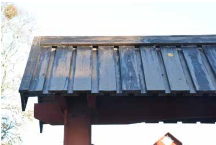
Även på taket över ingången till kyrkogården var det problem med viss hinnbildning i tjäran.