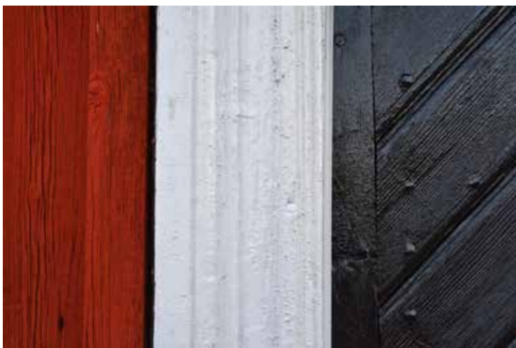
Vissa foder var lite dåligt slipade efter skrapningen vilket påpekades vid slutbesiktningen.