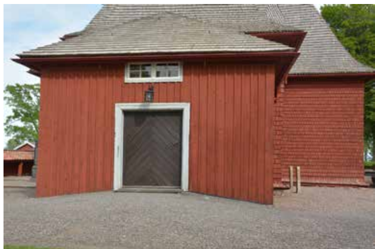
Vapenhuset före åtgärd.

År 2012 lades spåntaket om med kluven furuspån och takfallen lades då med viss mönsterläggning. Förebilden till detta var dels Kinnerus målning i kyrkan från 1748, som skildrar den yttersta dagen förlagd till Brandstorps kyrkogård med kyrkan i fonden dels teckningar från 1829 som folklivsforskaren Nils Månsson Mandelgren utförde och som i princip är identiska med Kinnerus skildring. Spånen var tjärdojade när de lades och tjärades sedan påföljande år. År 2015 byttes hänggrännorna och stuprören i koppar ut mot nya i varmförzinkad plåt som betades och målades med röd linoljefärg.