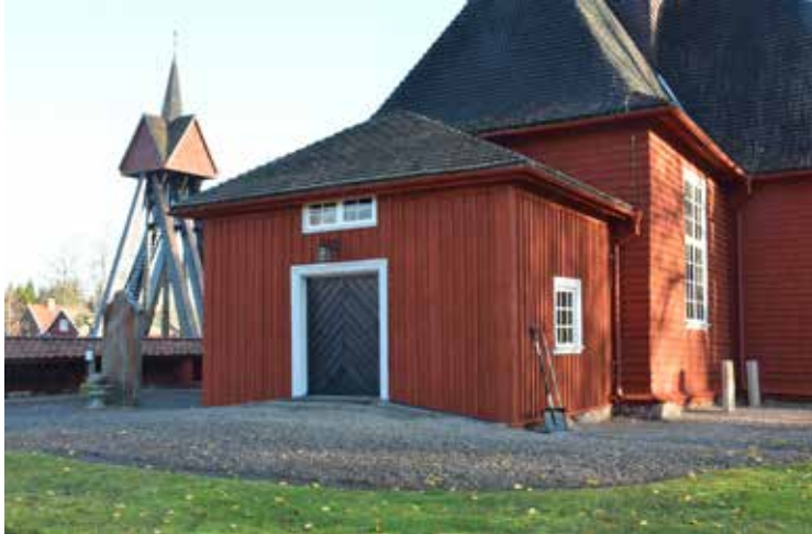
Vapenhuset och entrén.

Fotografier tagna vid slutbesiktningen den 16 november 2018 samt vid efterbesiktning den 23 september 2019.