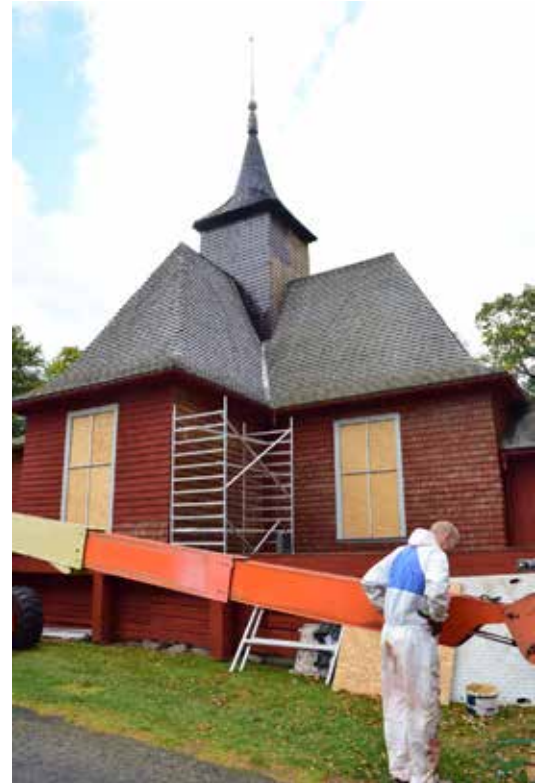
Pågående arbeten. Taket och klockstapeln tjärströks från lift.

Kromoxidgrön är känt sedan början av 1800-talet, färgen kommer i handeln först på 1860-talet och blir då och fram i sekelskiftets nystilar 1900 en mycket populär färg. Men även under nationalromantiken under 1910–1920-talen förekommer den gärna just