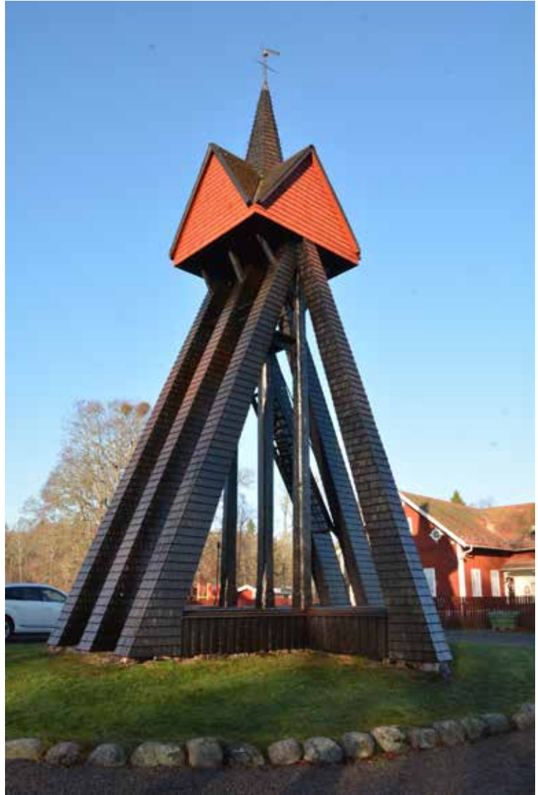
Klockstapeln från söder.