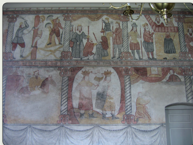
Kalkmålningar från 1600-talet på långhusets norra vägg föreställande scener ur Jesu liv och död.