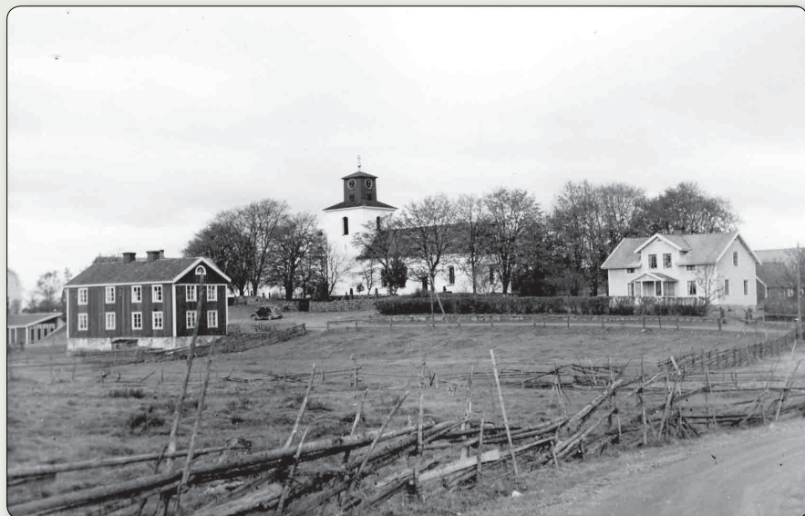
Området kring kyrkan har förändrats en del sedan 1939 då denna bild togs. Till vänster står sockenstugan.

Koordinater: N 6356500 / E 485883 (SWEREF 99 TM) // N 57° 21' 4,137", E 14° 45' 55,420" (WGS84)