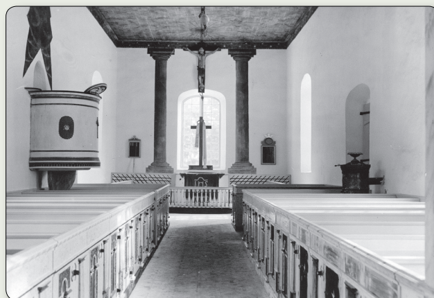
Denna interiörbild från tidigt 1900-tal visar de målade kolonnerna vid sidan om altaret samt den enkla predikstolen på norrväggen. Till höger stod en kamin.

Skepperstads kyrka är ovanlig genom att den har ett yttertak av skiffersten. En anledning till detta är troligen att det låg en skiffergruva i Hörnebo drygt en mil söder ut. Uppgifter gör gällande att skiffertaket lades på kyrkan 1901.