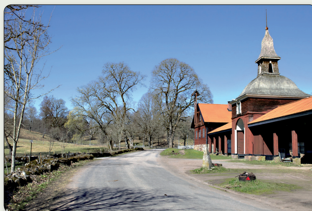
En del av ekonomibyggnaderna på Tunarp. Den resta stenen med inskriptionen står invid vägen Foto Jönköpings läns museum.

Passa även på att se Eriksgatuledens halvvägar norr om Sandhem när du ändå är i trakten, Smultronställe nr 23.