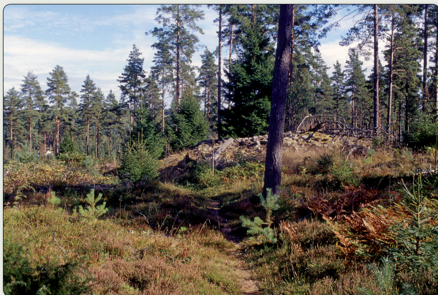
Ett av de många gravrösen som ligger på höjderna väster om Stråken.

N 6426125/ E 429226 (SWEREF 99 TM) // N 57° 58' 16, 16", E 13° 48' 12,91" (WGS84)