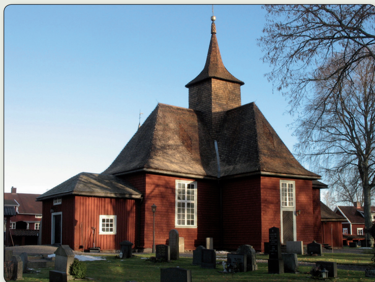
Brandstorps kyrka. Lagg märke till de rombformade och mönsterlagda spånen på taket.

N 6440317/E 452008 (SWEREF 99 TM) // N 58° 6' 5,9", E 14° 11' 8,6"