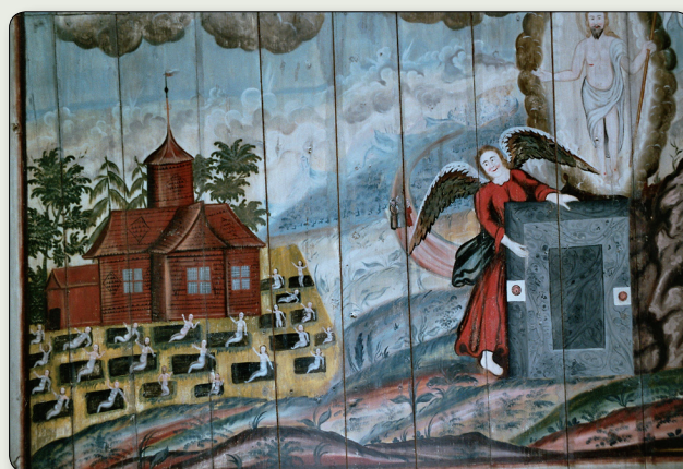
Uppståndelsescenen i norra korsarmen av Johan Kinnerus. På 1700-talsmålningen ses kyrkans rödtjärade takfall och de rombformade spåndekorationerna på fasaderna.

På 1700-talet uppfördes klockstapeln och kyrkan byggdes till med vapenhus och sakristia. Väggar och tak målades år 1748 av jönköpingsmästaren Johan Kinnerus, som också arbetat i Habo kyrka. Av särskilt intresse är uppståndelsescenen i norra korsarmen. Med kyrkan som bakgrund stiger de döda upp ur sina gravar. Målningen visar dessutom hur kyrkans spånklädda fasader och tak dekorerats med spån lagda i rombiska mönster. Detta återskapades år 2013 då kyrkans spåntak lades om.