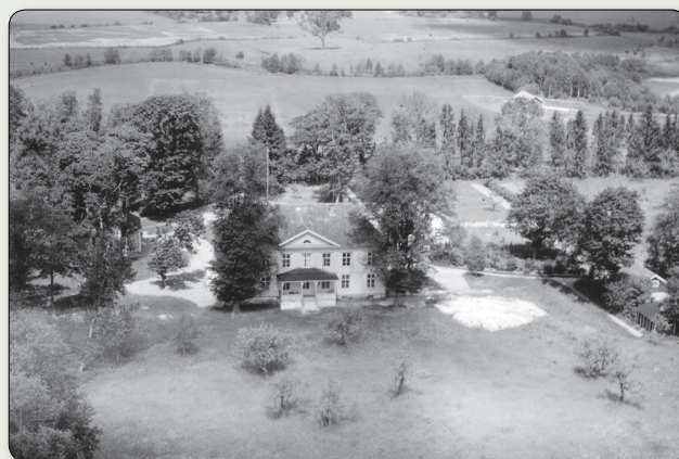
Denna bild från 1940-talet visar Ryningsholms herrgård från söder.

På det största av de kvarvarande gravfälten står drygt hundra resta stenar. Det har genom århundradena varit utsatt för åverkan, dels har man tagit stenar för olika byggnadsändamål, dels har stora delar av gravfältet varit uppodlat. I slutet av 1920-talet restaurerades gravfältet och stenarna restes upp. I samband med detta gjordes även några mindre utgrävningar runt några av stenarna. Man hittade då bland annat brända ben, ett skifferbryne, en järnkniv och järnslag.