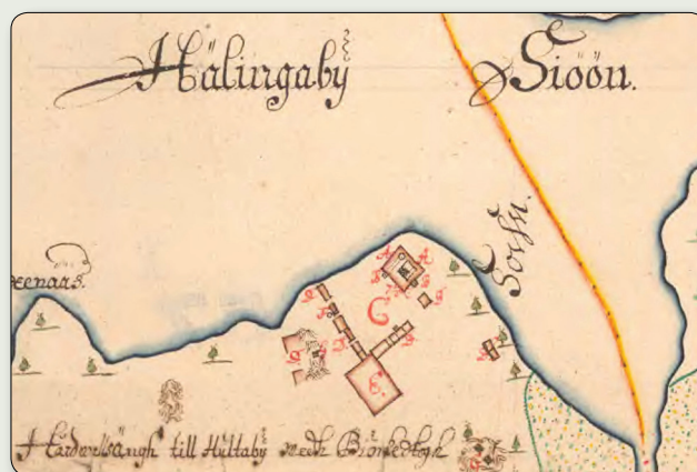
Utdrag ur en geometrisk avmätning från 1693 som även visar slottsområdet. Lantmäteristyrelsens arkiv: Akt E123-57:1.

Ruinen efter Hultaby slott konserverades på 1930- och 40-talen och fick då dagens utseende. Sedan dess är platsen ett omtyckt utflyktsmål och ram för medeltidsspel och marknader.