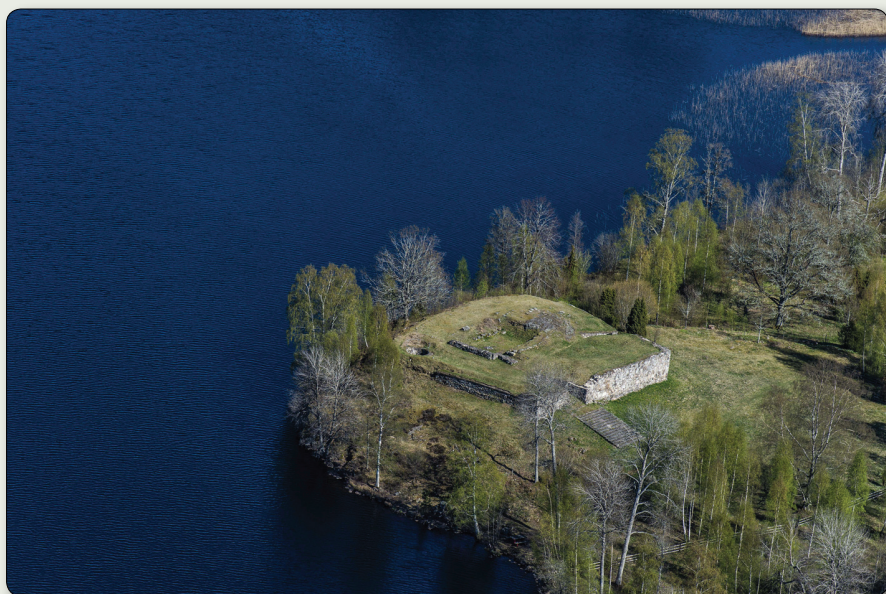
Hultaby slottsruin vid Norrasjön.

N 6364249 / E 502132 (SWEREF 99 TM) // N 57° 25' 15,50", E 15° 2' 7,77" (WGS84)