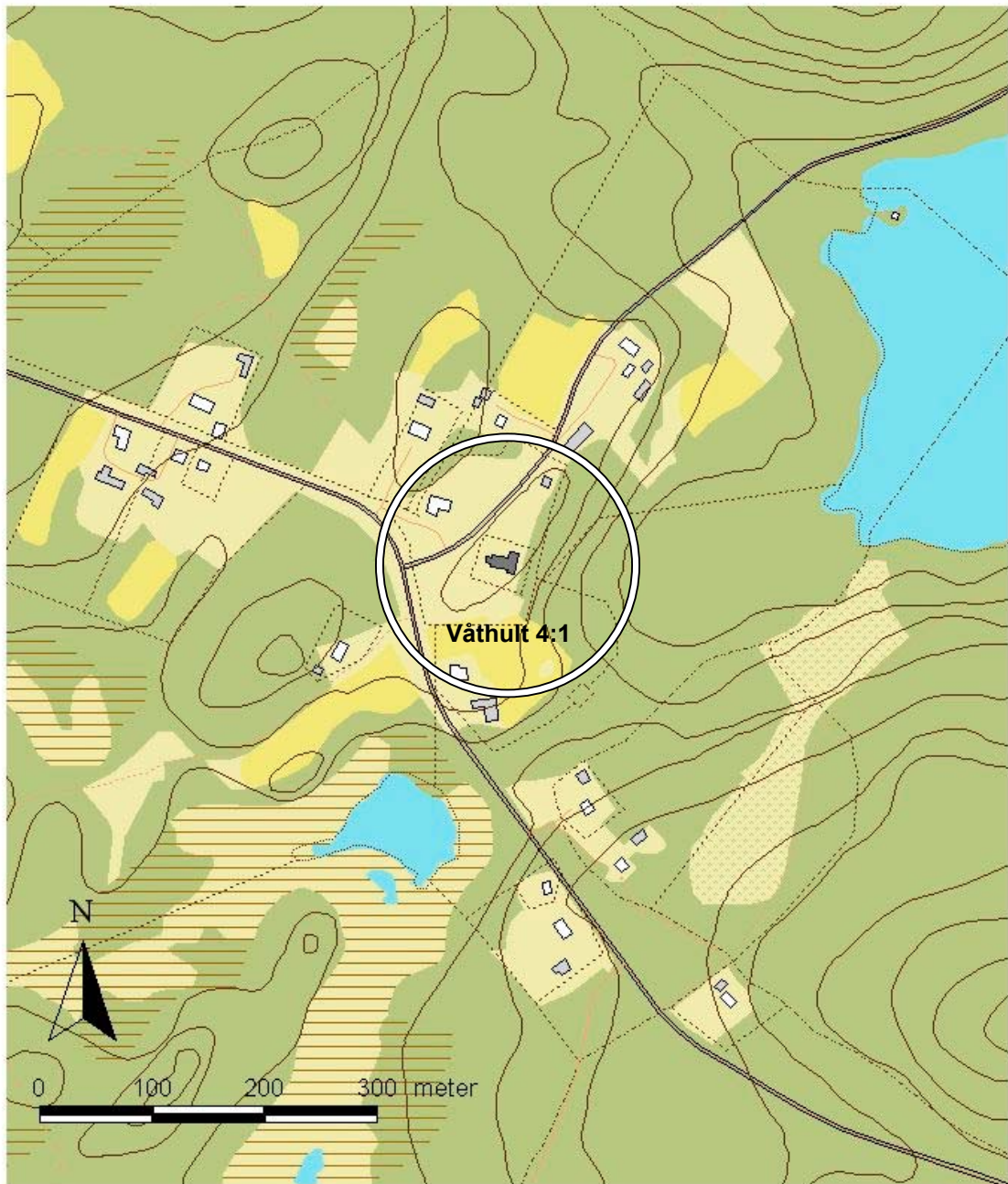
Figur 1. Utdrag ur digitala fastighetskartan 2004.