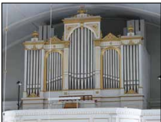
Setterquistorgeln från 1871, restaurerad 1998.