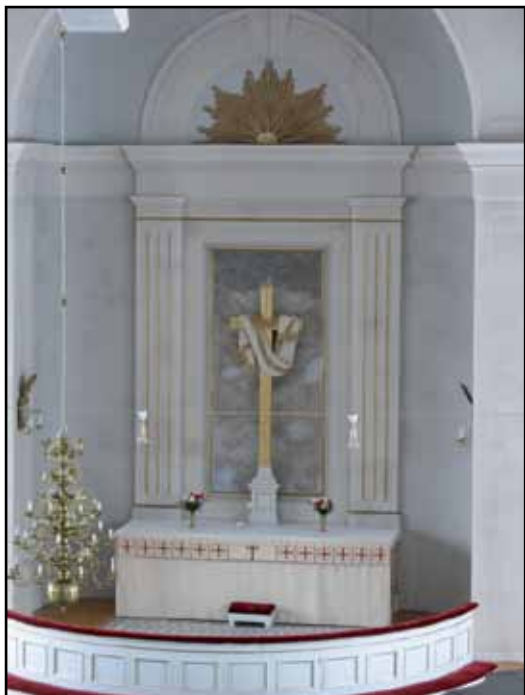
Altare, altarring och svepekors med inramning bildar en orubbad enhet, bevarad sedan byggnadstiden, ett idag tämligen ovanligt förhållande i de nyklassicistiska kyrkorummen.