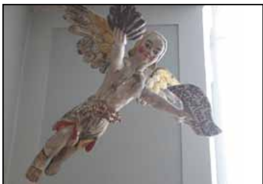
Dopängel från 1700-talet.

bågsmotiv i form av pilastrar och rundbåge. Väggarna är målade med en gråbruten vit tät färg, något ljusare på listverken. Väggarna är dock kraftigt nedsotade, särskilt ovanför de vattenburna radiatorerna. Påtaglig sprickbildning syns i altarnischens hjälmvalv. Läktarunderbyggnadernas väggar är klädda med gråmålad träfiberskiva och har rundbågsnischer med marmorerade stelar. Dessa är kopior av de putsade stelar som finns på den nu inbyggda nordgaveln. Kyrkorummets portar utgörs av halvfranska pardörrar från byggnadstiden, avfärgade i ljusgrå nyanser. Sakristian har en slät, ljusgrå lamelldörr från 1958. Fönstrens innerbågar av ljusgrått trä tillkom 1942. Det putsade taket har en flack valvform med fältindelning genom breda tvärgående lister och smalare längsgående. Fälten är avfärgade i ljus gråblå kulör och listerna i vit. Liksom väggarna har taket sprickbildning och nedsotning.