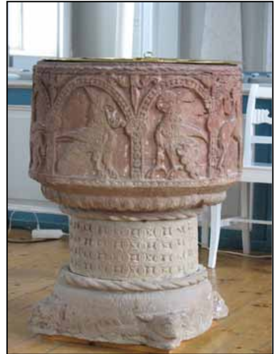
Dopfont huggen av mästare Bestarius.

Den halvrunda sakristian rymmer skrivbord och textilskåp. Golvet bär heltäckningsmatta och väggarna är vitmålade. Det plana, vitmålade brädtaket är från byggnadstiden. Två 1700-talsporträtt skildrar makarna Beth. Vapenhuset har en troligen ursprunglig trappa i norr med gråmålade steg och dekorativt spjälräcke. Under trappan är en elcentral bakom en sentida brädvägg. Golvet består av hyvlade kalkstensplattor. Väggarna är ljusgråmålade. Det plana, svagt ljusgrå brädtaket är från byggnadstiden. På andra våningen är en passage till läktaren, ombyggd 1958. På tredje våningen står ekådrade skåp med böcker. De dekorativa räcken mot trappor och fönstersmygar är bevarade på båda våningarna. På fjärde våningen hänger klockorna. Det rör sig om tre stycken med likartad utformning. De saknar inskription men kan formmässigt dateras till 1500-talet. Alla har elektrisk ringanordning av äldre modell. Även lucköppningen är automatiserad.