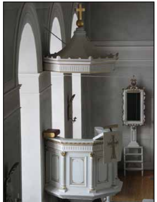
Färgsättningen i vitt och guld är bibehållen sedan det sena 1800-talet.