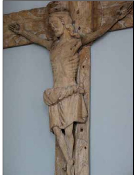
Triumfkrucifix från 1200-talet.

Omtäckning av långhustak med ny plåt. Total exteriör omputsning och avfärgning. Bo Wiksfors arkitektkontor, Huskvarna. AB Karlsson fasadrenovering, Ädelfors. (JLST)