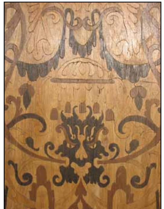
Intarsia på renässanspredikstol av ek från 1600-talet.