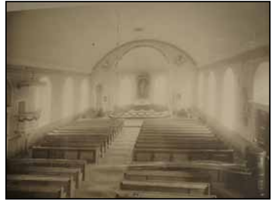
Fotografi taget någon gång mellan 1909 och 1932. Den gamla predikstolen står kvar vid sakristian. Observera järnkaminen till höger.

Elektrisk klockringning och automatisk lucköppning. Inbyggnader under vapenhustrappor för förråd och toalett. Golv av kalksten i