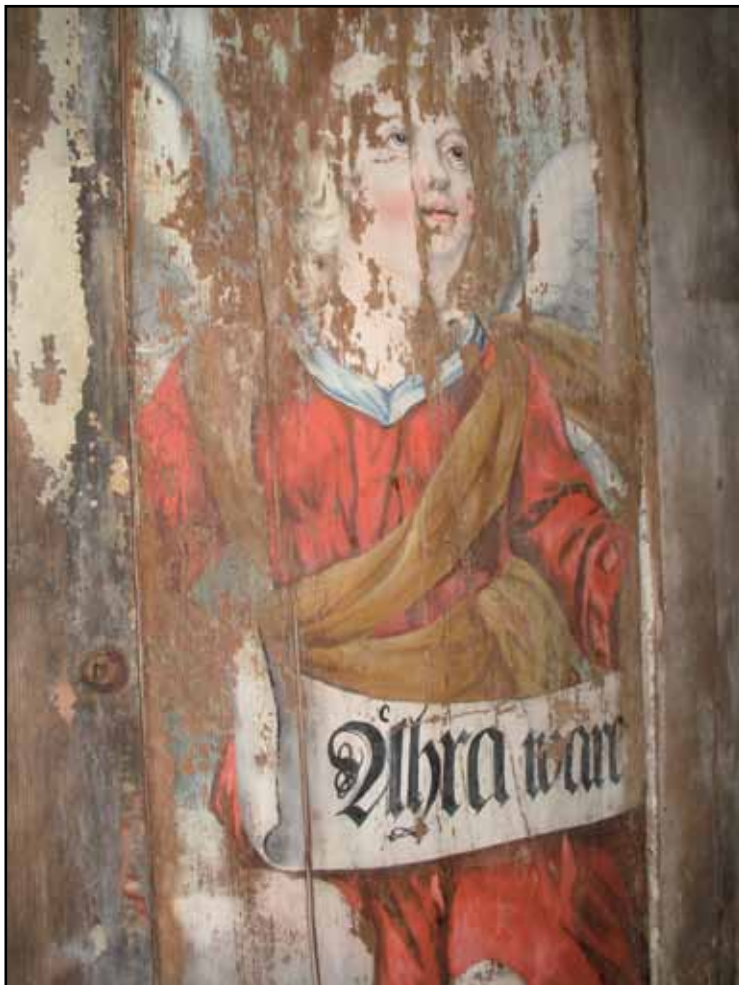
Endast spillror kvarstår i ett fåtal kyrkor av den skicklige konstnären Carl Gustaf Nehrman's takmålningar, vilka måste ses som de mest högtstående i länet från efterreformatorisk tid.

”i tillämpliga delar” återgå till Paulis färgschema från 1937. Väg-garnas cementrika lagningar avlägsnades och ny avfärgning med kalk skedde. Taket återfick sin blå ton. Bänkarna nymålades och fick marmorering i fyllningarna. På läktarbröstet målades fyllningar. Triumfbågen återfick sin omfattning med språkband. 1994-95 konserverades altartavla, triumfkrucifix och predikstol av läns-museets konservatorsateljé. 1995 införskaffades en kororgel från Västbo orgelbyggeri AB. Samma år tillverkades nya entrédörrar för väst- och sydport. 2000 genomfördes en total yttre omputsning till följd av den befintliga putsens dåliga vidhäftning. Omputsningen skedde med Serponit hydrauliskt kalkbruk, vilket avfärgades med rent vit kalkfärg. Tidigare var färgen bruten med guldockra. 2005 konserverades en medeltida madonna från den gamla kyrkan. 2006 installerades uppvärmning genom jordvärme.