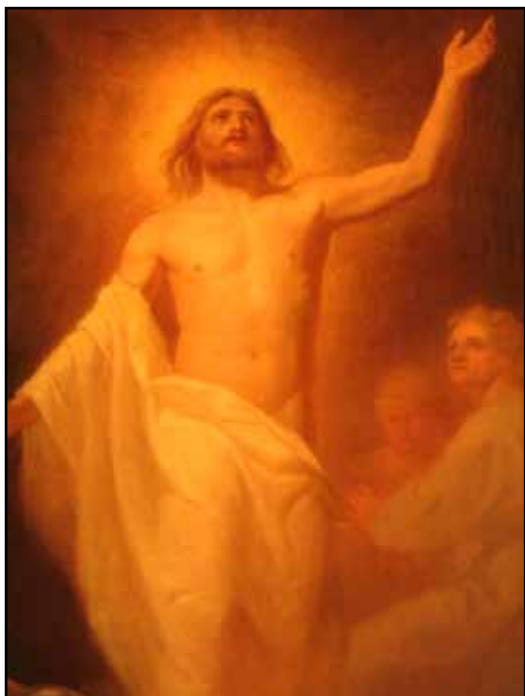
Altartavlan med Kristi uppståndelse är målad 1869 av den välkände konstnären och professorn M E Winge.

Golvet utgörs av oljade furubräder från 1900-talets början. I koret ligger golvet ett trappsteg högre och lades 1983. Väggarna bär vitkalkad slätputs. Mellan fönstren sitter ljusarmar av mässing. In mot absiden öppnar sig en vid triumfbåge med gråmarmorerad omfattning, på vilken står ett bibelord i guld. Västväggen är ovan läktaren klädd med ljuddämpande vävskivor (av typ Ecophone) med iögonenfallande lister. Ingångarna är i väster och söder. Båda har ursprungliga, halvfranska pardörrar med grå bemålning. Mittporten i söder har vindfång och överljus. Sakristidörren på motsatt sida har samma utförande. De stora rundbågsfönstren har gråmålade innerbågar, i absiden med blyinfattat antikglas från 1937. Innertaketets flacka brädvalv är putsat och avfärgat i ljus blågrå ton. 1992 tillkom nuvarande, ljusgrått marmorerade taklist av trä.