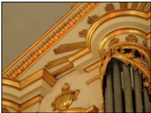
Inventarier från föregående kyrka: gustaviansk orgelfasad, altaruppsats i barock och dopfunt i renässans.