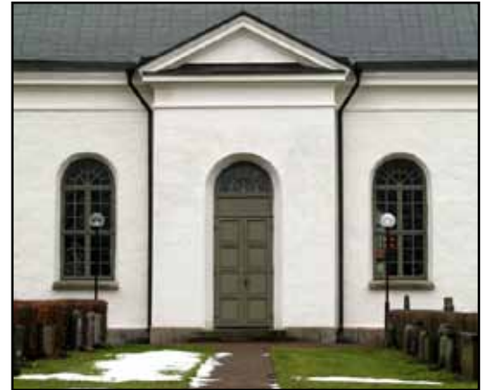
Symmetri och rena linjer är kännetecknande för nyklassicismen, liksom rundbågen och tempelgaveln som hämtats från den antika arkitekturen.

Interiören har en nyklassicistisk grundkaraktär, främst genom den stora rymden. Den ursprungligen mycket strama känslan är dock försvagad under 1900-talet genom inkorporerandet av föremål från den gamla kyrkan. Kyrkorummet övergår i öster direkt i koret, vilket avslutas med en halvrund absid för altaret. I väster reser sig en orgelläktare med underbyggnader. I nordost står predikstol och i sydost en kororgel. De fyra bänkkvarteren definieras av mitt-, tvär- och sidogångar. Ovan mittgång och bänkkvarter samt kor hänger ljuskronor av mässing. Framför läktaren är en öppen yta med manöverpulpet och ljusbärare.