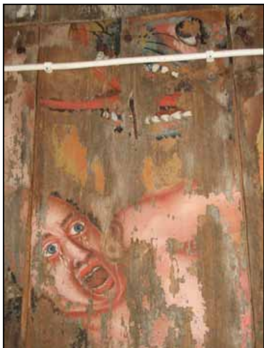
C G Nehrman's takmålningar från 1700-talet är hårt åtgångna till följd av sin placering ovanför klockorna.