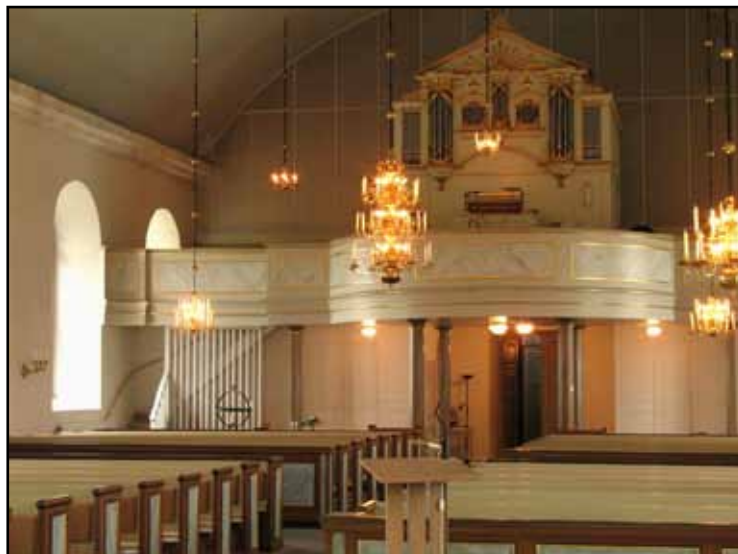
Vy mot väster med den 1937 ombyggda orgelläktaren och stram bänkinredning från samma år. Västgavelns plattbeklädning ger ett störande intryck.

Golvet utgörs av oljade furubräder från 1900-talets början. I koret ligger golvet ett trappsteg högre och lades 1983. Väggarna bär vitkalkad slätputs. Mellan fönstren sitter ljusarmar av mässing. In mot absiden öppnar sig en vid triumfbåge med gråmarmorerad omfattning, på vilken står ett bibelord i guld. Västväggen är ovan läktaren klädd med ljuddämpande vävskivor (av typ Ecophone) med iögonenfallande lister. Ingångarna är i väster och söder. Båda har ursprungliga, halvfranska pardörrar med grå bemålning. Mittporten i söder har vindfång och överljus. Sakristidörren på motsatt sida har samma utförande. De stora rundbågsfönstren har gråmålade innerbågar, i absiden med blyinfattat antikglas från 1937. Innertaketets flacka brädvalv är putsat och avfärgat i ljus blågrå ton. 1992 tillkom nuvarande, ljusgrått marmorerade taklist av trä.