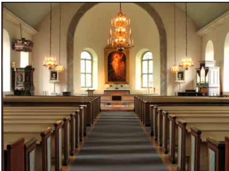
Interiören har i stora drag kvar sin nyklassicistiska karaktär med ljus och rymd.