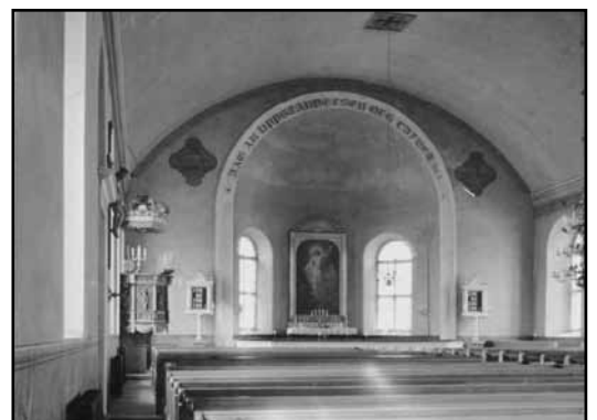
Kyrkorummet efter 1909 års nymålning med schablondekor och språkband.