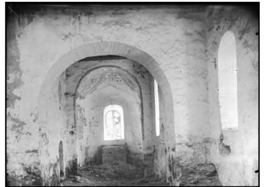
Fotografi av interiören från 1902.