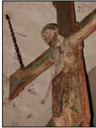
Absiden med sitt 1600-talsmaleri t.v. Det romanska triumfkrucifixet och triumfbågens senmedeltida målningsfragment t.h.