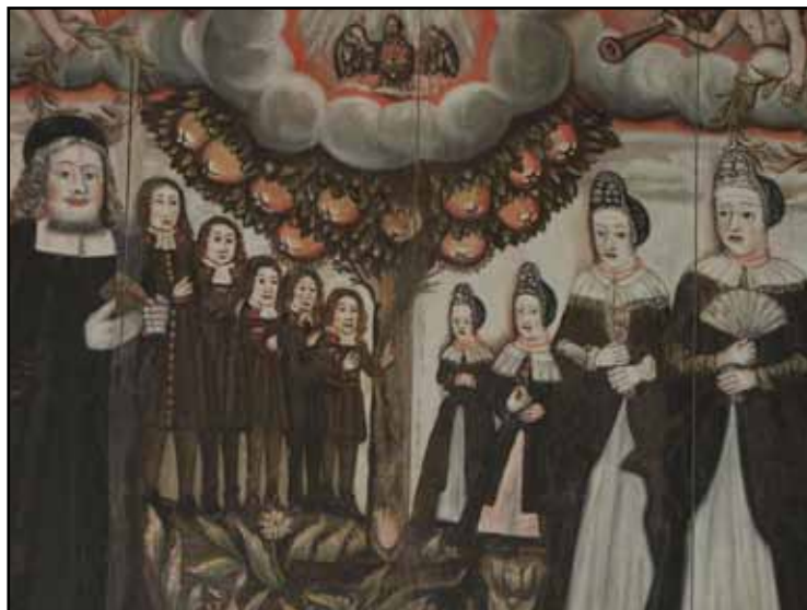
Epitafium från 1701 över kyrkoherde Strelingius med familj.

Konservering av måleri och inredning till följd av mögel och torkskador. Konservator Gunnel Rosenquist, Jönköpings läns museum. (JLST)