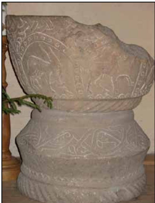
Romansk sandstensdopfont med de för Njudungsfuntarna typiska fabeldjuren.