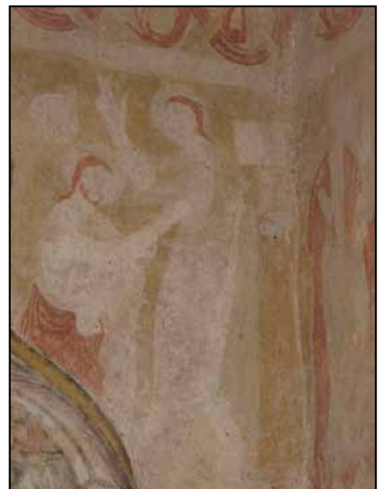
Romanskt måleri, troligen Kristi dop, på norra korväggen. T.h. om scenen en figur som tolkat som stiftare.