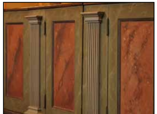
Sluten bänkinredning från 1926 med välgjorda marmoreringar från samma tid.