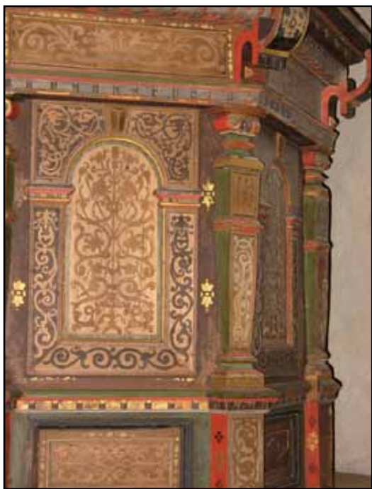
Predikstolskorg i renässans från 1649 med rika intarsiaarbeten.