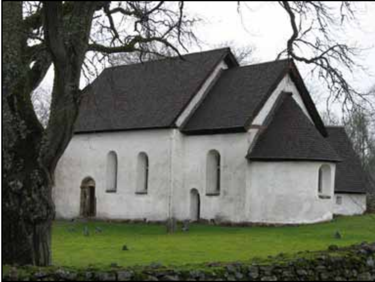
Myresjö gamla kyrka från sydost. Spåntäckningen bidrager till det medeltida intrycket.