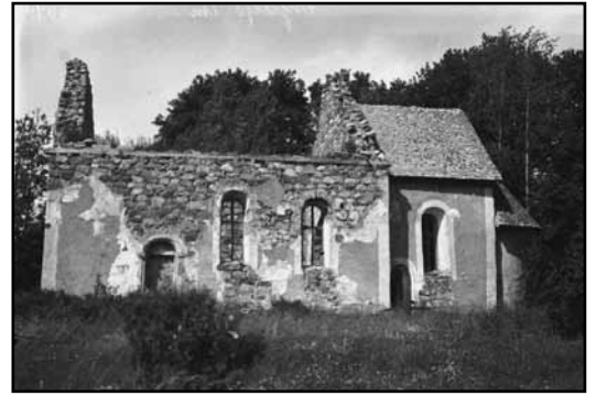
Fotografi av kyrkan från 1923, taget av Sven Brandel. ATA.

1965 försågs kyrkan med en femstämmig orgel, byggd av Olof Hammarberg, Göteborg, med fasad ritad av arkitekt Åke Tengelin. 1969