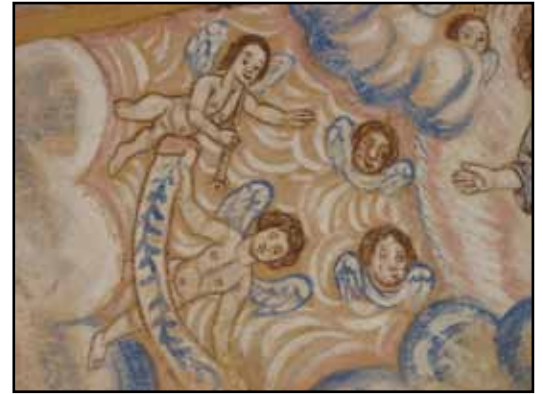
Detalj av målningarna i absidvalvet.

Sakristian har skurgolv och vitputsade väggar. Taket är tunnvälvt och vitputsat. I sydväst står ett väggfast textilskåp av laserade bräder. Under golvet finns en gravkammare tillhörig släkten Rosenqvist som ägde Bjädesjö säteri. Även under korgolvet finns en grav.