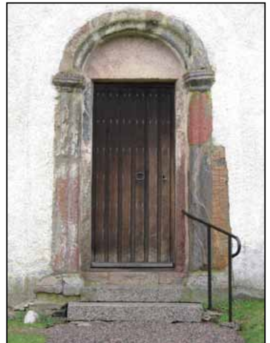
Den romanska sydportalen med inmurad runsten.