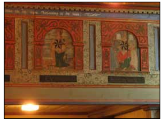
Läktarbröst i renässans med målad dekor från 1745.