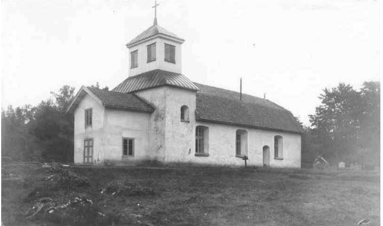
Kyrkan 1923, med utseendet efter 1888 års restaurering.

kalkbruk "Special". Avfärgning gjordes med Serponit Kulturfärg i tre strykningar (306 A varmvit). Fönsterbänkar av betong målades med KC-färg från Ernström & Co (A 17 med någon inblandning av gult och rött till varmgrått). Fönsterbågarna målades med Tranemo linoljefärg (R 82 brunröd). År 1998 lades nytt tegeltak. År 2008 ommålades fönsterbågarna i befintlig kulör med Wibo linoljefärg.