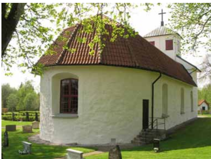
Kyrkan från nordost efter avslutade arbeten.