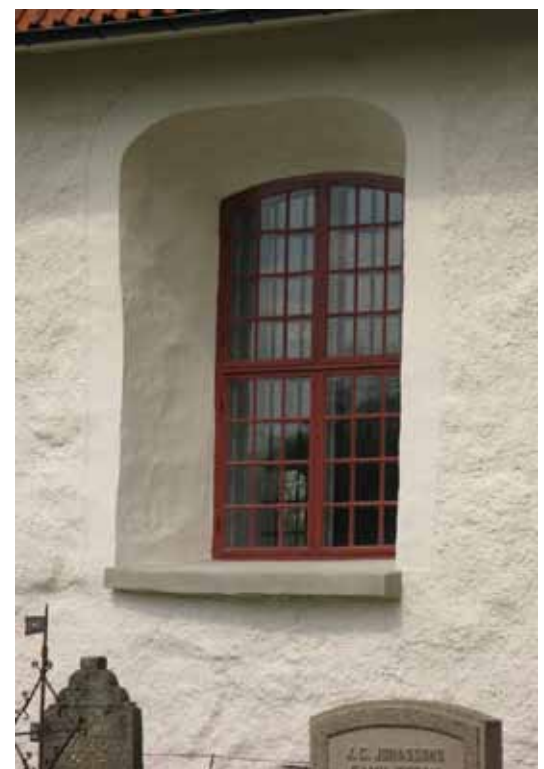
Bättringsmålade fönster och omfiltade solbänkar.