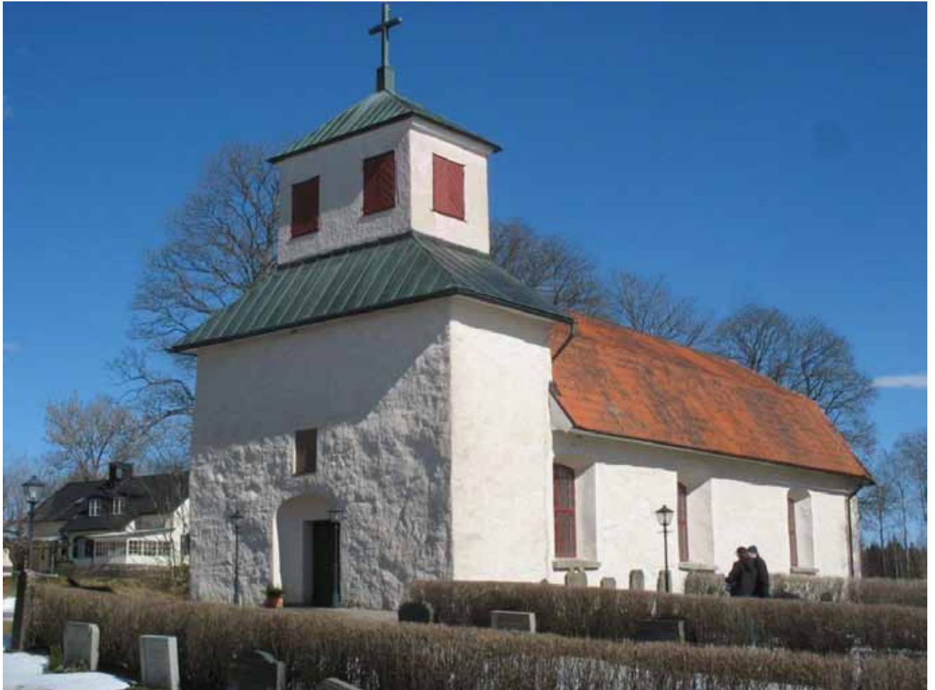
Dannäs kyrka från sydväst före arbetenas påbörjande.