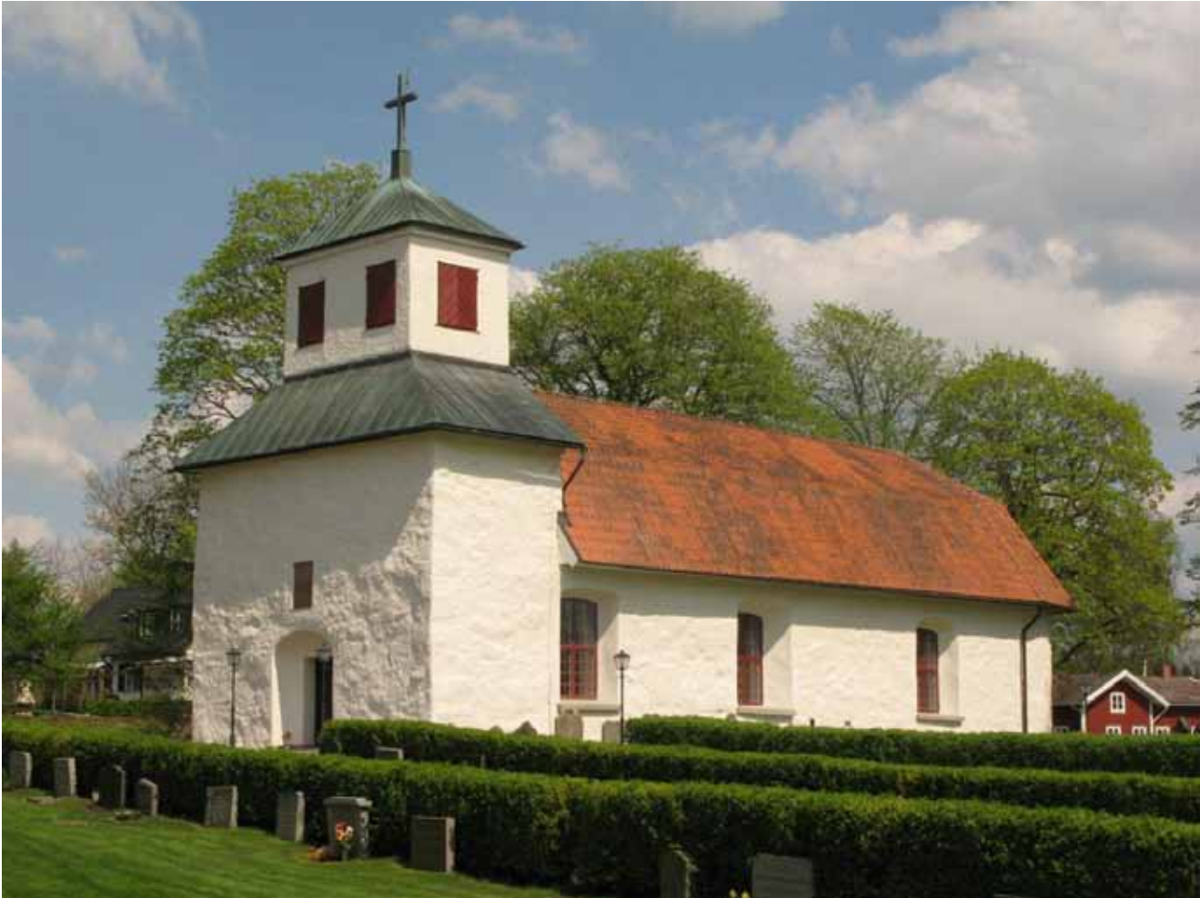
Kyrkan från sydväst efter avslutade arbeten.