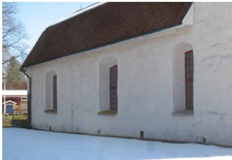
Nordfasaden före renovering.