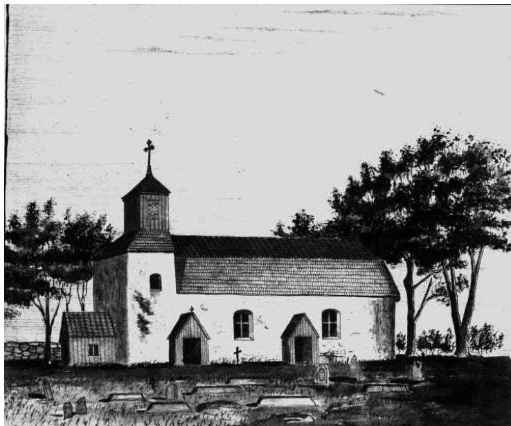
En teckning av Eric Ihlfors i "Smolandia sacra" visar hur kyrkan såg ut före 1888 års restaurering. Notera att lanterninen är panelklädd. JLM.