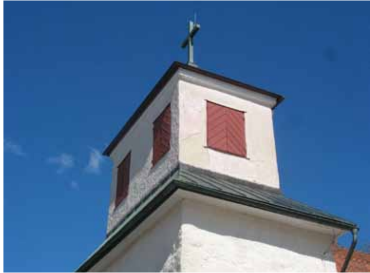
Putsskador på den reveterade lanterninen.