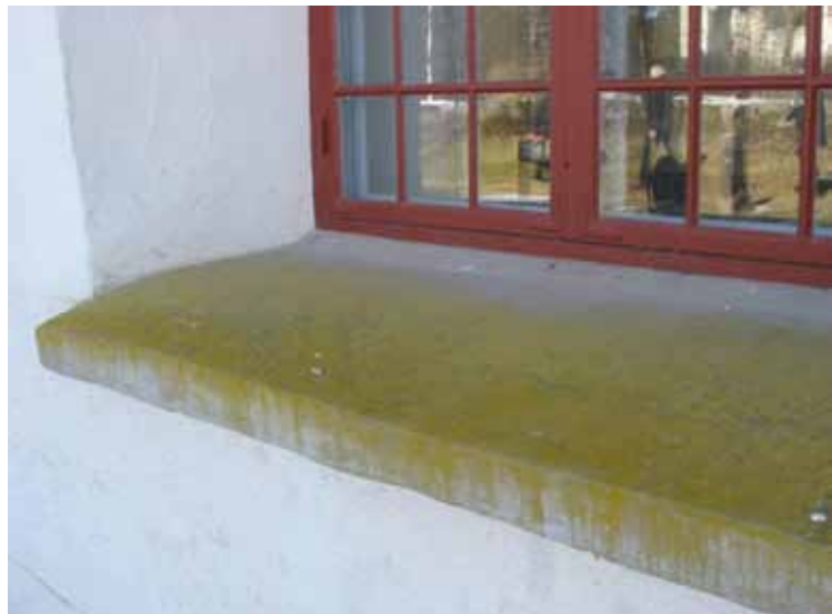
Solbänkar i cement med sprickor och påväxt.