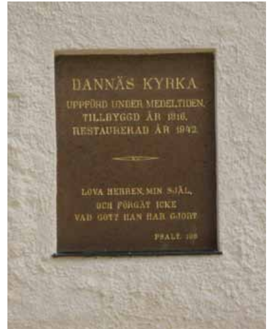
Inskriptionstavlan från 1942 omförgylld.