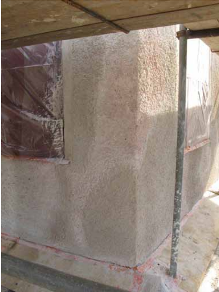
Putslagning pågår på lanterninens sydvästra hörn.