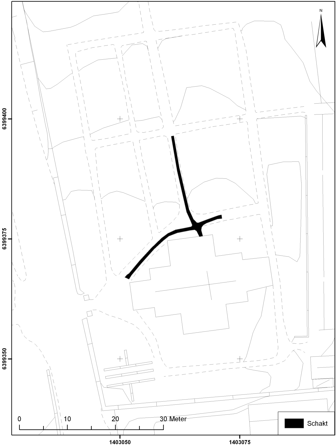
FIGUR 2. De grävda schakten. Skala 1:400.