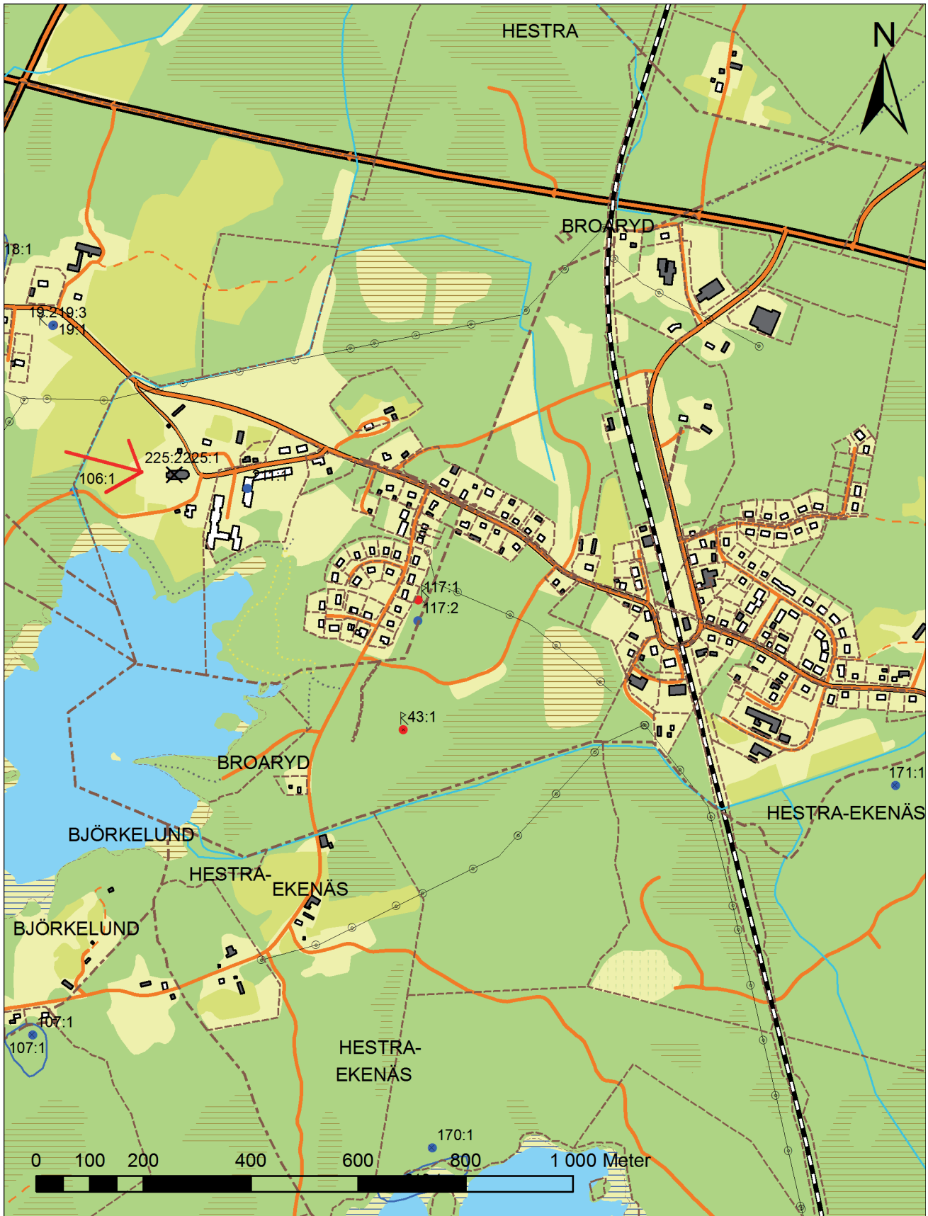
FIGUR 1. Utdrag ur den digitala fastighetskartan motsvarande den ekonomiska kartans blad Södra Hestra 5C 7i. Skala 1:10 000.