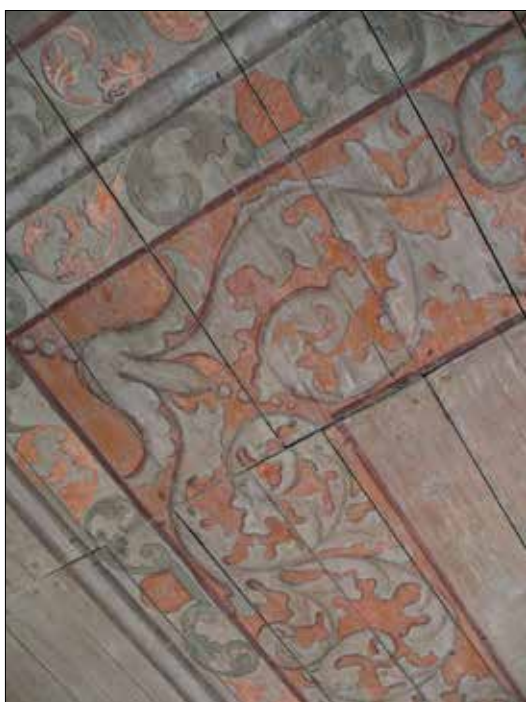
Ovan och överst: takmålningarna av okänd mästare från 1706 ger ännu en bra föreställning om hur de en gång såg ut. Överst till höger: orgelläktaren bärs upp av smidda stöttor.