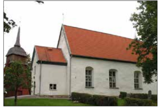
Ovan: Sandseryds kyrka, vy från söder med klockstapel i bakgrunden. Till vänster: Interiör mot koret.

Måleriet i taket är troligen från 1706 då kyrkan på nytt uppfördes efter en brand. Måleriet togs fram vid renoveringen 1935 och består av fyra tavlor med bibliska motiv, inramat av akantusslingor. Måleriet restaurerades och till viss del kompletterades vid framtågandet. Mot väggarna avgränsas det platta brädtaket med en enkelt avfasad kantbräda. Väggarna är slätputsade i en svagt gulbruten vit kulör. Bänkkvarteren är slutna med grönmarmorade gavlar och dörrar med ljusbruna spegelfält. Dörrarna är nya men tillverkade och utformade efter de äldre dörrar som hittades i trossbotten vid renoveringen 1935. Föregångarna ligger på vinden med äldre ljusgrå bemålning. Golvet i bänkkvarteren är ett rödtonat furugolv. Golvet i koret och mittgången är yngre och är lagt av ljus, fernissad men opigmenterad furu.