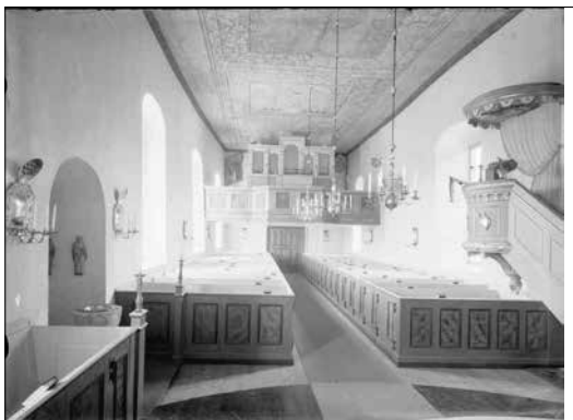
Koret så som det såg ut efter 1908 års renovering. Foto: Paul Boberg vid 1940-talets början. ATA.