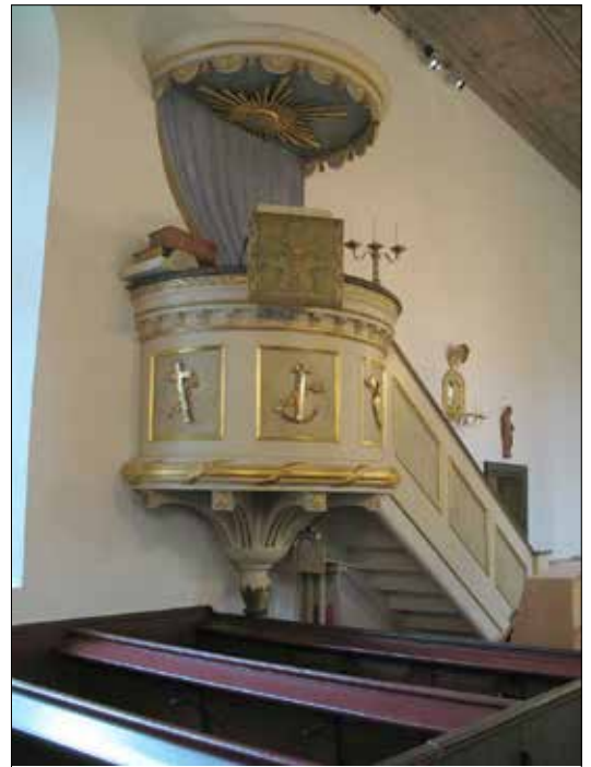
Predikstolen. Uppgifterna går isär men troligen är den från 1820.