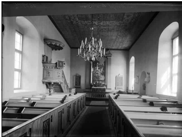
Sandseryds kyrka fotograferad efter renoveringen 1936.

äldre bänkdörrar finns bevarade på vinden med ursprunglig färgsättning kvar. Istället för glasmålningen i korfönstret sattes en altartavla in, målad av Georg Pauli. Ytterligare en stor förändring som renoveringen 1936 ledde till var att det gamla innertaket från 1706 togs fram - med de därunder bevarade takmålningarna. Målningarna och kompletterades till viss del av konservatorer men endast så försiktigt att man inte förvanskade något av det ursprungliga. Som ett exempel på hur takmålningarna hade kunnat se ut i ursprungligt skick utförde konservatorn Sven Wahlgren ett exempel på detta i vapenhuset. Dessa är nu övertäckta.