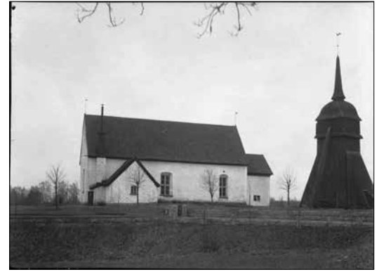
Ovan och till vänster: Sanderyds kyrka före renoveringen 1936. Lägga märke till interiören med glasmålning i koret, listverk i taket, äldre bänkar och takbården. Foto Bertil Berthelson 1934, ATA.

omfattande ompnutsning av hela kyrkan 1994. Fönsteromfattningen har gotisk spetsbågeform, vilket innebär att den troligen kom till tidigast under 1300-talet. Möjligen har kyrkan föregåtts av en äldre kyrka i trä. Någon gång har den dessutom utvidgats mot öster, i full bredd, något som också syntes tydligt i murverket vid den tidigare nämnda ompnutsningen 1994.