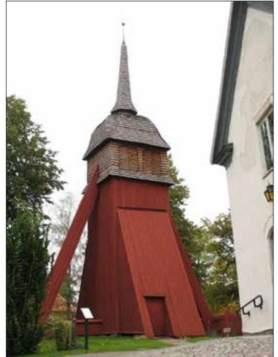
Klockstapeln har funnits sedan åtminstone 1700-talets slut då första kända uppgifter om reparationer på den finns. .