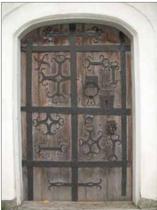
Dörr till kyrkan, vapenhuset, med medeltida smidda detaljer. Smidesdetaljerna är dock sekundärt ditsatta, troligen efter brand. .

Nästa stora renovering blir 1996 då bänkarna får ny färgsättning på rygg- och sittbräda, koret görs större genom att korbänkar tas bort, altaret skiljs från altartavlan genom att flyttas fram och boaseringen i koret tas bort. Även golvet förnyas i mittgång och kor. Vid denna rapportens färdigställande 2007 planeras en återgång till vapenhusets tidigare panelklädsel, mycket på grund av problem med putsens dåliga hållbarhet.