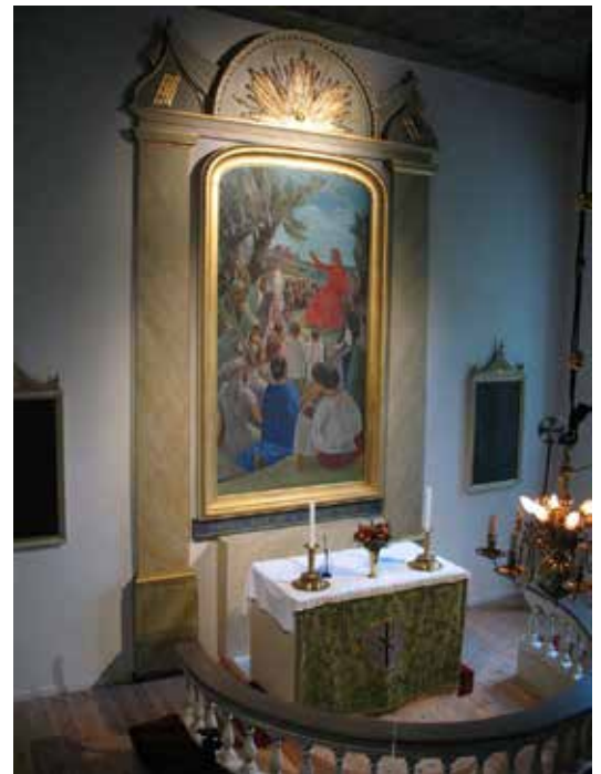
Altartavlan av Georg Pauli, inramad av en tidigare fönsteromfattning från 1800-talet.