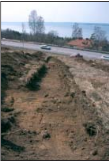
Figur 3. Påträffad härd i Schakt X. Foto från nordost: Linnéa Varenius