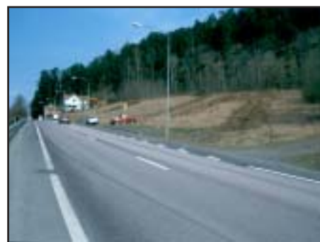
Figur 2. Översiktsbild med sökschakt inom den norra delen av undersökningsområdet, fastigheten Vattentuben 1. Foto från sydväst: Linnéa Varenius.

Närmaste utförda undersökningar i förhållande till utredningsområdet är boplatsoområdet, fornlämning 339 med härdar och mörkfärgningar, som hittades i samband med en arkeologisk utredning 1993 (Nordman 1993). Detta ligger ca 300 meter väster om undersökningsområdet. På samma avstånd fast söderut undersöktes år 1970 en skadad, rund stensättning fornlämning 66 tillhörande gravfältet Galgen, fornlämning 64. I denna påträffades två brandgropar med kol och brända ben samt ett brandlager innehållande kol, sovfärgad jord, brända ben, fragment av en ornerad benkam och förrostade järnföremål, bl a en remsölja (Börjesson 1984).