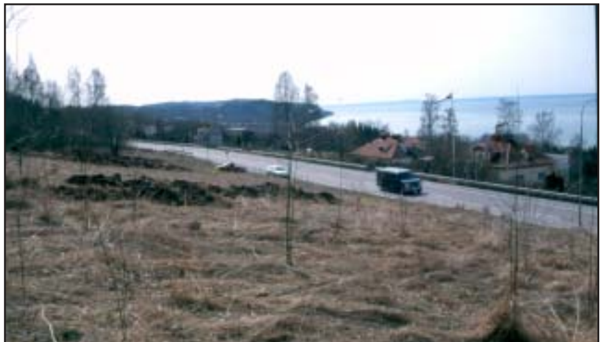
Figur 4. Översiktsbild med sökschakt inom den norra delen av undersökningsområde, fastigheten Vattentuben 1. Foto från nordnordost: Linnéa Varenius.

Inom utredningsområdets norra del, fastigheten Vattentuben 1, påträffades tre härdar och ett möjligt stolphål i schakten IX–XI (figur 3 och bilaga 2). De tre härdarna var ca en meter stora medan stolphålet var ca 0,5 meter stort. Samtliga anläggningar låg samlade inom ett område som utmärktes av ett visst platåläge i den annars sluttande terrängen (figur 4). Förutom att den norra delen av undersökningsområdet skiljde sig från den södra avseende förekomst av anläggningar, varierade också jordarten. I den norra delen var nämligen älvsedimenten betydligt mer grusiga än i den södra delen. På sina ställen gick också stråk med skiffer i dagen.