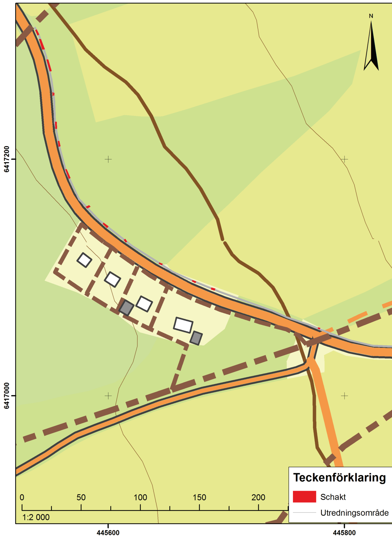
Karta med söschakten markerade med rött. Skala 1:2000.