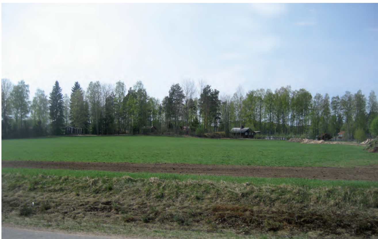
FIGUR 3. Vy över boplatssläget med Långanäsasjön i bakgrunden.

Jönköpings läns museum och länsstyrelsen har samrått kring åtgärdsförslaget.