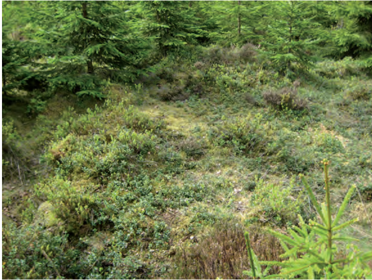
Figur 4. Husgrund. Till vänster i bilden syns husgrundens östra kant. Invid granarna uppe till höger skymtar det förmodade spismursröset.

I den nordöstra delen av inventeringsområdet påträffades: