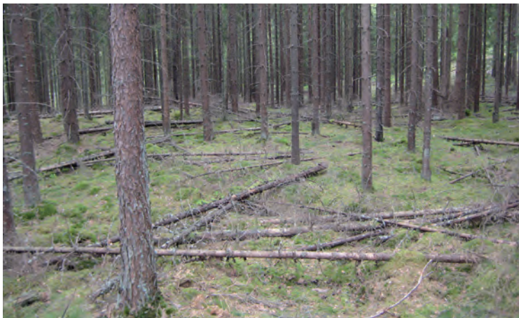
Figur 6. Kolbotten, knappt urskiljbar.