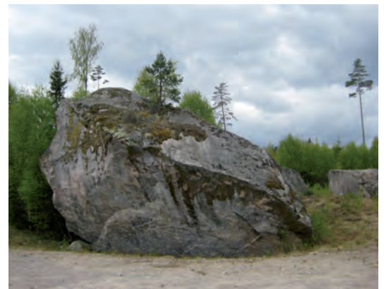
FIGUR 2. Jättestenen RAÄ 26.

Lönshult ligger i nordvästra hörnet av Bredaryds socken. Byn gränsar i väster och norr till Anderstorps socken och i sydväst till Reftele. I närheten av utredningsområdet finns ett flertal torplämningar med tillhörande röjningsrösen, terrasskanter och röjda ytor. Några av dessa är: Södra Bygget RAÄ Anderstorp 15, Söderskogen RAÄ Anderstorp 17, Norrskogen RAÄ Anderstorp 25, Mörkebo RAÄ Reftele 503, Bygget RAÄ 140, en torplämning utan känt namn RAÄ 141, Dalstorp RAÄ 142 och Lassaboryd RAÄ 143. Dessutom finns strax söder om utredningsytan lämningarna efter en linbastu, RAÄ 139. Inne i området ligger den så kallade Jättestenen RAÄ 26, som är en naturbildning med tradition. Blocket sägs enligt sägnen ha kastats mot Anderstorps kyrka. I Anderstorps socken finns vidare fördämningsvallar efter kvarn eller såg, RAÄ 13, en dammvall, RAÄ 14, och en bergsplåtå med namnet Kisteberget, RAÄ 23. Samtliga uppräknade fornlämningar ligger inom Bredaryds socken om inget annat anges.