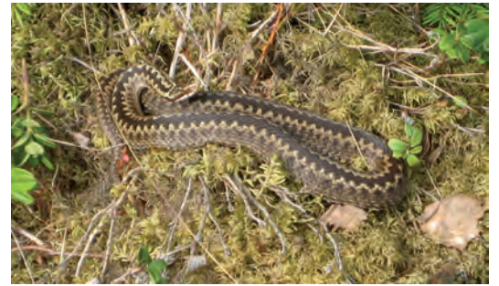
Figur 5. Husgrundens väktare.

Kolbotten, 12 m diam och 0,2 m h. Runt kanten är täktgropar, 1,2 m breda och 0,2 m djupa. Provstick gav rikligt med kol på 15 cm djup. I närområdet, främst åt norr, finns flera oregelbundna gropar och förhöjningar, men provstick gav bara sand.