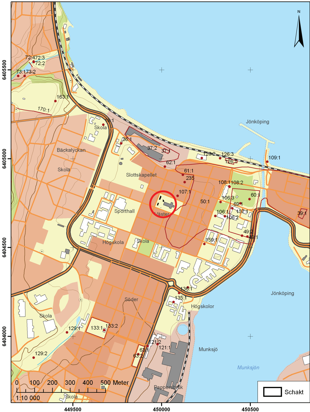
Karta 1. Översikt över förundersökningsområdet. Skala 1:10 000. Platsen markerad med röd cirkel och schakten markerade med svart.