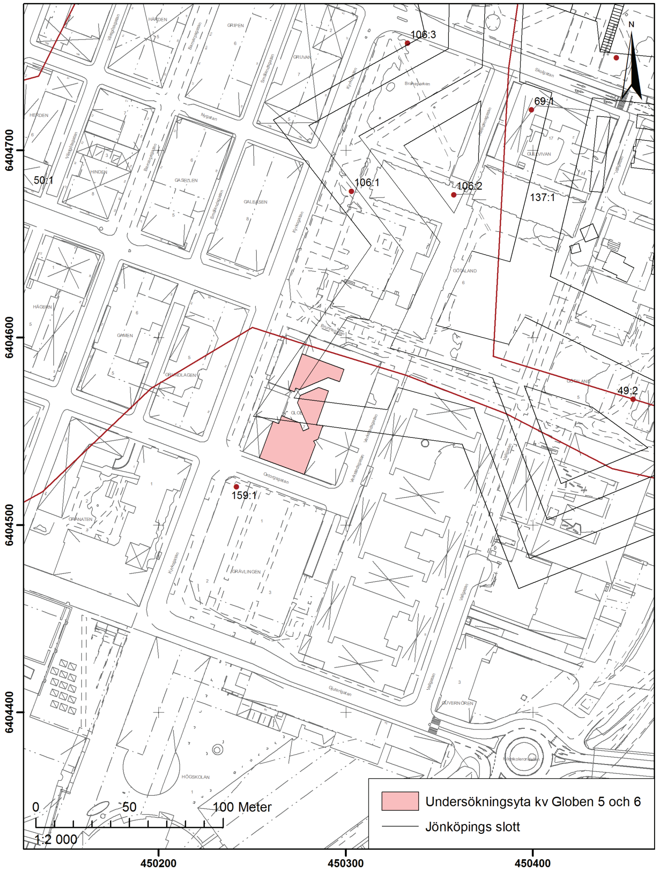
FIGUR 2. Utdrag ur Primärkartan för Jönköpings stad med undersökningsområdet markerat. Skala 1:4000.