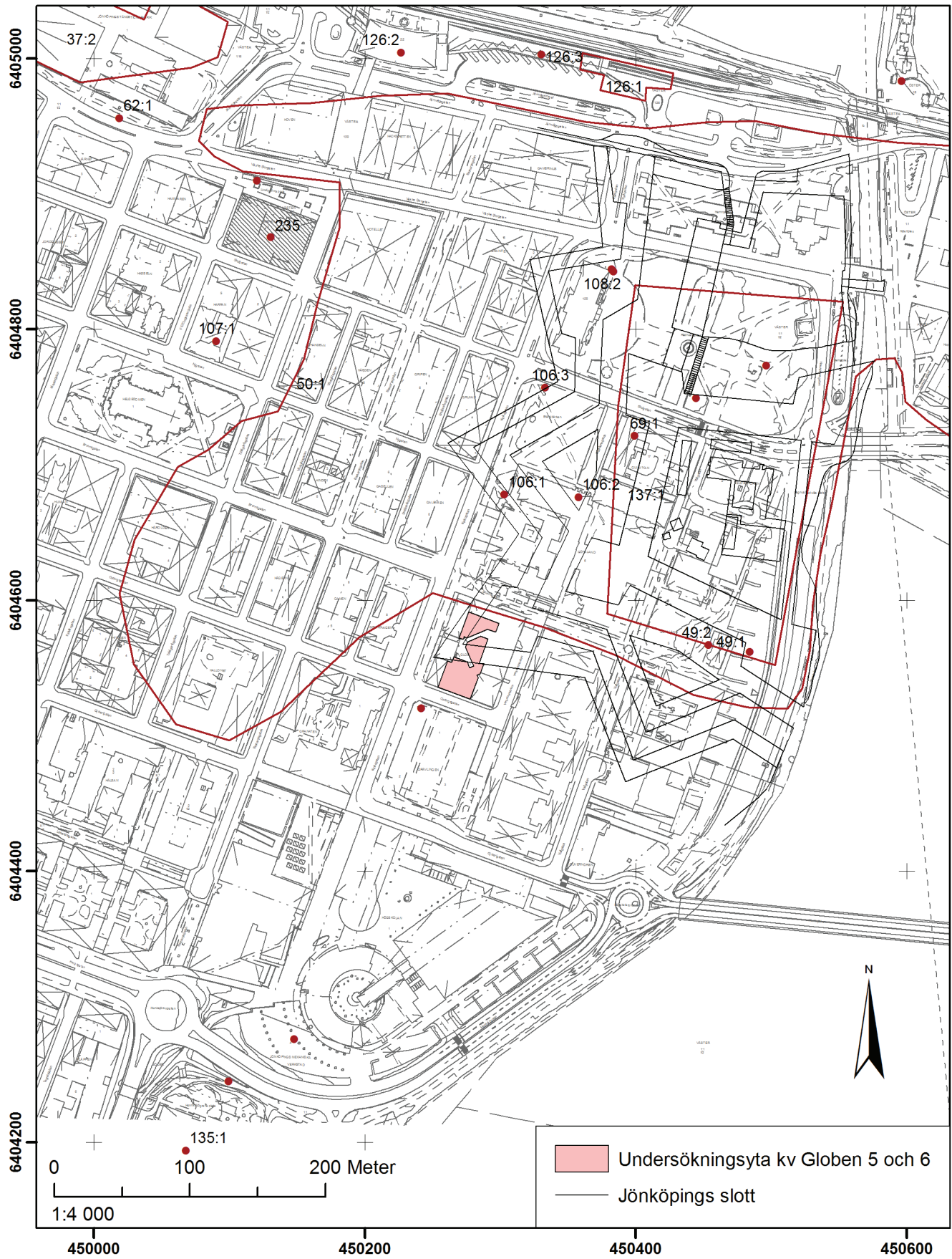
FIGUR 1. Översikts- och analyskarta. Undersökningsområdet i förhållande till Jönköpings slott. Skala 1:4000.