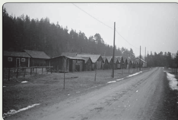
Kyrkstallarna 1943.

De flesta av de bevarade stallen har tillkommit under senare delen av 1800-talet och antalet stall utökades då kraftigt. De inrymmer vanligen en eller två spiltor, men tidigare fanns två större stall med vardera nio spiltor.