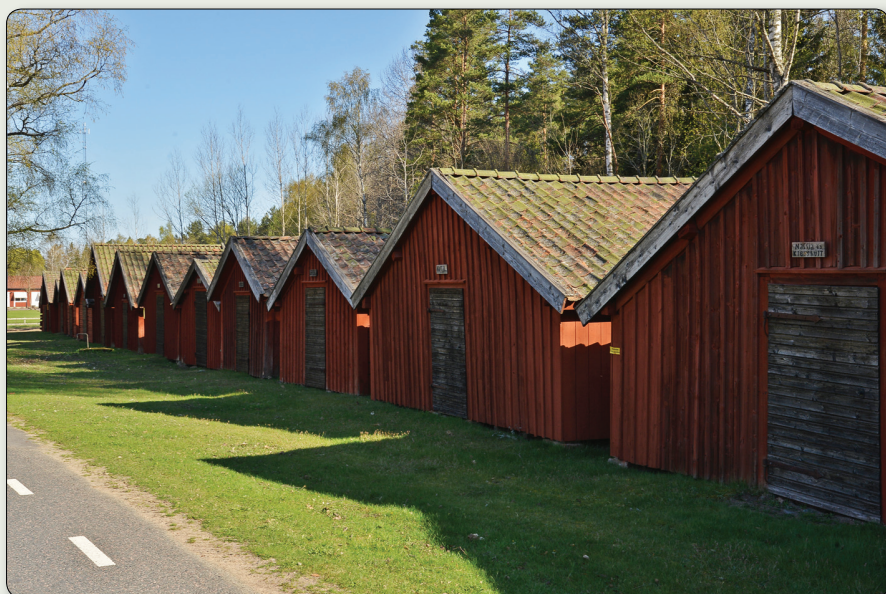
Kyrkstallarna i Åker.

N 6360214 / E 439790 (SWEREF 99 TM) // N 57° 22' 50,70", E 13° 59' 54,93" (WGS84)