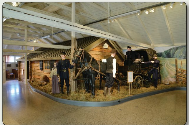
Det militärhistoriska museet Miliseum är inrett i lägerområdets gamla mathallar.

I dag är såväl byggnader som mark och miljö statligt byggnadsminne. År 2010 etablerades ett särskilt militärmuseum på Västra lägret – Miliseum. Museets syfte är att berätta historien om de indelta soldaterna och deras familjer samt vara nationellt museum för Ingenjörstrupperna.