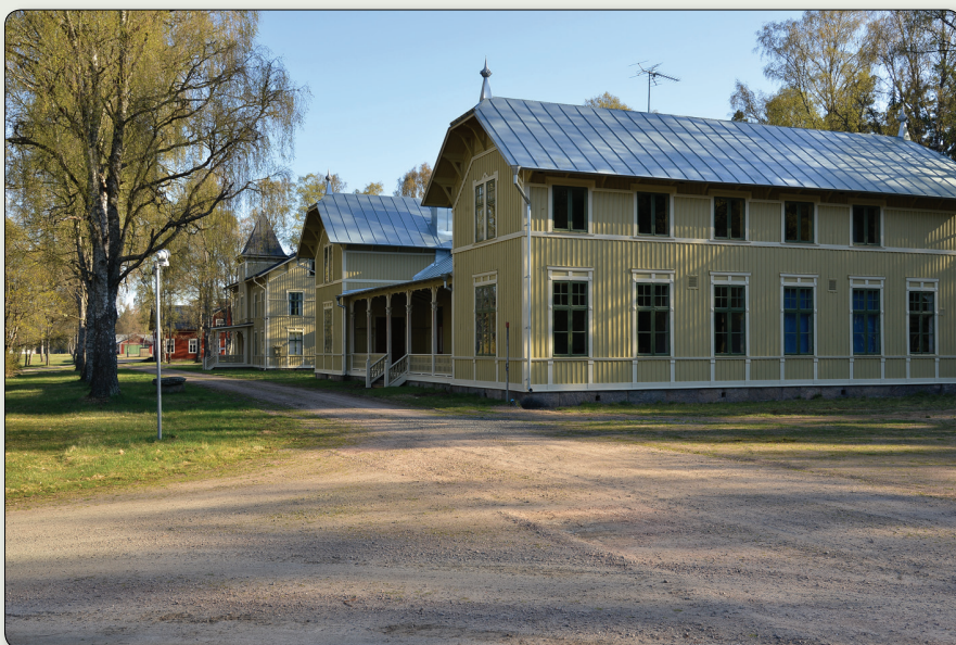
Bebyggelsen på Västra lägret består i hög grad av byggnader från decennierna kring sekelskifte 1900.

N 6365359 E 445973 (SWEREF 99 TM) // N 57° 25' 39,765", E 14° 6' 1,159" (WGS84)