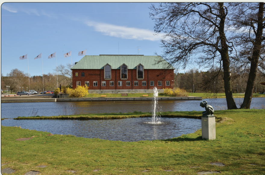
Stadshuset i Tranås är beläget invid Svartån.