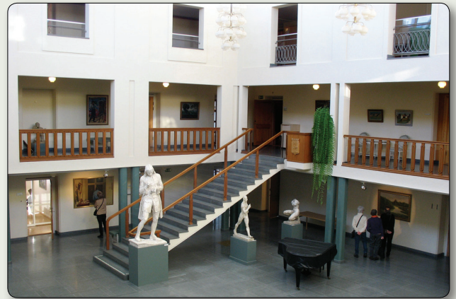
Ljushallen med den stora samlingen konstverk.

Stadshuset i Tranås fick påkostad utsmyckning och flera ledande designföretag medverkade. Orrefors glasbruk levererade belysning och några kända lokala möbelföretag tillverkade inredningen. Byggnaden utsmyckades också med konstverk. Skulptören Carl Milles "Europa och tjuren" är mest känd, men det finns ytterligare många konstverk i ljushallen. Fler-talet av dessa är konstnärer med lokal anknytning, som Runa Bülow-Hübe, Herman Norrman och Rolf Norrman.