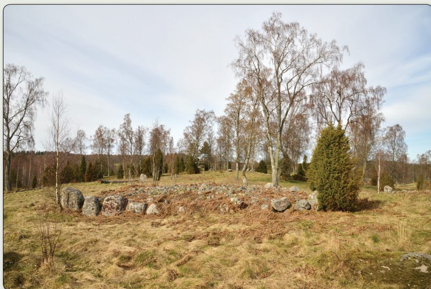
Madagravfältet. I förgrunden ligger ett kvadratisk röse med markerad kantkedja av större stenar.

N 6426965 / E 500201 (SWEREF 99 TM). N 57° 59' 3,56", E 15° 0' 12,26" (WGS84)