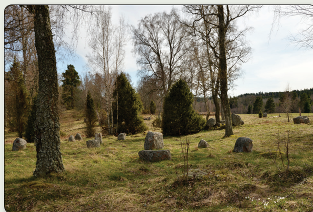
Madagravfältet är vackert beläget på krönet av en åsrygg.

Omkring 100 meter norr om gravfältet har en källa legat som kallades för Midsommarkällan. Den var en gång stensatt, men har med åren förstörts. Det har berättats att man under mitten av 1800-talet samlades vid källan första söndagen efter midsommardagen, enligt gammal tradition. Man klädde då källan med blommor och grönt och dansade på vägen intill. Hur gammal den här traditionen är vet vi inte, men intressant är att intill ett liknande gravfält i Fagertofta norr om Nässjö finns också en källa med namnet Midsommarkällan.